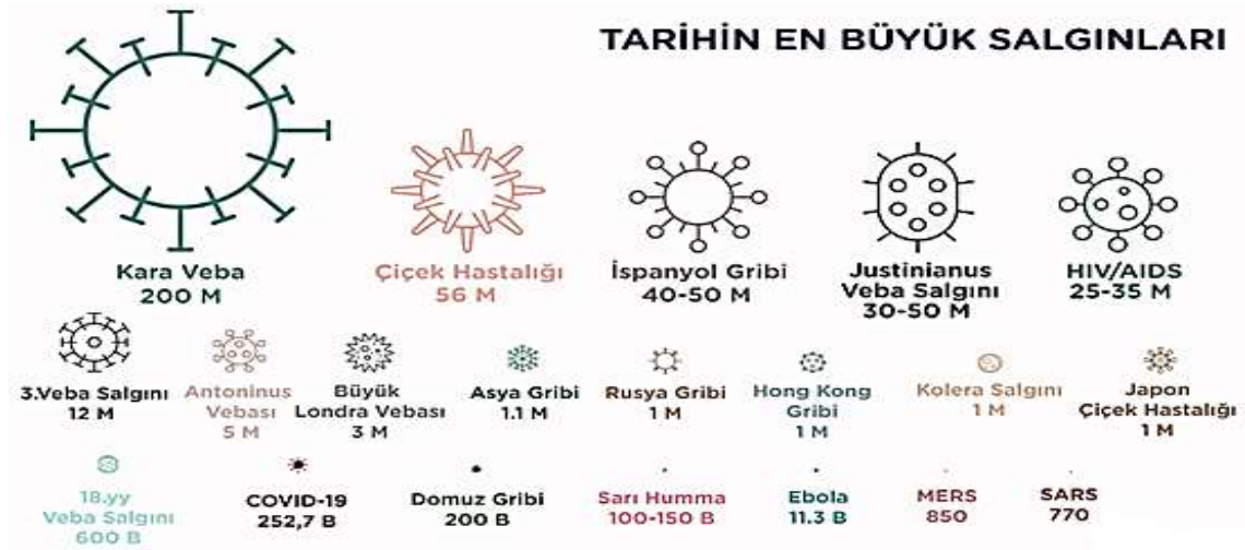
Şekil 1.1. Dünya Tarihindeki En Büyük Salgın Hastalıklar

Geçmiş dönemlerde salgın hastalıklar ile alakalı birçok vaka bulunmaktadır. Dünyada salgın hastalık olarak adlandırılan vakalar şekil 1.1’de gösterilmiş olup, Covid-19 öncesi başlıca on salgın hastalık incelenmiştir. Şekil 1.1’de gösterilen veriler 25 Mart 2020 verilerine dayanmaktadır.