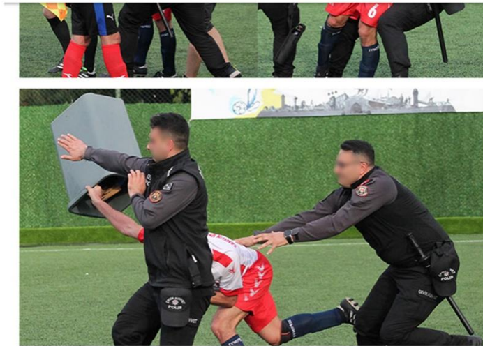
GörSEL 4.26: Hakeme çöp kovası fırlatan oyuncu.