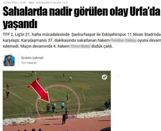
Görsel 4.12: Sakatlanan Hakem yerini 4. hakeme bıraktı haber görseli.

Haber 12: 04 Ocak 2022 tarihinde yayınlanan habere göre; “TFF.2 lig beyaz grupta 21. Hafta Şanlıurfaspor ile Eskişehir arasında oynanan müsabakada orta hakem maçın 37. Dakikasinda sakatlandı. Hakem’e sağlık ekipleri müdahalede bulundu. Ancak ağrıları devam eden tecrübeli hakem oyuna devam edemeyeceğini söylemesi üzerine maçın 4. hakemi hazırlandı ve müsabakanın kalan dakikalarını yönetti” (Urfanatik, 2022) ( Görsel 13).