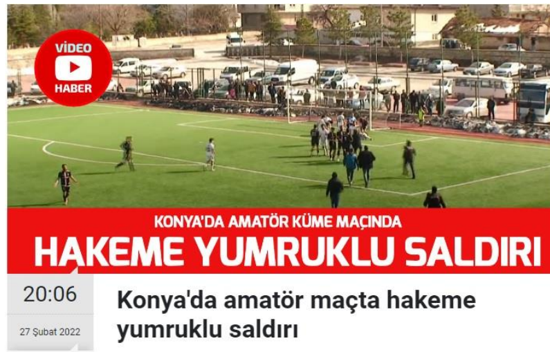
Görsel 4.8: Müsabaka esnasında hakeme yumruklu saldırı haber görseli.

Haber 8: 27 Şubat 2022 tarihinde yayınlanan habere göre; “Kadınhanı Belediyespor’la Anadolu Kartalspor arasında Kadınhanı’nda oynanan maç, hakeme yumruklu saldırı nedeniyle tatil edildi” (Pusula Haber, 2022) (Görsel 9).