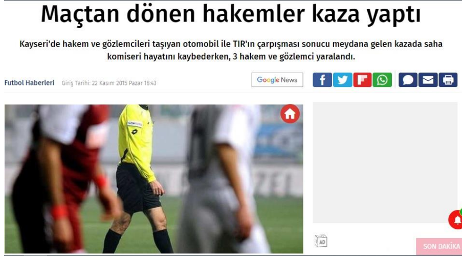
Görsel 4.1: Maçtan Dönen hakemlerin Kaza haber görseli.

Haber 1: 22 Kasım 2015 Tarihinde yayınlanan habere göre Kayseri ilinde Müsabakaya giderken kullandıkları otomobille tırın çarpışması sonucunda meydana gelen kazada 3 hakem ve gözlemci yaralanırken müsabakanın saha komseri vefat etmiştir (Fotomaç, 2015) (Görsel 2).