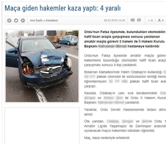
Görsel 4.20: Ordu’da Maça Giden Hakemler Kaza yaptı 4 yaralı.

Haber 20: 09 Şubat 2019 tarihinde yayınlanan habere göre; “Ordu’nun Fatsa ilçesinde, buldukları otomobilin hafif ticari araçla çarpışması sonucu yaralanan amatör maçta görevli 3 hakem ve İl Hakem Kurulu Başkanı hastaneye kaldırıldı” (Olay53.com, 2019) (Görsel 21).