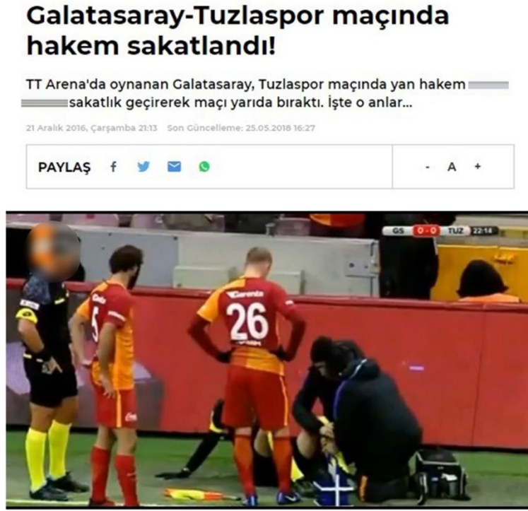
Görsel 4.7: Müsabaka esnasında sakatlanan hakeme ait haber görseli.

Haber 7: 21 Aralık 2016 Tarihinde yayınlanan habere göre; “TT Arena'da oynanan Galatasaray, Tuzlaspor maçında yan hakem sakatlık geçirerek maçı yarıda bıraktı” (Fanatik, 2016) (Görsel 8).