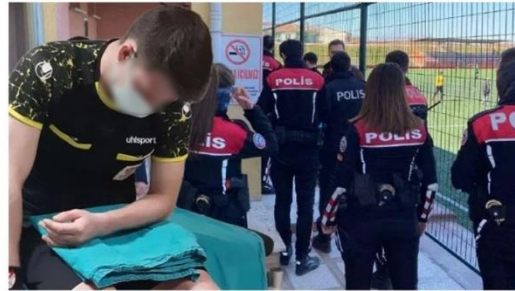
Görsel 4.14: Edirne'de Futbol maçında kavga hakemler yaralandı haberi.