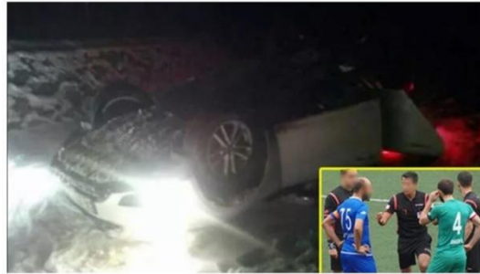
Görsel 4.2: Takla atan araçtan maça giden hakemlere ilişkin haber görseli.