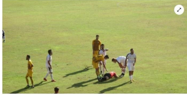
Görsel 4.9: Müsabaka esnasında hakeme saldırı haber görseli.

Kuşadası'nda oynanan Türkiye Bölgesel Amatör Lig (BAL) maçında, karşılaşmanın orta hakemi [redacted] in yan çapraz bağları koptu. Sakatlanan hakem hastaneye kaldırılıp tedavi altına alınırken, maç 4. hakemle devam etti.