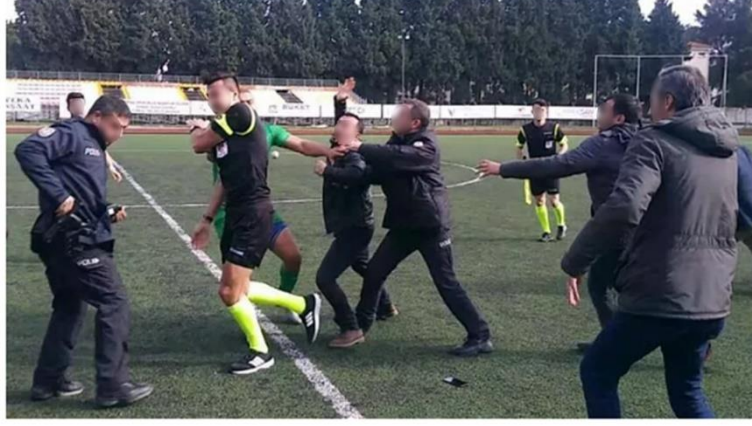
Görsel 4.21: Hakem teknik ekip, futbolcular ve taraftarları tarafından darp edildi.

Haber 22: 26 Nisan 2016 tarihinde yayınlanan habere göre; “ Trabzonspor-Fenerbahçe maçında 17 yaşındaki taraftar tarafından darp edilen çizgi hakemi o anları anlattı "Önce sırtıma ve hemen sonrasında tekme ile tam kalbimin üzerine darbe aldım. Önce sahada sonra soyunma odasında nefesim kesildi" (Cumhuriyet, 2016 ( Görsel 23).