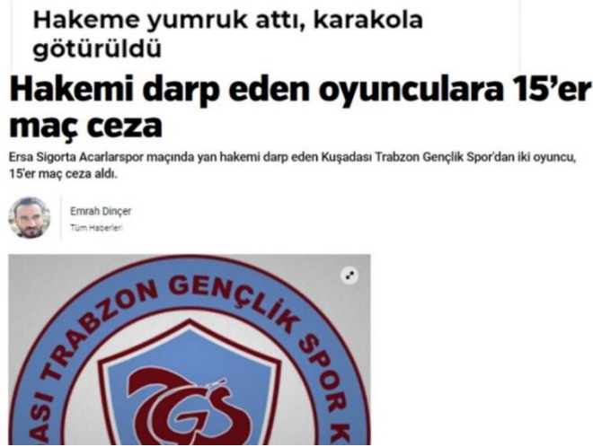
Görsel 4.17: Maçın Hakemini darp eden oyunculara 15'er maç ceza verildi.

Haber 17: 06 Mart 2022 tarihinde yayınlanan habere göre; “Aydın Süper Amatör Lig 1. Grup’ta ligde kalma mücadelesi veren Kuşadası Trabzon Gençlik Spor, Ersa Sigorta Acarlarspor’u evinde ağırlamıştı. Kuşadası TFF Sahası’nda oynanan maçın 31. dakikasinda Acarlarspor 2-0 öndeyken, Kuşadası Trabzonlu futbolcu, bir pozisyonda faul beklemiş, yan hakem pozisyonu faul olarak değerlendirmemişti. Yan hakeme hakaret eden oyuncunun, kırmızı kart görmesinin ardından oyuncu ile takım arkadaşı, yan hakemi darp etmişti. Yaşanan gerginliğin ardından, güvenlik gerekçesiyle maçın geriye kalan kısmı oynanmamıştı.” (Ses Gazetesi, 2022) ( Görsel 18).