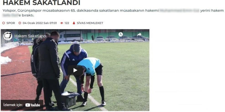
Görsel 4.11: Müsabakanın Hakemi sakatlandı yerini yardımcı hakem aldı haber görseli.

Haber 11: 04 Ocak 2022 tarihinde yayınlanan habere göre; “Yolspor, Gürünşalspor mücadelesinde Sivas bölgesi il futbol hakemi düdük çaldı. Maçın hakemi, maçın 60. dakikasinda adalesinde yaşanan sorun sebebiyle maçın sağlık görevlisinin yardımını istedi. Sakatlığı devam eden maçın hakemi müsabakanın 65. dakikasinda yerini yardımcı hakeme devretti” (Memleket, 2022) ( Görsel 12).