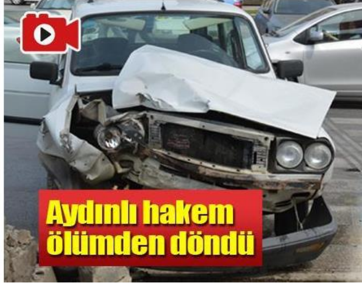
Görsel 4.19: Aydın’da hakemin yaşadığı trafik kazasına ilişkin haber.

Haber 19: 19 Nisan 2018 tarihinde yayınlanan habere göre; “Aydın’da amatör lig hakemi trafik kazası geçirdi. Hastaneye kaldırılan hakemin sağlık durumunun iyi olduğu öğrenildi” (Denge, 2018) (Görsel 20).