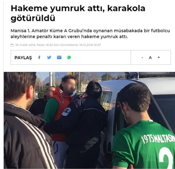
Görsel 4.28: Hakeme yumruk atan oyuncu karakola götürüldü.

Haber 28: 18 Aralık 2016 tarihinde yayınlanan habere göre; “Manisa 1. Amatör Küme A Grubu'nda oynanan müsabakada bir futbolcu aleyhlerine penaltı kararı veren hakeme yumruk attı.” (Fanatik, 2016) (Görsel 29).