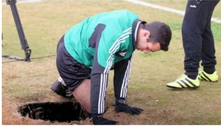
Görsel 2.1: Açık unutulmuş çukura düşen hakem

2017’de İsrail’de bir hakem saha kenarında açık unutulmuş çukura düşerek sakatlanma yaşamıştır (Fanatik, 2017).