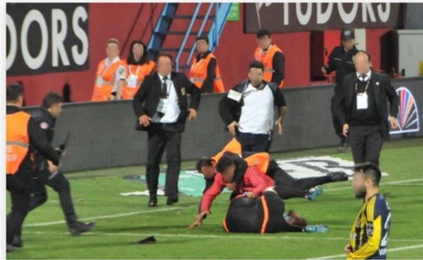
Görsel 4.22: Hakeme tekme ve yumruklu saldırı.