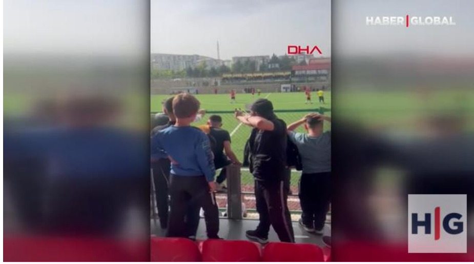
Görsel 4.27: Bir Taraftarın sahadaki futbolcu ve hakeme sapanla taş atarken görüntüsü.

Haber 27: 30 Nisan 2022 tarihinde yayınlanan habere göre; “Elazığ'da, Bölgesel Amatör Lig'de oynanan maçta bir taraftarın yanında getirdiği sapanla, sahadaki futbolcu ve hakemlere taş fırlattığı anlar başka bir taraftar tarafından cep telefonu kamerasıyla kaydedildi” (Haber Global, 2022) (Görsel 28).