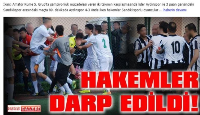
Görsel 4.18: Hakemler Darp Edildi.

Haber 18: 16 Mart 2014 tarihinde yayınlanan habere göre; “İkinci Amatör Küme 5. Grup’ta şampiyonluk mücadelesi veren iki takımın karşılaşmasında lider Aydınspor ile 3 puan gerisindeki Sandıklıspor arasındaki maçta 89. dakikada Aydınspor 4-3 önde iken hakemler Sandıklısporlu oyuncular tarafından darp edilince maç tatil edildi” (Denge, 2014) ( Görsel 19).