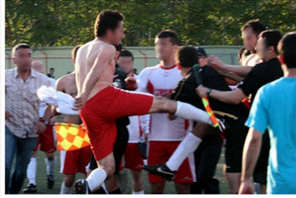
Kocaeli 2. Amatör Lig'de Bağçeşmespor ile Halidere Belediyespor arasında oynanan maçın ardından, Halidere futbolcuları maçın hakemini tekme tokat dövdü.