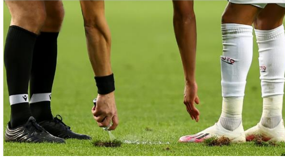
Görsel 4.13: Süperlig maçında sakatlanan yardımcı hakem yerini AVAR hakemine bıraktı haber görseli.

Haber 14: 23 Mart 2022 tarihinde yayınlanan habere göre; “Kredi yurtlar kurumu'nun düzenlediği ve yurt öğrencileri arasında oynanan müsabakada, hakemin penaltı kararı vermesiyle çıkan tartışma sonucunda futbolcuların hakeme top ve krampon atarak saldırdığı ve hakemin yaralandığı, 6 oyuncunun gözaltına alındığı, hakemlerin ise şikayetçi oldukları bilgisi edinilmiştir” (Hürriyet, 2022) ( Görsel 15).