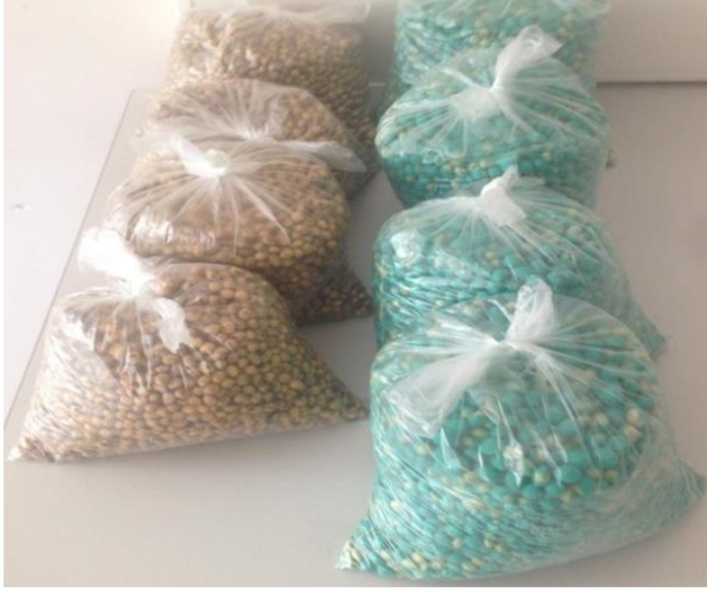
Resim 3. 3. Bakteri ařılması ve peletle kaplama yapılmıř soya fasulyesi tohumları

Resim 3.4.'de bakteri ařılması ve peletle kaplama yapılmıř soya fasulyesi tohumlarının grseli bulunmaktadır. Resim 3.5.'te ise ekim iřlemine ait grsel bulunmaktadır. izelge 3.5.'te tarımsal iřlemler ve soya fasulyesine ait fenolojik gzlemler bulunmaktadır.