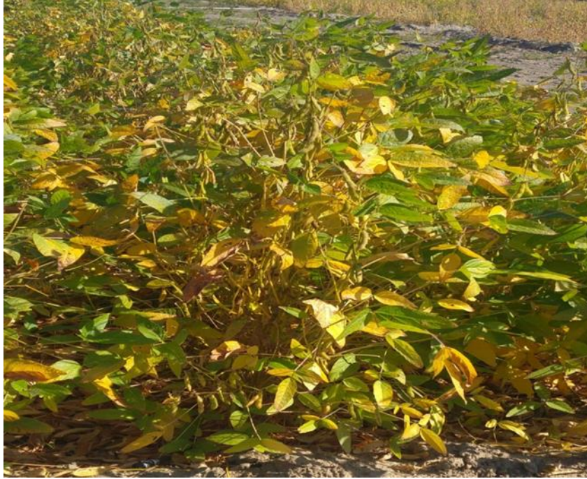
Resim 4. 5. Olgunlaşma dönemi