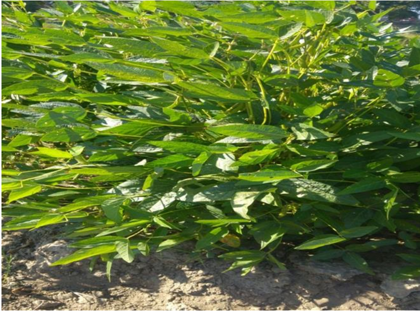
Resim 4. 3. Bakla oluşum dönemi