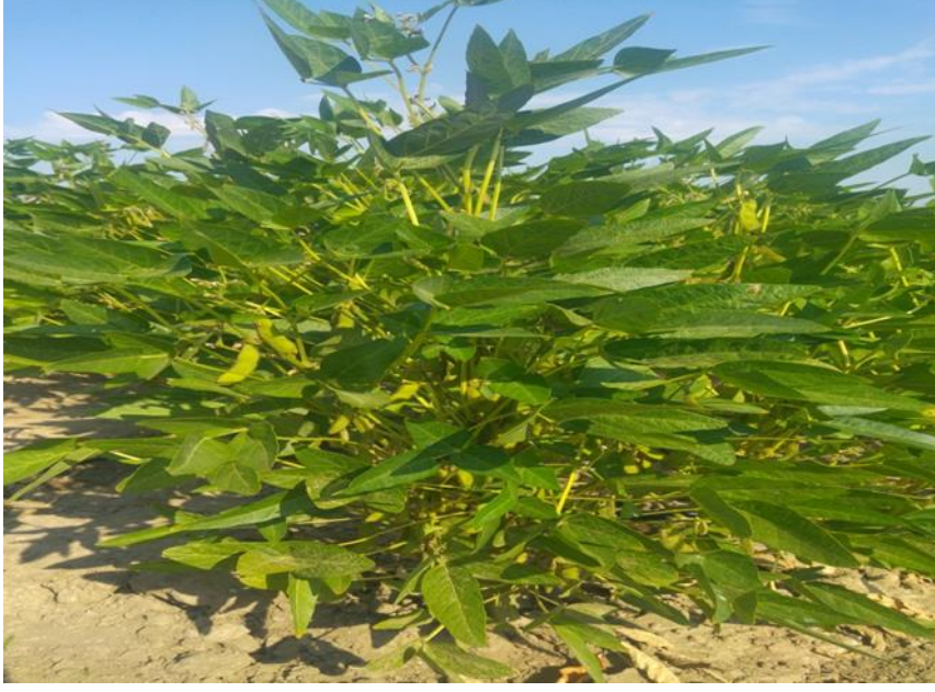
Resim 4. 4. Tane gelişim dönemi