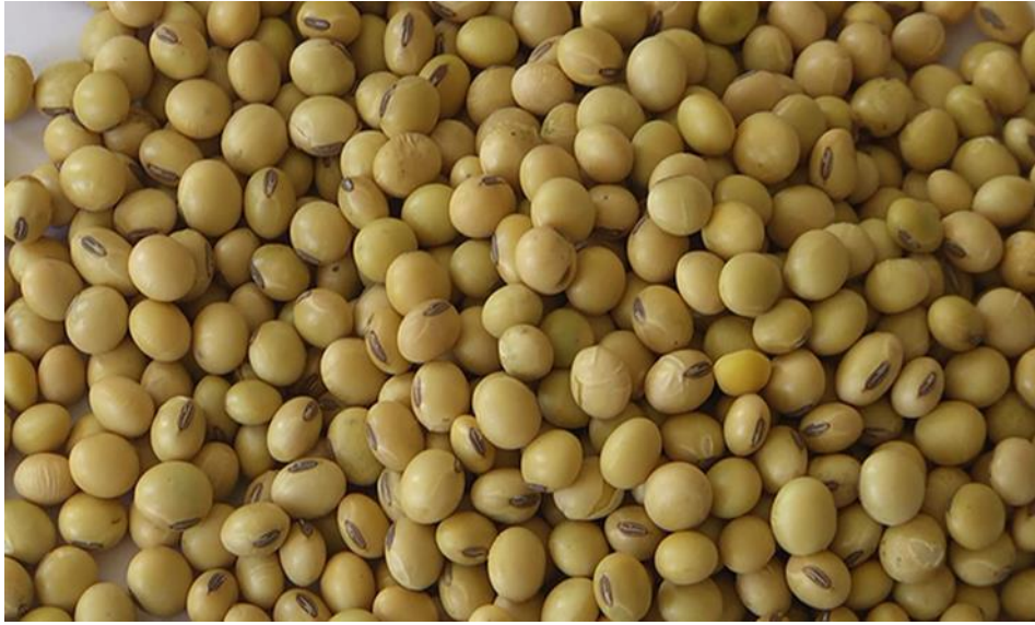
Resim 3. 1. Altınay soya fasulyesi tohumu

alıřmada, Ege Tarımsal Arařtırma Enstitüsünce geliřtirilen ve Resim 3.2’de görülen "Altınay" soya eřidi kullanılmıřtır. Anılan eřit Ege, Akdeniz ve Güneydoęu Anadolu Bölgeleri kořullarına uygun 2017 yılında ıslah edilmiř yeni bir eřittir. eřide ait bazı özellikler; bitki boyu 114-122 cm, ilk bakla yükseklięi 21-24 cm, ortalama verim 250-550 kg, yüz tane aęırlıęı 19-21 g, yaę oranı % 17-24, protein oranı % 34-39’dur (Anonim, 2021b).