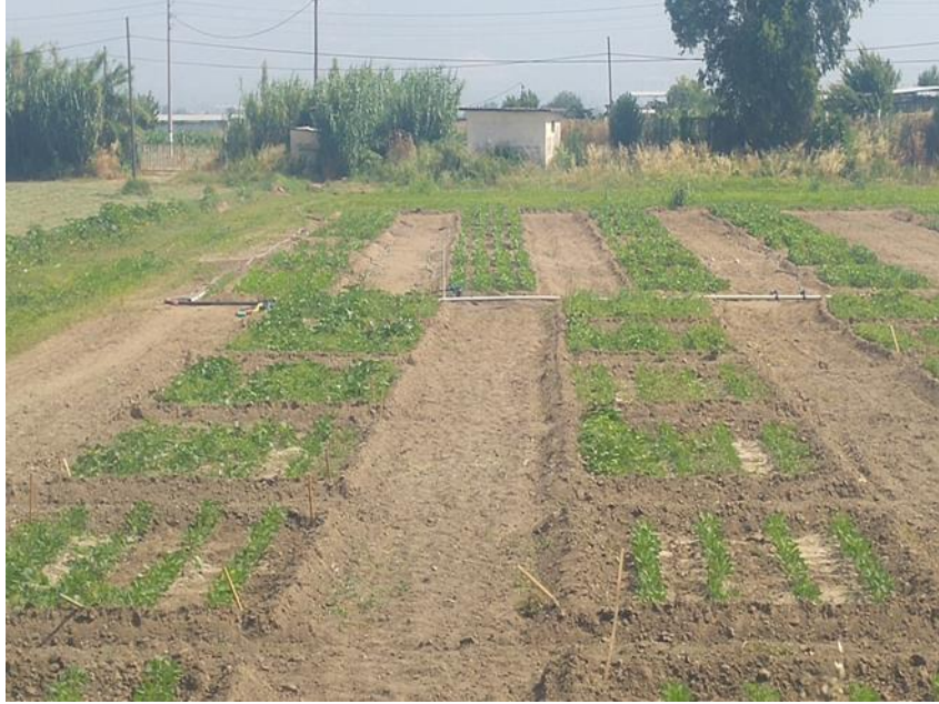
Resim 4. 1. Vejetatif dönem

Altınay soya fasulyesi çeşidi 11.05.2018 tarihinde ekilmiştir. Ekimden yaklaşık 2 hafta sonra çıkış gerçekleşmiştir. Çiçeklenme başlangıcı ise ekimden 45 gün sonra meydana gelmiş ve ekimden 60 gün sonra tam çiçeklenme görülmüştür. Çiçeklenmeden yaklaşık 15 gün sonra bakla oluşumu gözlemlenmiş ve bakla oluşumundan yaklaşık 28 gün sonra da tane gelişimi başlamış ve bu dönem yaklaşık 7 gün sürmüştür.