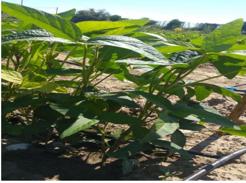
Resim 4. 2. Çiçeklenme dönemi