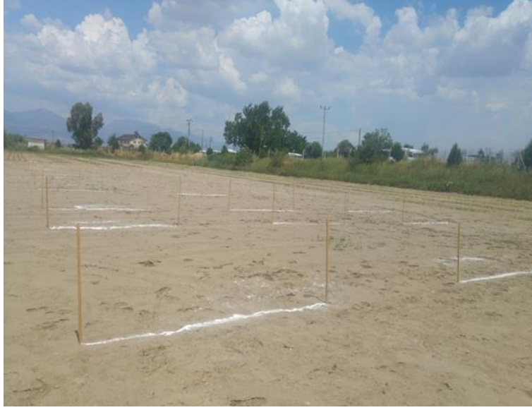
Resim 3. 2. Kirele belirlenen hatlar

Resim 3.4.'de bakteri ařılması ve peletle kaplama yapılmıř soya fasulyesi tohumlarının grseli bulunmaktadır. Resim 3.5.'te ise ekim iřlemine ait grsel bulunmaktadır. izelge 3.5.'te tarımsal iřlemler ve soya fasulyesine ait fenolojik gzlemler bulunmaktadır.