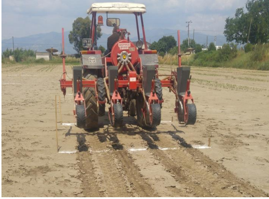
Resim 3. 4. Pnömatik (havalı) mibzerle ekim