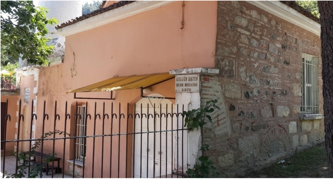
Resim 12. Manisa Gülgün Hatun Dere Mescidi