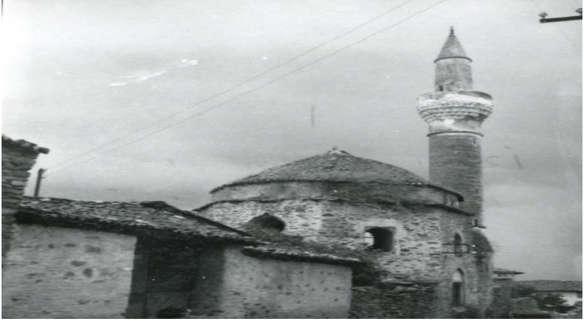
Resim 5. Tire Gürcü Melek Hatun Cami