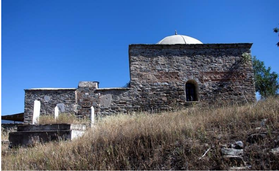
Resim 2. Yakup Beyin kızı Hafsa Hatun türbesi-AZİZABAT/AYDIN (22.04.2021)