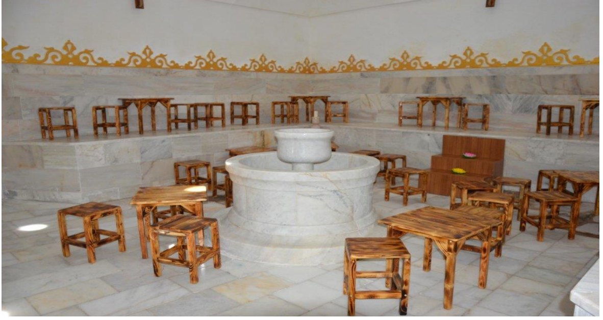
Resim 15. Manisa Gülgün Hatun Hamamı