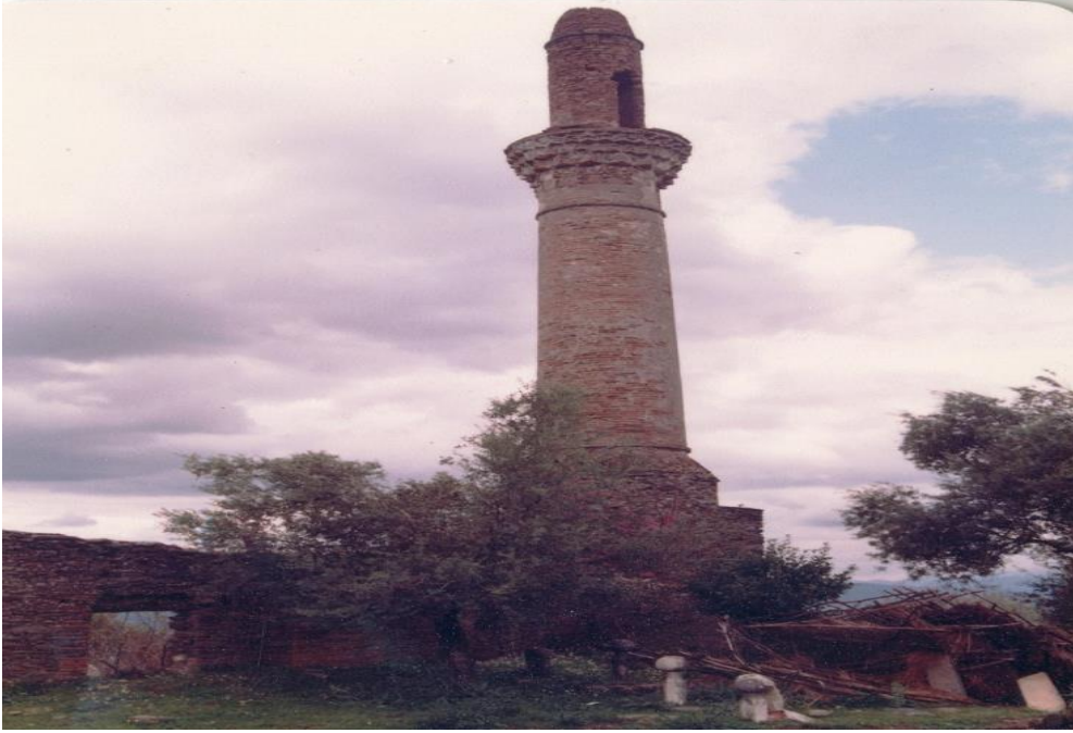
Resim 4. Tire Hafsa Hatun Cami