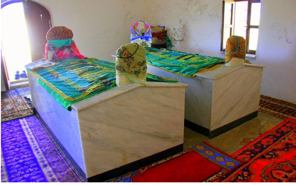
Resim 3. Yakup Beyin kızı Hafsa Hatun Türbesi