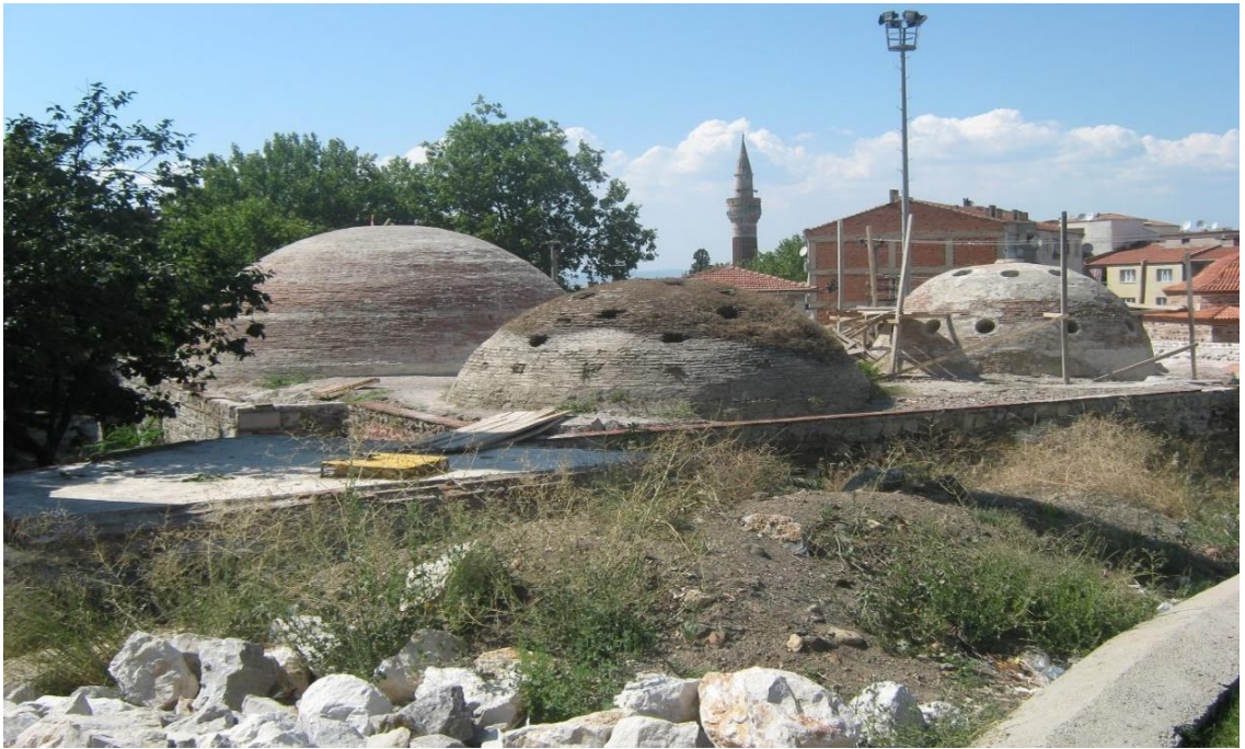
Resim 10. Manisa Gülgün Hatun Hamamı