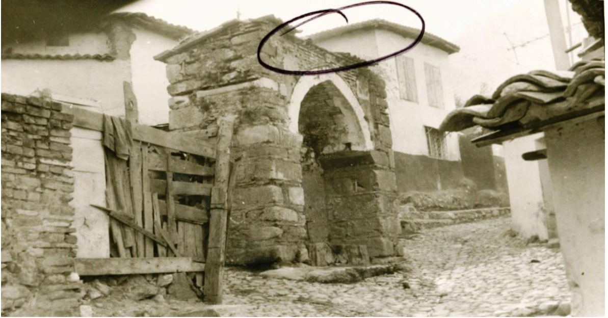
Resim 8. Manisa Gülgün Hatun Hamamı