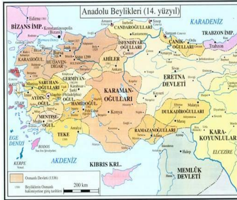
Resim 1. Batı Anadolu Beylikler Dönemi Haritası