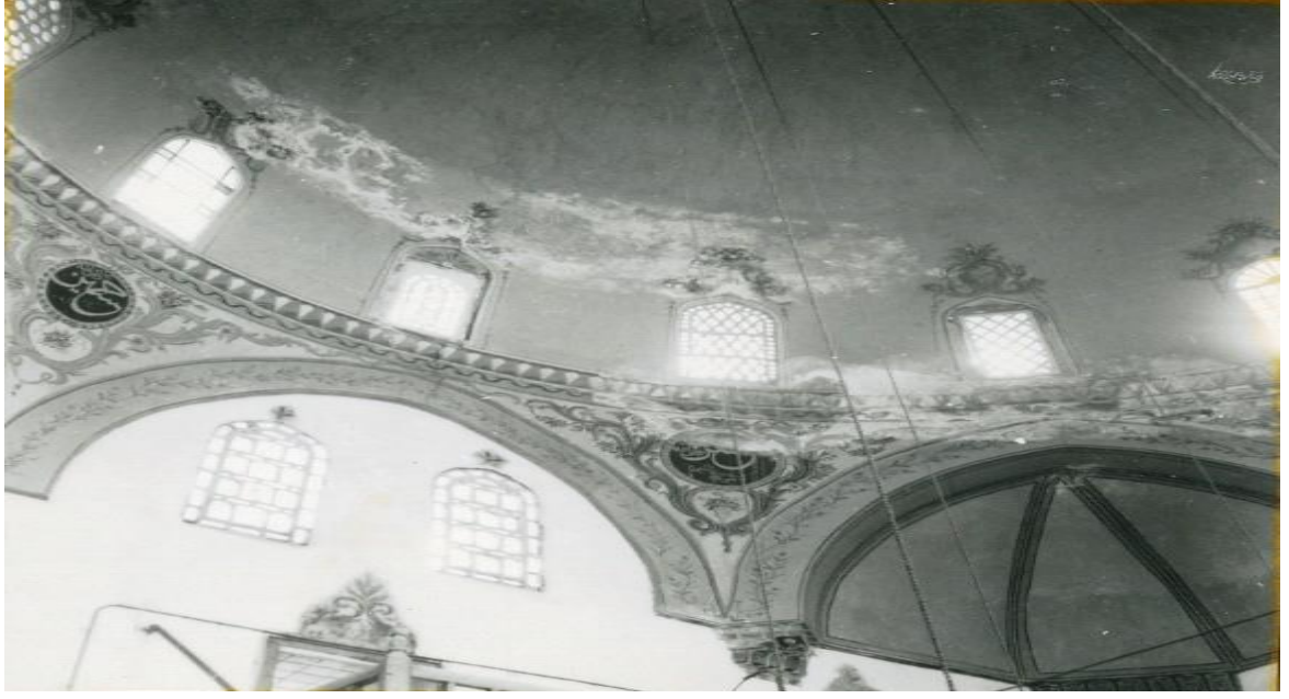
Resim 7. Tire Gürcü Melek Cami