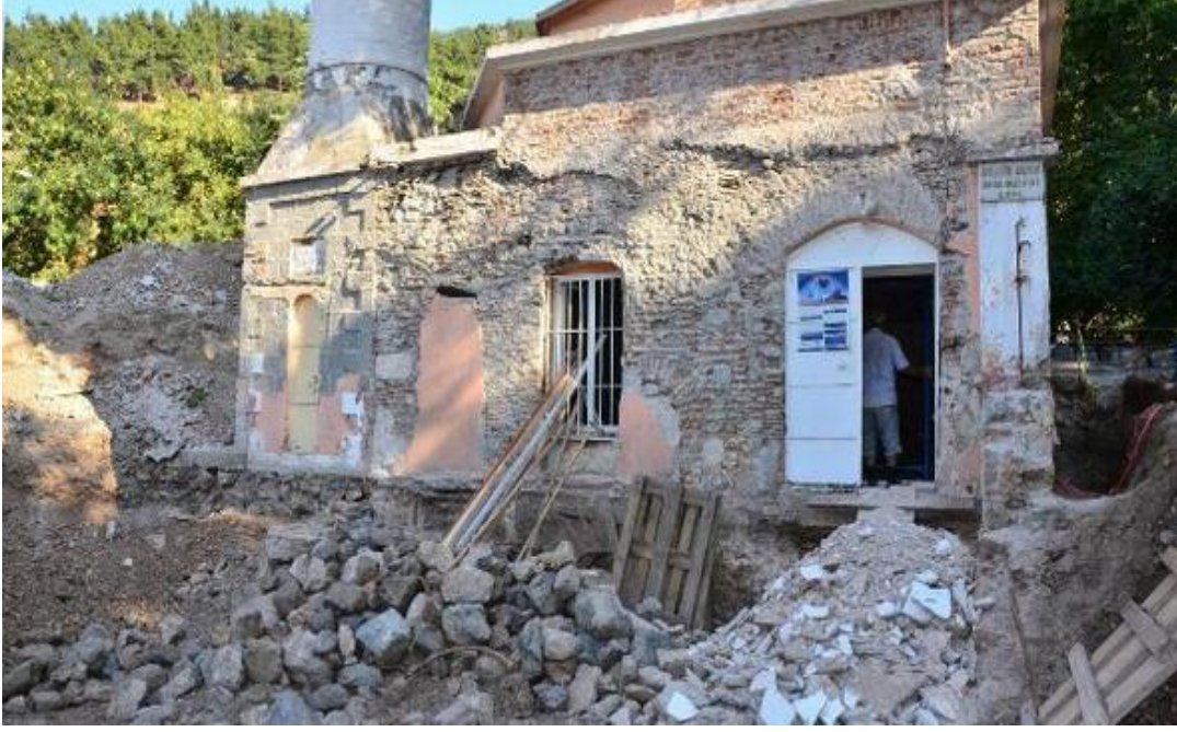
Resim 11. Manisa Gülgün Hatun Dere Mescidi, (06.05.2021)