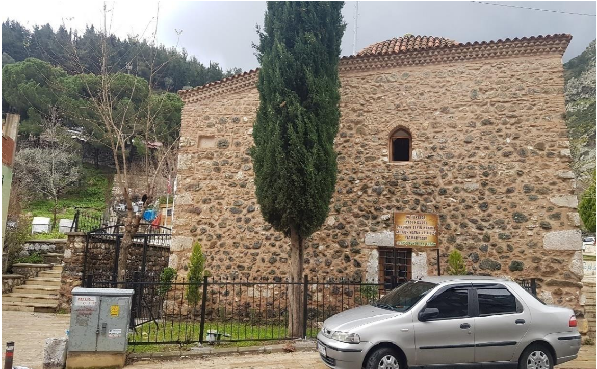
Resim 14 Manisa Gülgün Hatun Türbesi (Bu Görsel; VGM İzmir Bölge Müdürlüğünden alınmıştır. )