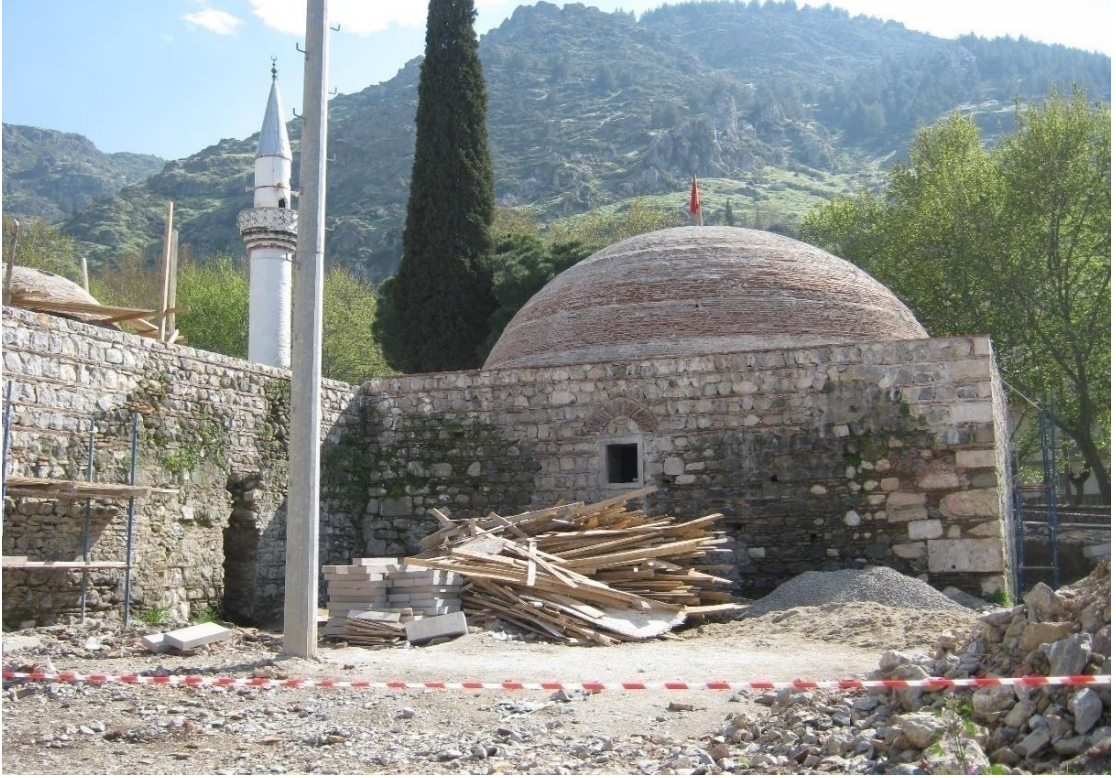
Resim 9. Manisa Gülgün Hatun Hamamı