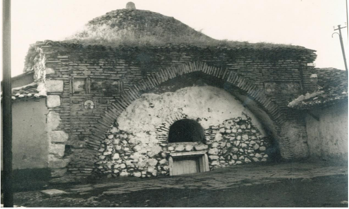
Resim 13. Manisa Gülgün Hatun Türbesi