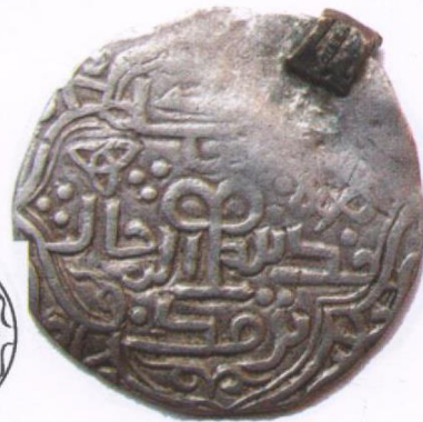
ДАРМАШИРИН ХААНЫ мөнгөн зоос. Термез 769AH . A-1992. Florian.,Tubingen.,1101