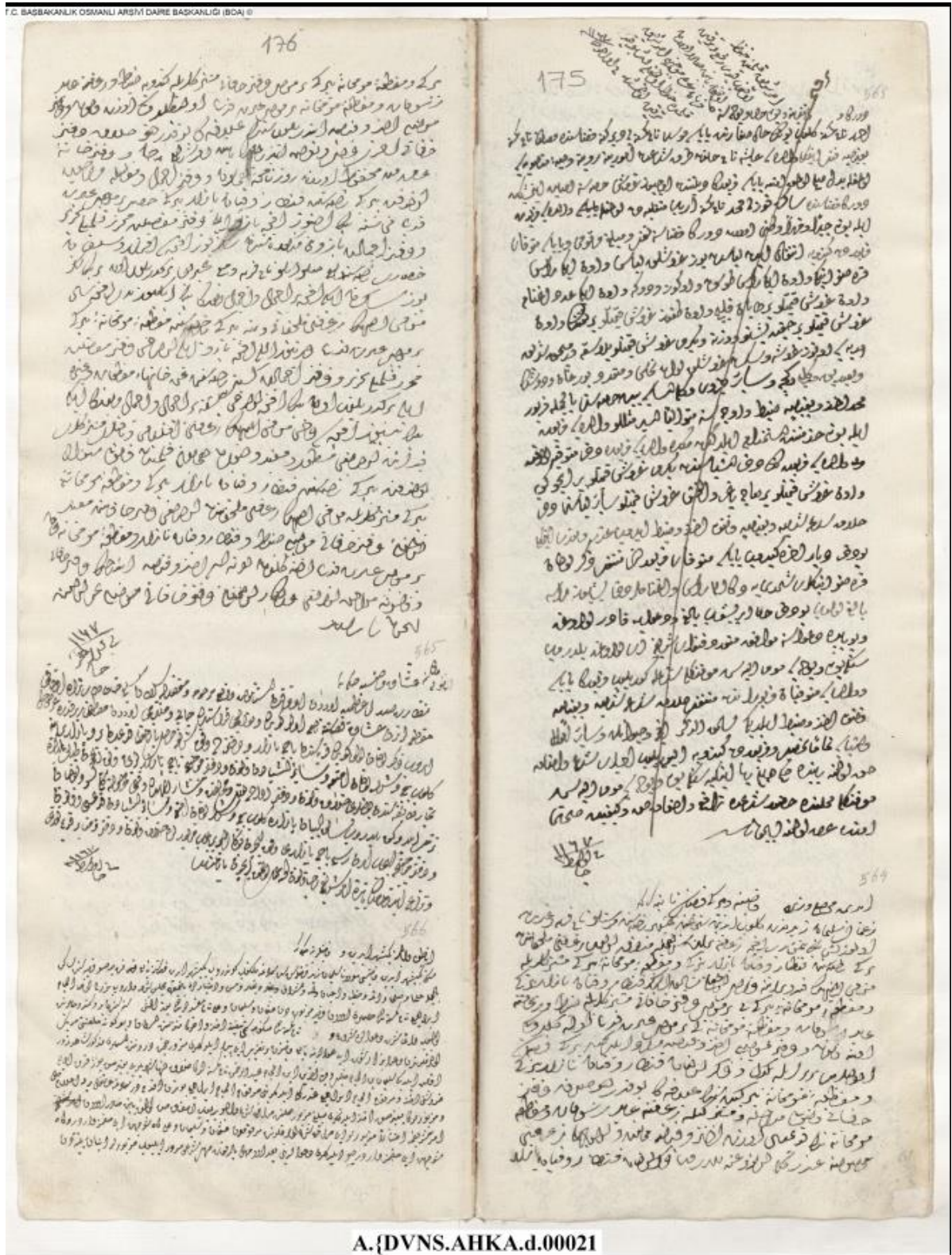
Kaynak: BOA, A. [DVNS.AHKA.d., 21, s. 176, hk. 566.