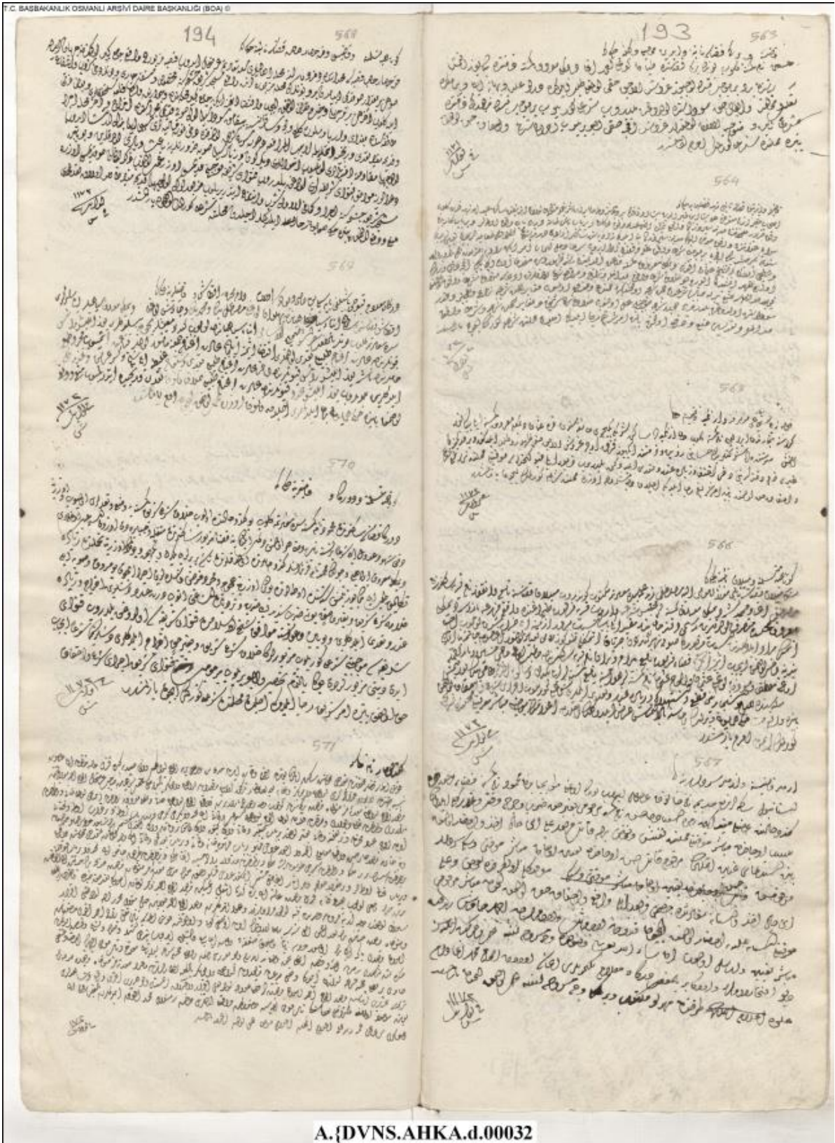
Ek 6. Kadınların var olan miras haklarının haksız tasarruf edildiğine dair evail Şaban H. 1172 / M. Mart-Nisan 1759 tarihli belge.