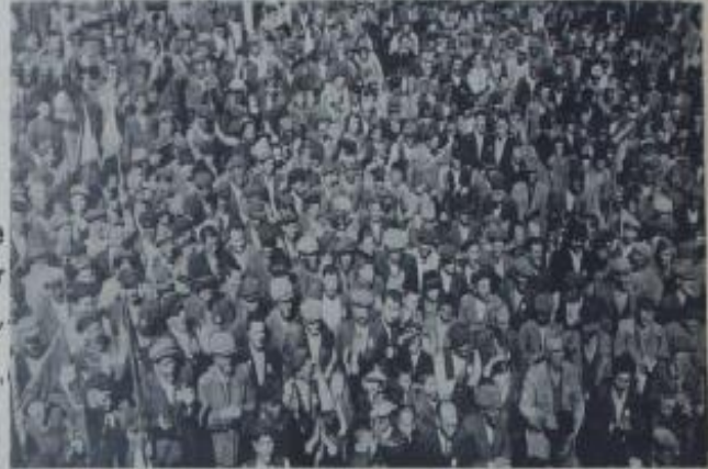
Bu Çankırı'da Cumhuriyetçi Parti meclisi her ay düzenli olarak toplanıyor ve konuşuluyor.

Bayar halka "şiddete mi uğradınız, şiddet mi tathik ettiniz?," diye sordu ve hep bir ağızdan "şiddete uğradık, cevabını aldı"