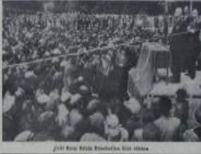
28. yıl Bayar Kastamonuda büyük mitingde

Kastamonu'da yapılan toplantıda C. Bayar, malî politikayı tenkid etti. Bayar, Marshall plânının Türkiye için büyük bir önem taşıdığını belirtti. Bayar, malî politikayı tenkid etti.