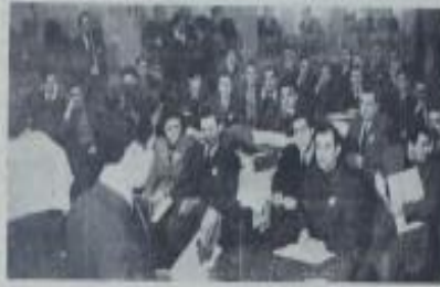
Yüksek Kurul'da yapılan toplantı

Amerika'nın Rusya'ya karşı tutumunu açıkladı