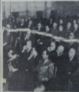
Yüksek Seçim Kurulu Başkan vekili bir demeçle bu hususu teyid etti

Yargıtay Başkanı, yeni bir demeçle, milletvekili seçildiği takdirde tahakkukuna çalışacağı hizmetleri açıkladı