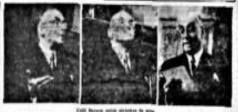
Celâl Bayar ve diğerleri ile...