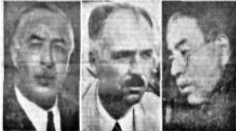
Büyük Kongre başkanlığı... Mustafa Kemal Atatürk...

Mareşal ve Celâl Bayar için yapılan tezahürat. Atatürkün muvakkat kabrini ziyaret meselesindeki heyecanlı müzakereler