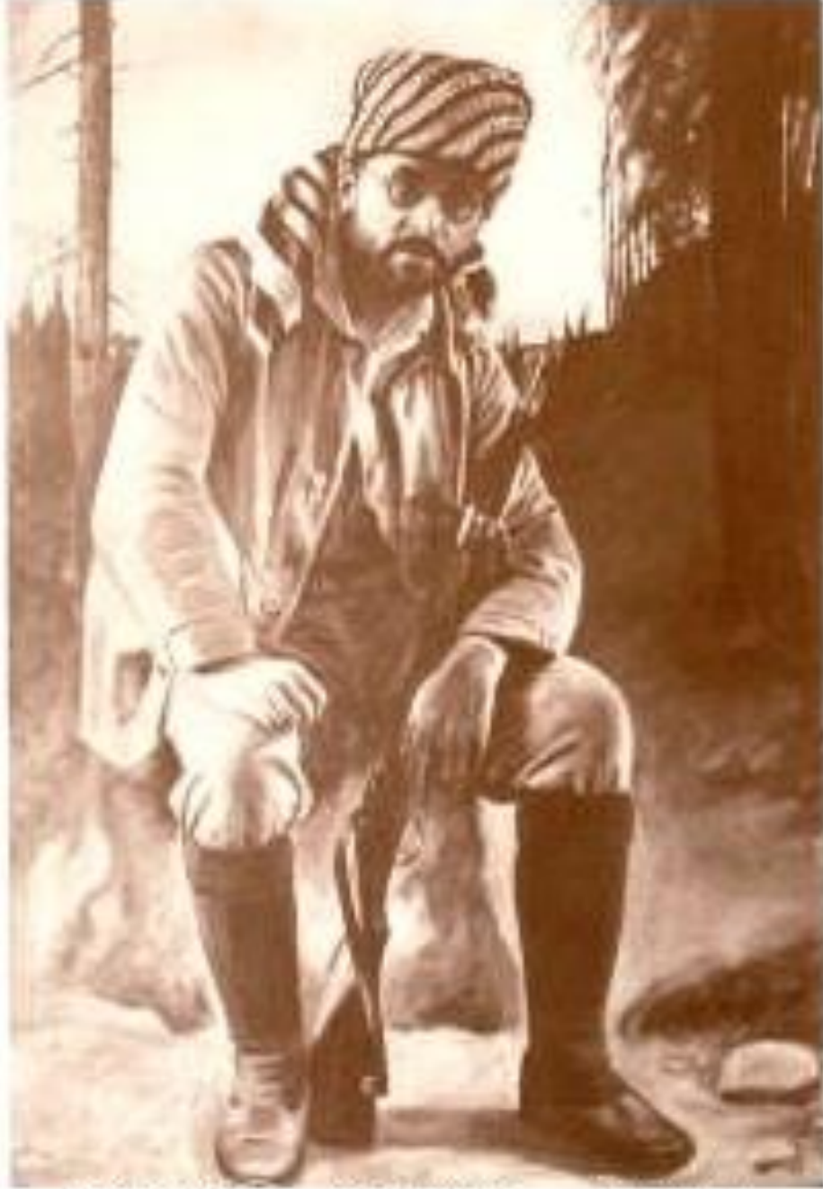
Galip Hoca (Celal Bayar) 1919

İSTİKLAL SAVAŞININ GALİP HOCASI CELÂL BAYAR