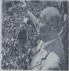
İsmet İnönü'nün fotoğrafı