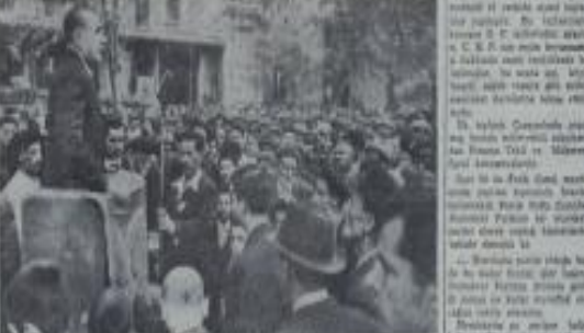
İstanbul'da dün yapılan toplantıda C. Bayar'ın konuşması

Partiler dün de İstanbul, Ankara, Konya, Bursa, İzmir ve daha bir çok illerde açık hava toplantıları yaptılar. D.P. bugün İnönü gezisinde büyük bir miting yapacak.