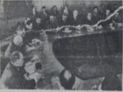
Bolu'da dün Türkiye genelinde basın konferansı