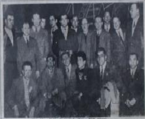
Gaziantep 1950 - 1951

Meclis'in dün Meclis üyeleri tarafından Af Kanunu tasarısı görüşüldü. Milletvekilleri, tasarının genişletilmesini istiyor. Demokrat Milletvekilleri Meclise dün mühim bir önerge verdiler. Tasarının müzakeresine bugün devam olunacak.