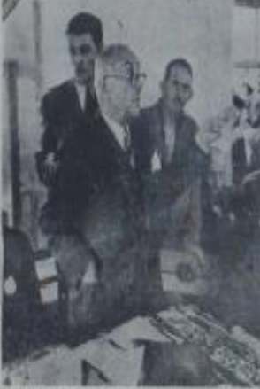
Demokratik Parti Meclisi üyesi Celâl Bayar Çankırı'da konuşuyor.

Mütefekkirler, politikacılar, gazeteciler hata mı ediyorlar?