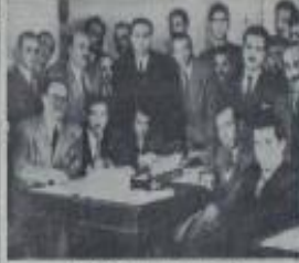
D.P. liderleri basın toplantısında.

On iki Bakan milletvekili seçilmediler, üç Bakanın vaziyeti henüz kat'i olarak belli değil