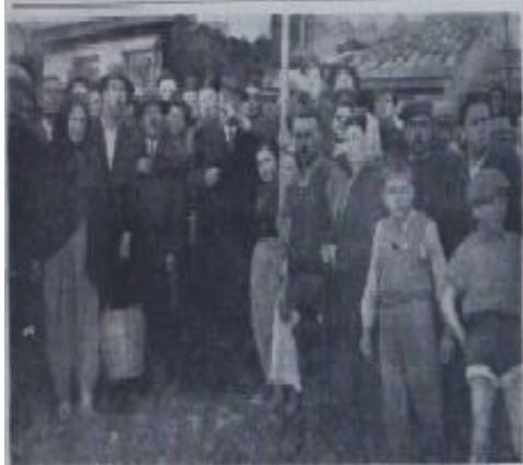
Yeni Meclis üyeleri oturmakta - ulusal meclis üyeleri oturmakta