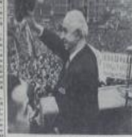
İsmet İnönü, İstanbul'da bu akşamki toplantıda konuşuyor.

37 dakika süren nutuk, partililerin coşkun tezahürleriyle karşılandı