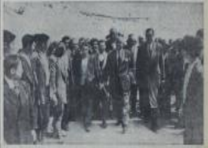
Celâl Bayar, İnegöl'de bu akşamki toplantıda.

"Biz kimseye, ama hiç kimseye, ne kadar kadret sahibi olursa olsun, cevap vermeğe mecbur değiliz."