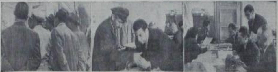
Atatürk Anıtının önünde basın toplantısı yapan D.P. liderleri, Türkiye İşçi Partisi'nin de katılımıyla bir araya geldiler.

14 Mayıs 1950 günü, Türkiye Cumhuriyeti'nin 16. yıldönümü olarak kutlanmaktadır. Bu gün, Türkiye Cumhuriyeti'nin kuruluşunun 16. yıldönümü olarak kutlanmaktadır. Bu gün, Türkiye Cumhuriyeti'nin kuruluşunun 16. yıldönümü olarak kutlanmaktadır.