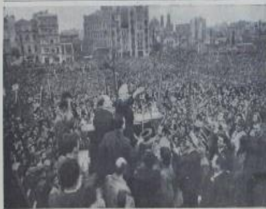
Yıldırım Beyazıt, İstanbul'da bu akşamki büyük toplantıya katılanlar.

D.P. nin bugünkü toplantısı Fatihte son toplantı yapılıyor İstanbul'da bugün akşam saatlerinde Fatih'teki Akademi Salonu'nda D.P. nin bugünkü toplantısı yapıldı. Toplantıya katılanlar, seçim kampanyasının sonuna gelmiş olduklarını belirttiler. Toplantıda konuşan Başkan Yıldırım Beyazıt, seçimlerin yaklaştığını ve partiye büyük bir başarı beklediğini söyledi.