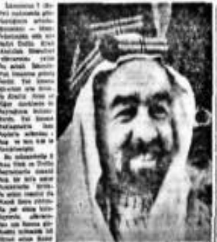
Ürdün Kralı Abdullah Hanedanı

Kral Abdullah Hazretleri İskenderunda törenle karşılandılar ve Cumhur Başkanının hususi trenle Ankara'ya hareket ettiler