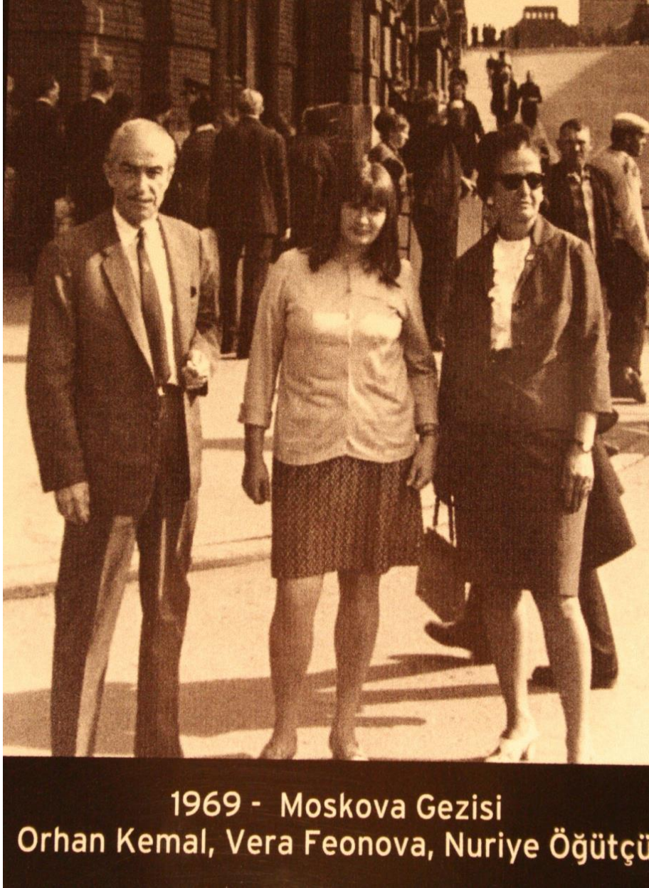
Resim 1.4. Orhan Kemal'in Moskova seyahati

Bu dönemler Orhan Kemal'in eserlerinin sahnelendiği, ödüller aldığı aynı zamanda ciddi rahatsızlıklar geçirdiği dönemlerdir. Bulgar Yazarlar Birliği'nin çağırısı üzerine gittiği Sofya'da rahatsızlanan Orhan Kemal, tedavi edilmekte olduğu hastanede 2 Haziran 1970'te vefat eder.