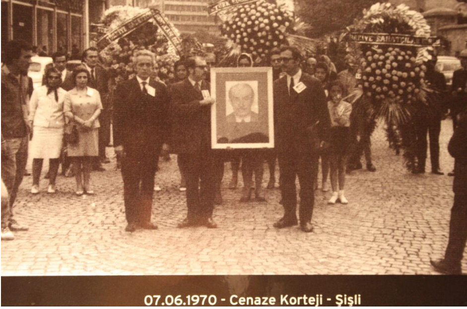
07.06.1970 - Cenaze Korteji - Şişli