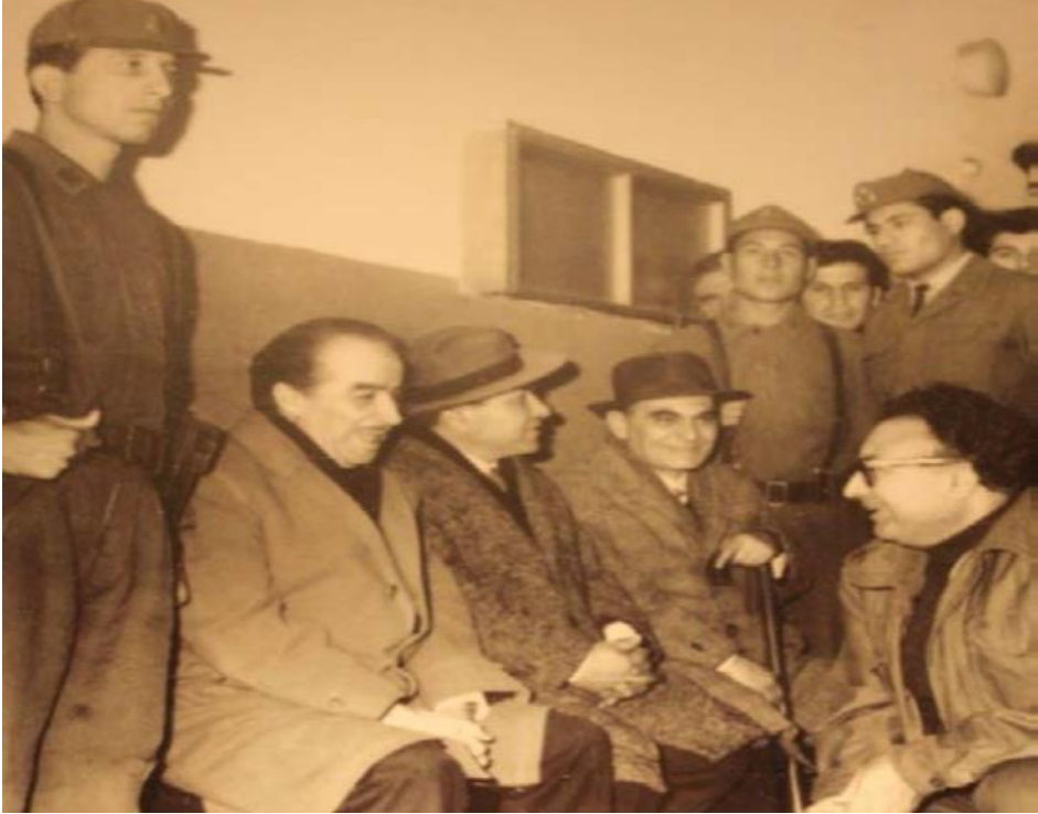
Resim 1.3. Orhan Kemal – Yaşar Kemal, mahkeme

Aslında bu yıllar, geçim sağlamaktan ziyade ciddi geçim sıkıntısının, yoksulluğun yaşandığı yıllardır. Kasım 1957’de dördüncü çocuğu Işık doğar. 7 Mart 1966’da bir ihbar üzerine iki arkadaşıyla birlikte tutuklanır. Hücre çalışması ve komünizm propagandası yaptıkları gerekçesiyle Sultanahmet Cezaevi’ne gönderilirler.