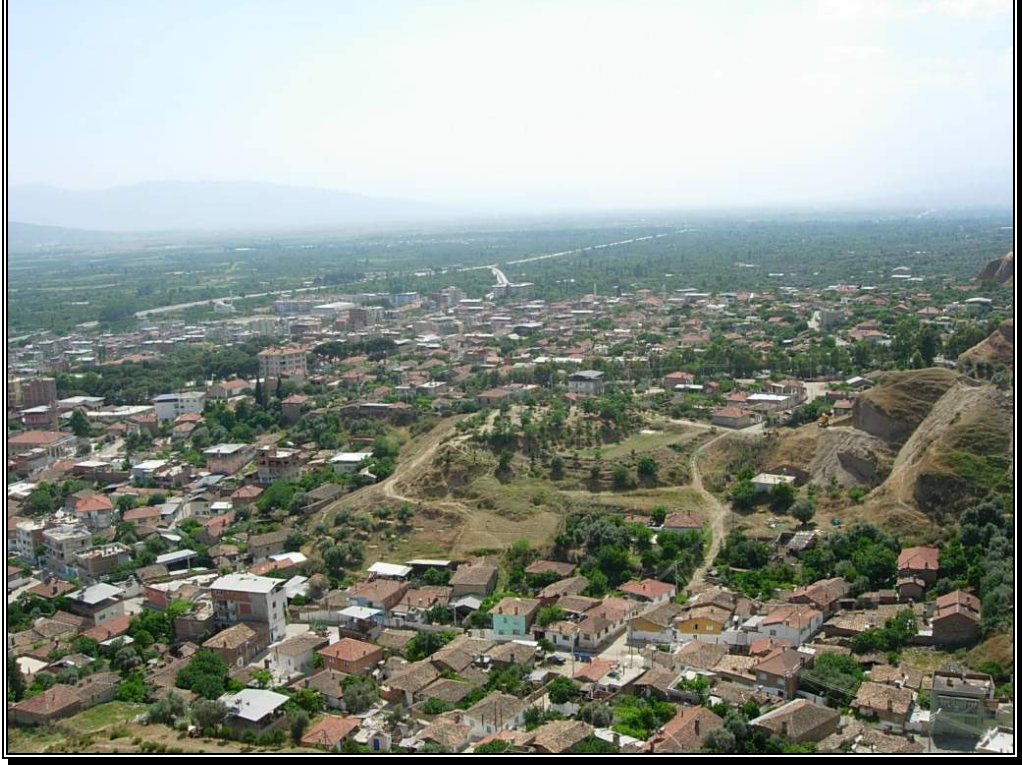
Resim 6: Kuyucak Genel Görünüm