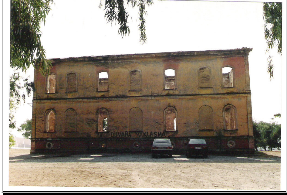
Resim 4: Tahir Paşa Konağı. Batı Cephesi