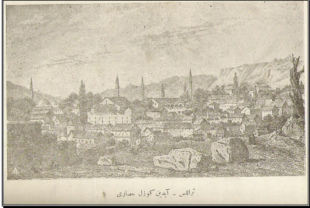
Resim 1: 1830'lu yılları Tralles – Aydın- Güzelhisarı'na ait bir gravür (C. Texier Küçük Asya İstanbul Matbaa-i Amire, s.110 1339)