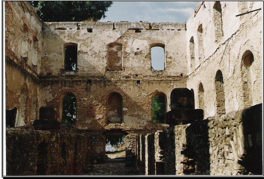
Resim 5: Tahir Paşa Konağı. İçten, Doğudan Batıya Bakış