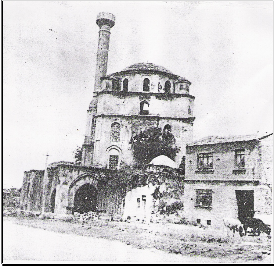
Resim 2: Cihanoğlu Cami (Onarımdan Önce, Türkiye’de Vakıf Abideler ve Eski Eserler Vakıflar Genel Müdürlüğü Yayınları, 1983)