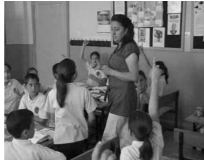
Şekil 2. Ders Giriş Etkinlikleri

İlk olarak öğrencilerin günlük hayatta çarpma işlemi gerektiren problemlerle karşılaştıkları hissettirildi ve bunula ilgili olarak çocuklarla karşılıklı konuşuldu. Derse geçişte matematiğin sadece soyut işlemler olmadığından, aynı zamanda günlük hayattaki sorunlara da çözüm üretmek için bizlere yollar gösterdiğinden bahsedildi. Bu anlamda Matematikte problem çözmenin çok önemli ve gerekli olduğundan söz edildi. Dersin sonunda günlük hayatta karşılaşılan ve çarpma işlemi gerektiren problemlere çözümler getirebilecek farklı stratejiler öğrenecekleri söylendi.