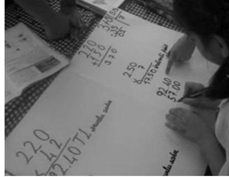
Şekil 7. Gruplar çözümlerini fon kartonlarına aktarıyor

Gruplar ortak karara vardıkları çözümlerini dağıtılan fon kartonlarına geçirdiler (Şekil 7).