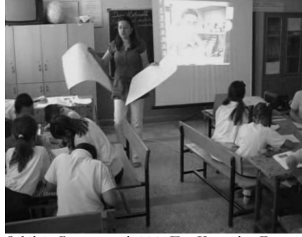
Şekil 4. Grup çözümleri için Fon Kartonları Dağıtım