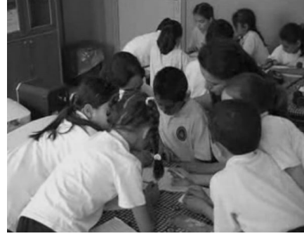
Şekil 5. Gruplar çözümlerini gerçekleştiriyor

Öğrenciler verilen 20 dakikalık zaman aralığında problemi çözmeye çalıştılar. Problemi farklı yollardan çözmeye uğraştılar. Bu sırada öğretmen rehber rolünde, öğrencilerin grup içi tartışmalarını dinledi, ilginç sorularla onları yönlendirdi ve farklı çözümler gerçekleştirmeleri için onları cesaretlendirdi ve başarılı işbirliği gerçekleştirdikleri için onları övdü (Şekil 6).