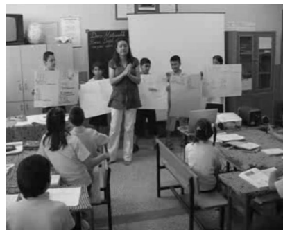
Şekil 9. Çözümlerini toplu değerlendirilmesi

Daha sonra tüm problem çözümleri tahtada sergilenip her birinin probleme nasıl yaklaştığı, hangi yolları kullandığı, yaptıkları yanlışların neler olduğu konusunda sınıfça tartışıldı ve özetlemeler yapıldı (Şekil 9). Sonucunda doğru çözüm üreten gruplardan birine çözümü tekrar anlatılarak öğrenme pekiştirildi.