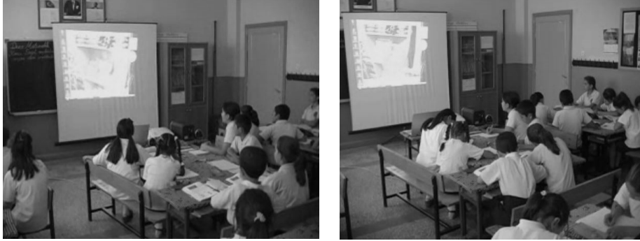
Şekil 3. Video Problemi İzleme Etkinlikleri - Notsuz ve Not alma

Günlük hayatta karşılaşılan matematik problemlerine benzer bir şekilde bir problemin video ile canlandırıldığı ve sınıfta bu problemi çözecekleri söylendi. Bununla ilgili olarak yönergeler verildi. İlk olarak videonun dikkatle izlenmesi gerektiği ve bu esnada başka bir şey yapmamaları hususunda öğrenciler uyarıldı. İkinci izlemede notlar alabilecekleri hatırlatıldı.