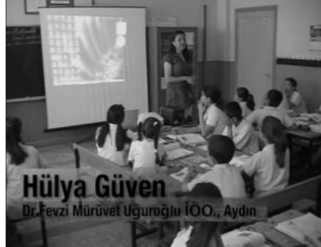
Şekil 1. Sınıf Düzeni

şekildeki oturma düzeni ülkemizde çoğu sınıf ortamlarında kolaylıkla düzenlenebilecek bir ortam olup oldukça olumlu etkilerinin olduğu birçok araştırma ile kanıtlanmıştır.