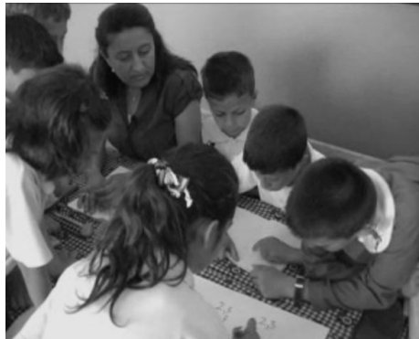
Şekil 6. Öğretmen Grup tartışmalarına rehberlik ediyor

Öğrenciler verilen 20 dakikalık zaman aralığında problemi çözmeye çalıştılar. Problemi farklı yollardan çözmeye uğraştılar. Bu sırada öğretmen rehber rolünde, öğrencilerin grup içi tartışmalarını dinledi, ilginç sorularla onları yönlendirdi ve farklı çözümler gerçekleştirmeleri için onları cesaretlendirdi ve başarılı işbirliği gerçekleştirdikleri için onları övdü (Şekil 6).