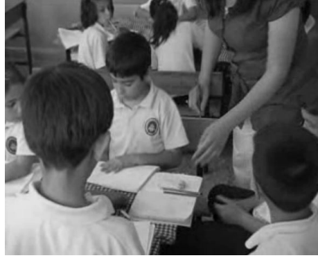
Şekil 10. Ek değerlendirme etkinlikleri

Problem çözümünde aksaklık gözüken ve öğrencilerin genelde çözümde unuttukları indirimin hesaba katılması ayrıca bir problem durumu olarak ele alınıp bununla ilgili ek uygulamalar yapıldı. Sonuçlar tek tek kontrol edildi (Şekil 10).