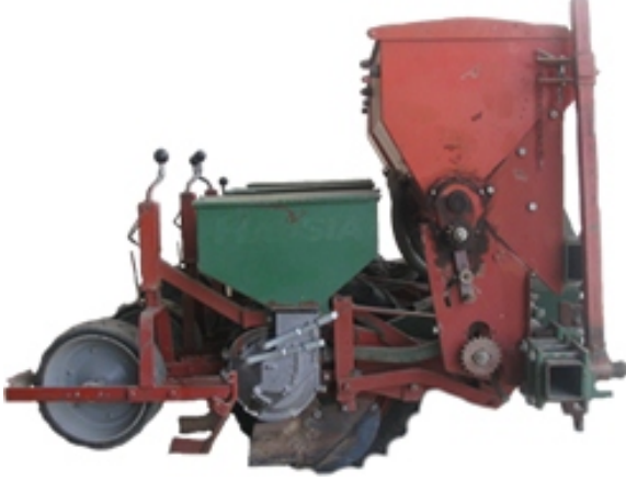
Şekil 1. Pnömatik ekim makinası

Denemede kullanılan pnömatik ekim makinası, traktöre üç nokta askı sistemi ile bağlanan, hareketini tekerlekten alan, gübre atma düzeneğine ve 4 ekici üniteye sahip, vakum prensibine göre çalışan bir makina olup, makinanın genel görünüşü Şekil 1'de, bazı teknik özellikleri ise Çizelge 2'de verilmiştir.