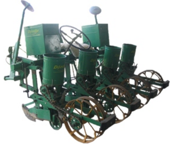
Şekil 2. Mekanik ekim makinası

Bu çalışmada laboratuvar koşullarında yürütülmüş olup, kullanılan mekanik ekim makinası bant düzeneğinin teknik özellikleri Şekil 3'te görülmektedir.