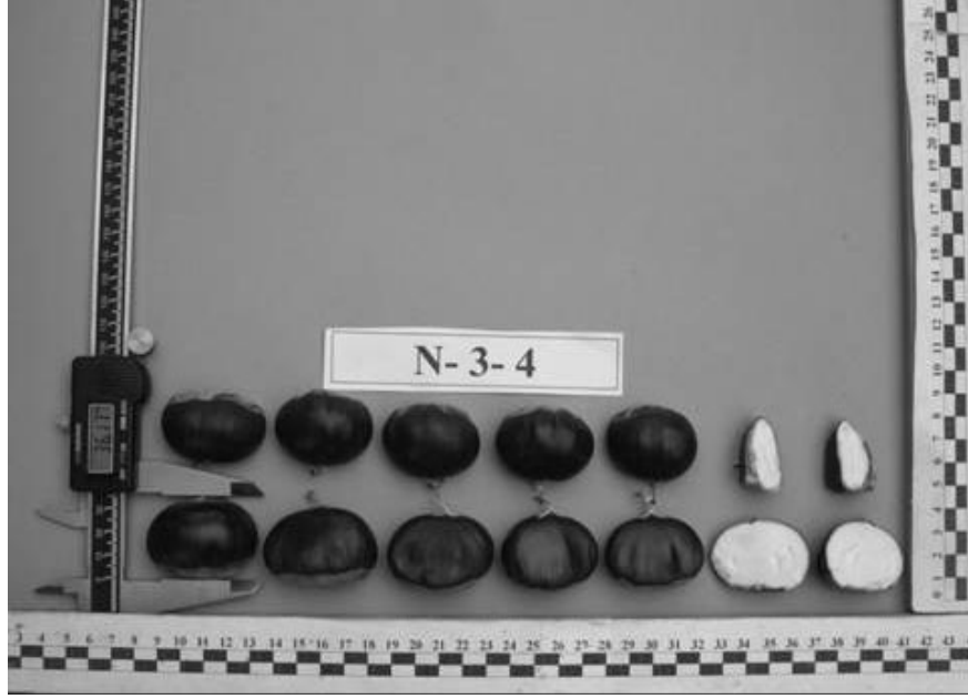
Şekil 1. N-3-4 genotipinin meyvelerinin genel görünümü.