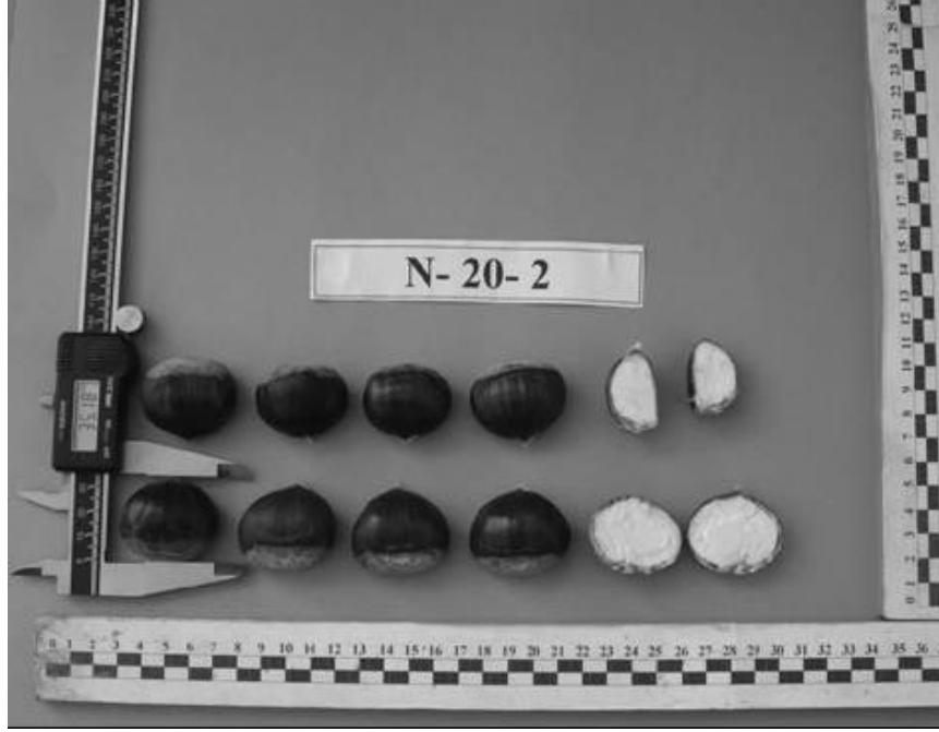
Şekil 2. N-20-2 genotipinin meyvelerinin genel görünümü.