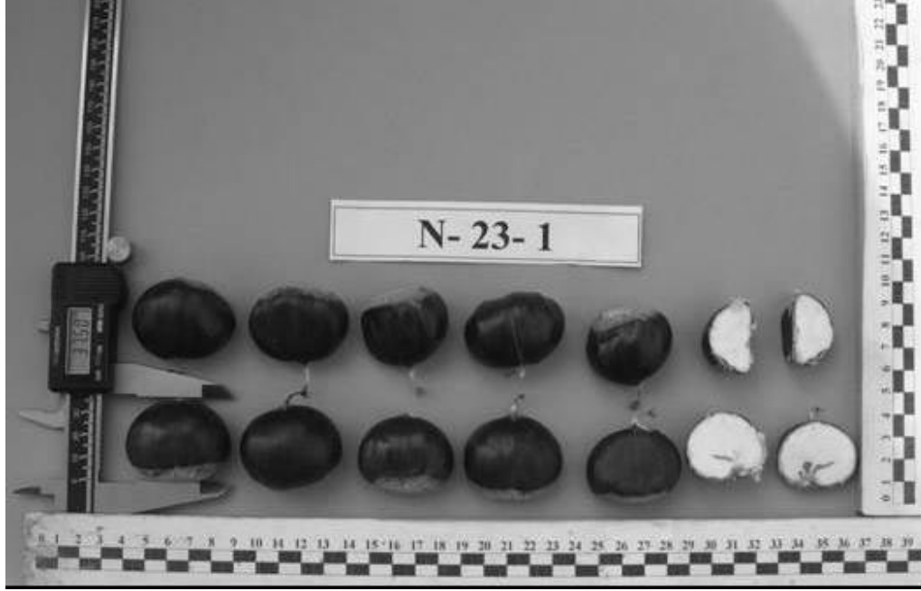
Şekil 3. N-23-1 genotipinin meyvelerinin genel görünümü.