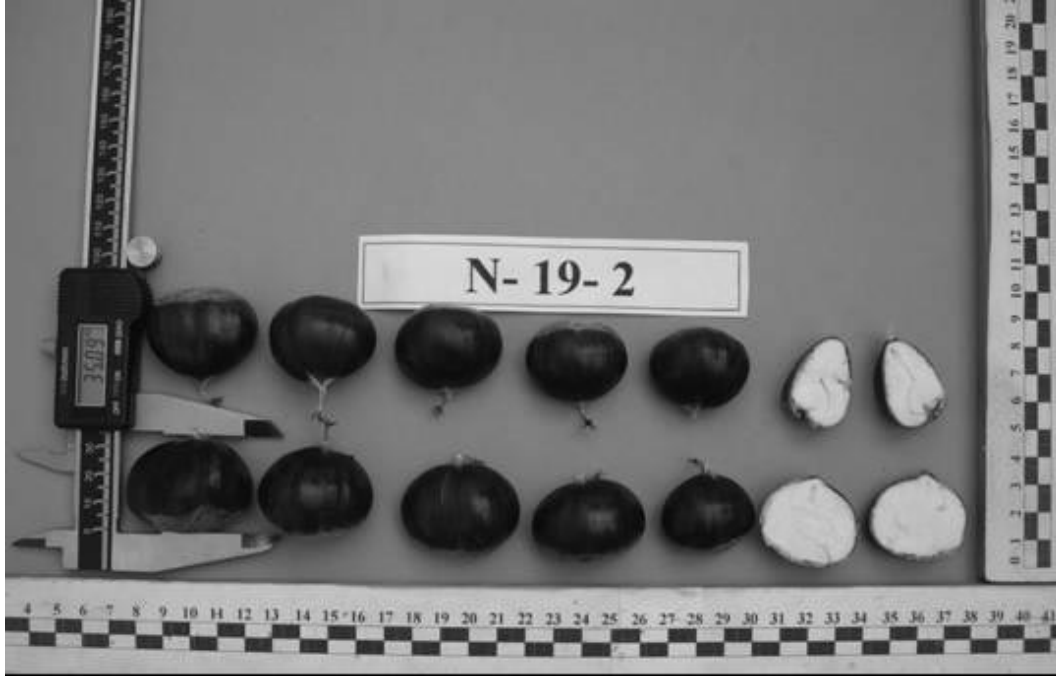
Şekil 4. N-19-2 genotipinin meyvelerinin genel görünümü.