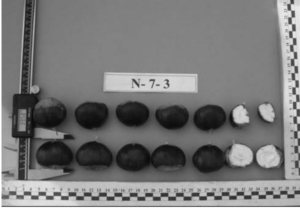
Şekil 6. N-7-3 genotipinin meyvelerinin genel görünümü.