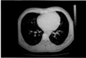
Resim 3-4. Yüksek rezolüsyonlu akciğer tomografik görünümleri