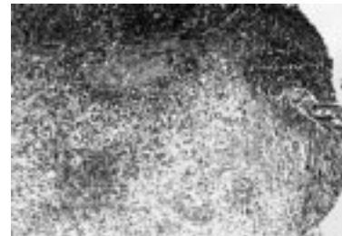
Resim 1. Patolojik görünüm

radıyoterapi uygulanmıştı (Resim 1). Bir yıldır ortaya çıkan başağrısı nedeniyle polikliniğimize başvurdu. Hasta 12 yıldır günde bir paket sigara içiyordu. Fizik muayenesinde lokal olarak frontal bölgede duyarlılık dışında patoloji yoktu. Rutin hemogram, eritrosit sedimantasyon hızı, periferik yayma, immunglobulin düzeyleri, tiroit fonksiyonları, parat hormon düzeyi, kemik iliği aspirasyonu ve biopsisi, akciğer grafisi, batın ultrasonografisi, elektrokardiografi normal sınırlarda idi. Kraniyografide frontal bölgede 6x8 cm çapında osteolitik lezyon saptandı (Resim 2). Bronkoskopi, transbronşial biopsi, solunum fonksiyon testleri normaldi. Yüksek rezolüsyonlu akciğer tomografisi bilateral yaygın ince retiküler dansite artışı, alt loblarda yamalı aerasyon artımı intertisyel akciğer tutulumu olarak yorumlandı (Resim 3 ve 4). Lomber vertebraların kemik dansitometresinde osteopeni vardı (t=-1,2 ve z=-1,2). Göz ve KBB muayeneleri sonucunda patolojik bulgu saptanmadı.