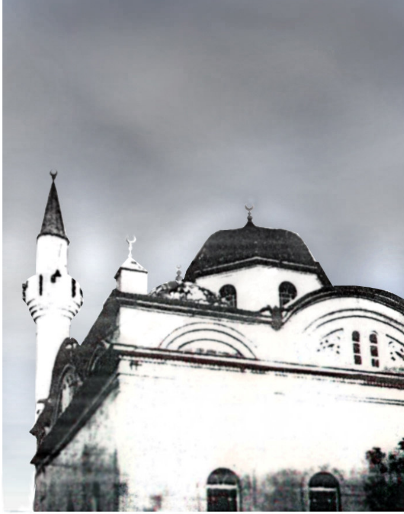
Resim II : Hacı Ahmet Camii ( Yücel Aras )