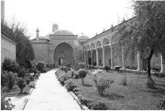
Resim 3. Bayezid Külliyesi