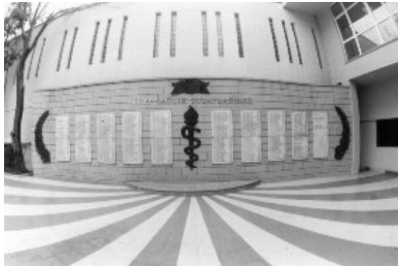
Resim 4. GATA Tıp Tarihi Müzesi, Şehit Sağlık Subayları Anıtı

Bursa, Sağlık Müzesi, Ali Osman Sönmez Onkoloji Hastanesi bünyesinde 2006 yılında ziyarete açılmıştır. Muradiye Medresesi'nde bulunan Döner Ocak Kanseri Erken Tanı ve Araştırma Merkezinin içinde yer aldığı tarihi binada tıbbi aletleri ve malzemeleri sergileyerek hizmet vermektedir. Edirne'deki Sağlık Müzesinin ardından ülkemizin ikinci sağlık müzesidir 9 .