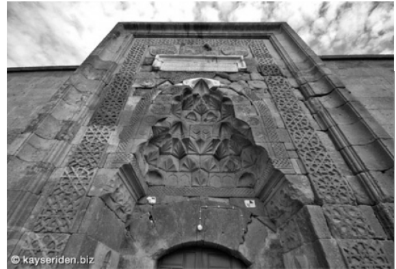
Resim 2. Gevher Nesibe Şifahanesi

Edirne'de Tunca Nehri kıyısındaki II. Bayezid tarafından inşa ettirilen ve temel amacı Edirne'yi bir hastaneye (darüşşifa) kavuşturmak olan külliye'nin (Resim 3), cami dışındaki diğer birimleri 1984 yılında Vakıflar Genel Müdürlüğü tarafından Trakya Üniversitesine devredilmiş ve darüşşifa bölümü üniversitece düzenlenerek Kültür ve Turizm Bakanlığı ile Ruh Hastaları Redaptasyon Derneğinin de