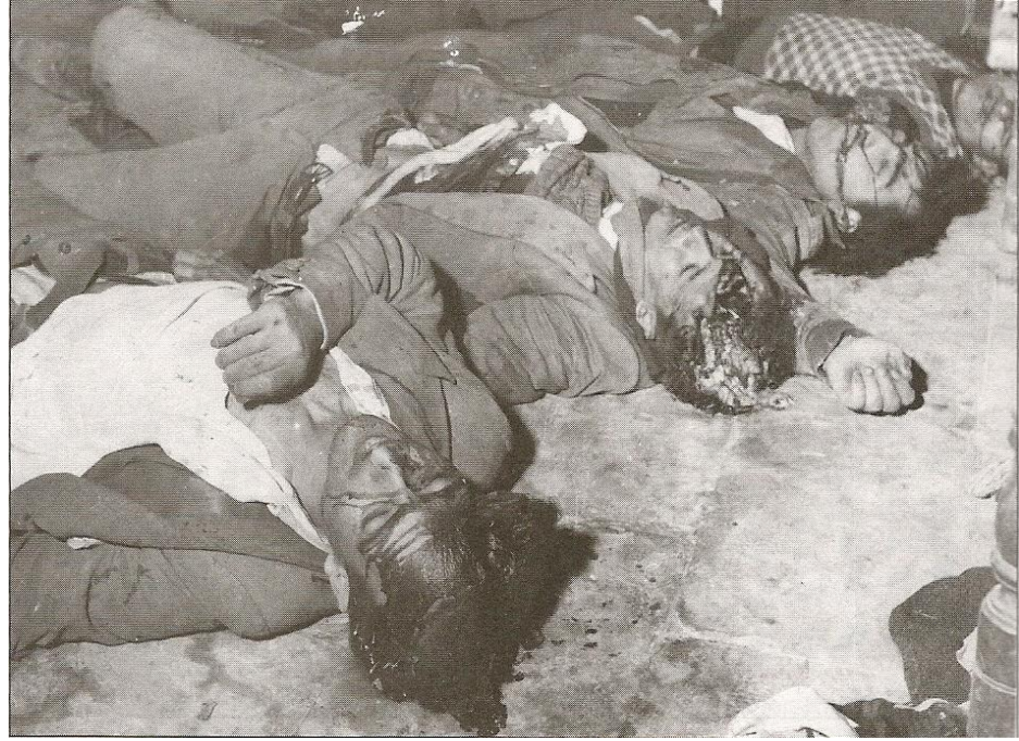
Ek 6. Baf direnişisi sırasında mermileri bittiği için düşmana esir düşen Türk Mücahitler Rum askerleri tarafından nacaklarla parçalanarak öldürülmüştür.