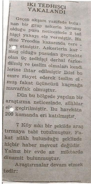
Ek 12. Halkın Sesi Gazetesi (27.03.1956)