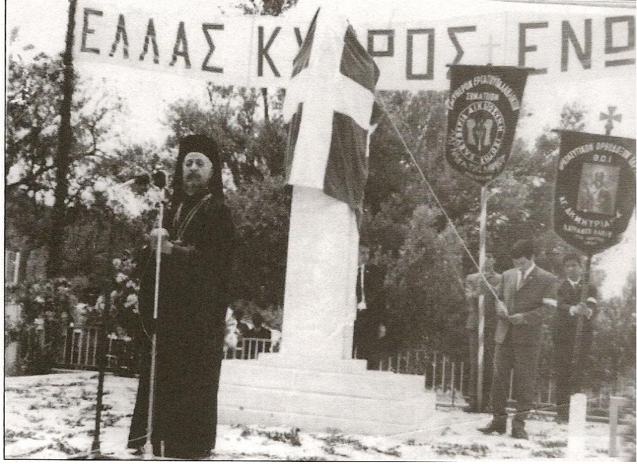
Ek 1. Kıbrıs Cumhuriyeti Cumhurbaşkanı Makarios'un Enosis konuşması. Arkadaki pankart da ' Yunanistan-Kıbrıs-Enosis' yazmaktadır (1960-1963).