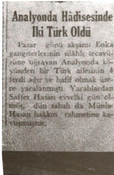
Ek 8. Bozkurt Gazetesi (24.07.1958)