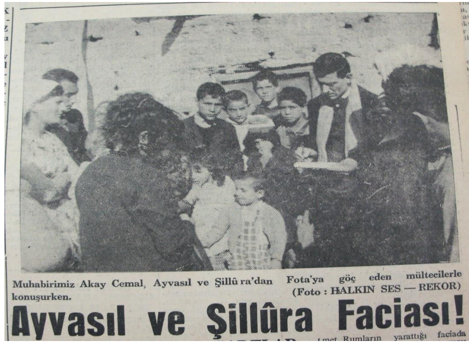
Ek 15. Halkın Sesi Gazetesi (12 Ocak 1964)