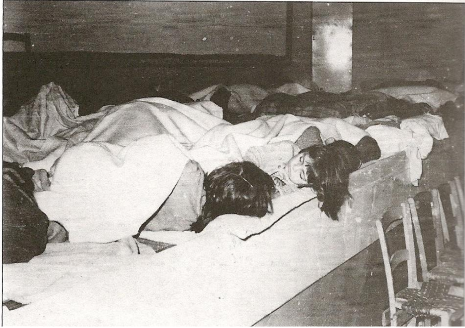
Ek 7. Evlerinden çıkarılan Kıbrıslı Türkler sinema salonlarında barındırılmıştır. (Lefkoşa, 1963-1964)