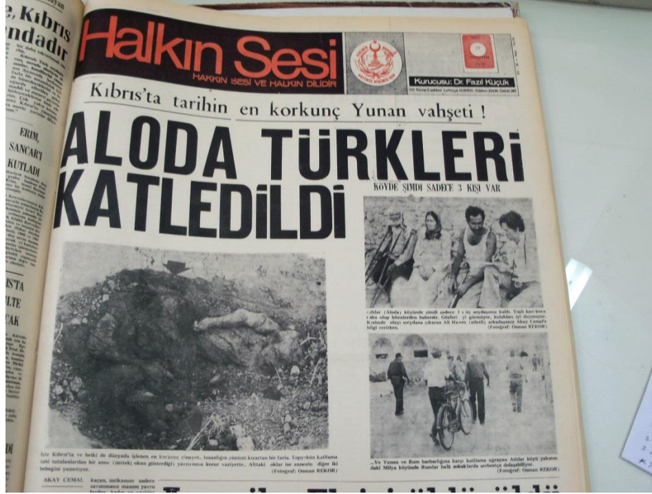
Ek 18. Aloda Türklerine karşı yapılan mezalim haberi (Halkın Sesi Gazetesi 20.08.1974)