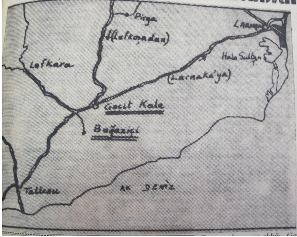
Ek 16. Geçitkale ve Boğaziçi bölgelerini gösteren harita (Halkın Sesi Gazetesi 16.11.1967)