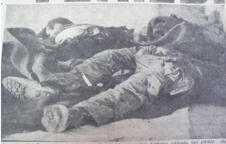
Ek 17. Geçitkale katliamında ortadan ikiye bölünmüş şehidimiz