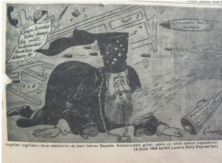
Ek 13. Londra Daily Express (3 Ocak 1964), Halkın Sesi Gazetesi