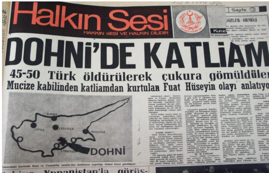
Ek 21. Dohni Katliamı (Halkın Sesi Gazetesi 23.08.1974)