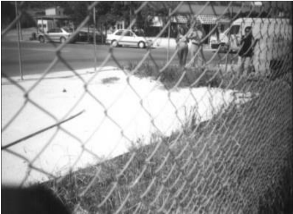
Ek 19. Alaminyo Çukuru