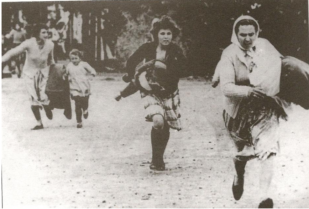
Ek 2. Rum-Yunan vahşetinden Kıbrıslı Türklerin kaçıışı