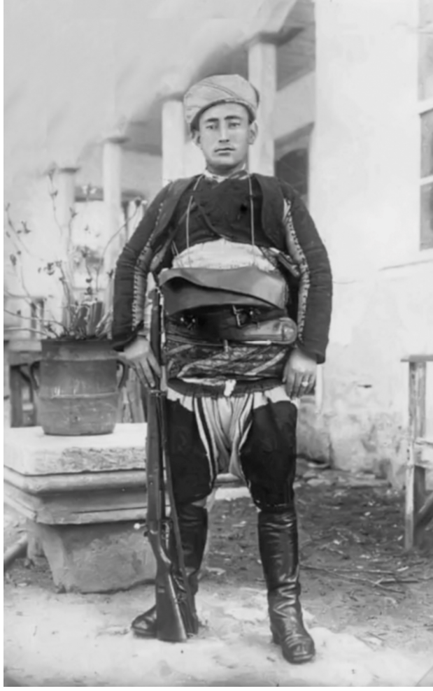
Milli Mücadele Kahramanı Yörük Ali Efe