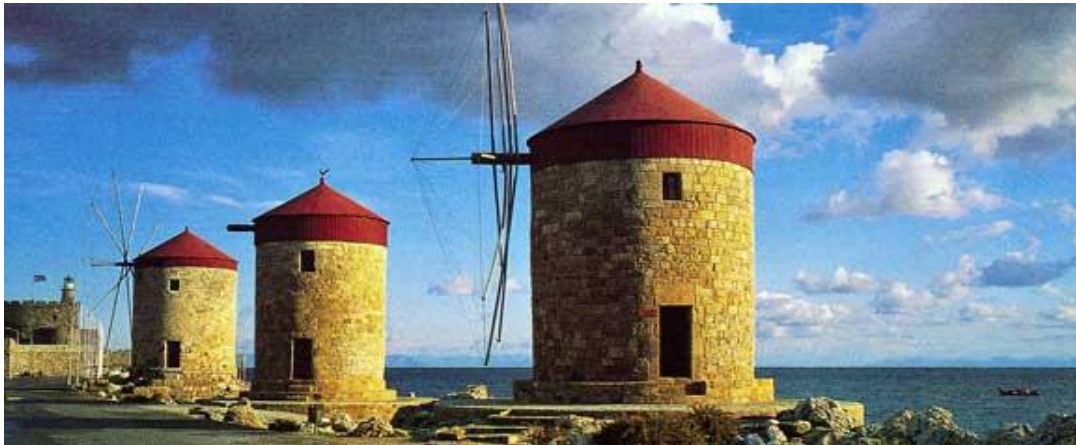
Resim 4.3: Limandaki Değirmenler

Şövalyeler döneminde aktif durumda ve kereste temini için Anadolu'ya bağımlı olan Rodos tersanesi asıl canlılığı Osmanlı döneminde yaşadı. Özellikle Akdeniz ve Karadeniz'de savaş halindeyken Rodos tersanesi hareketleniyordu. 249