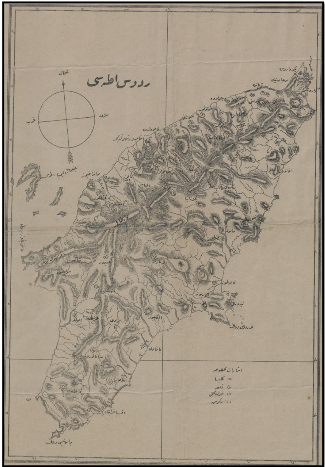
EK 1: BOA, HRT, Nu. 269