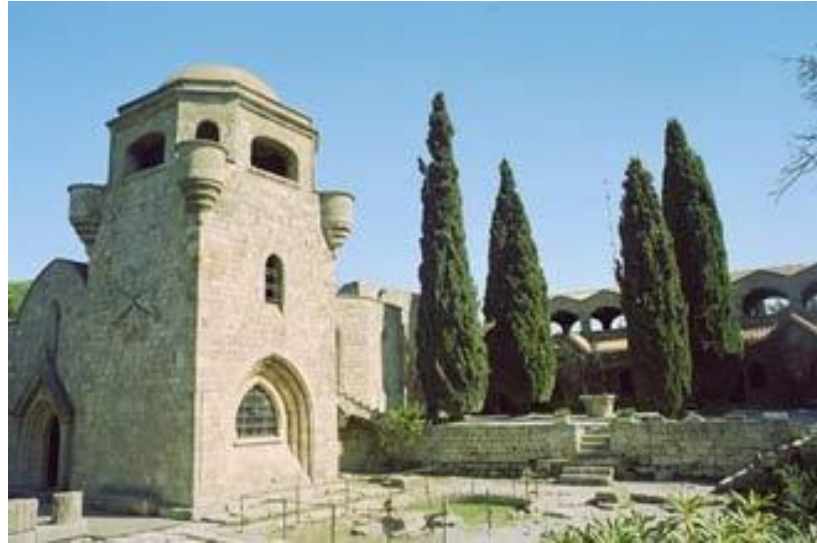
Resim 4.5: Filerimos Manastırı

Philermos Dağı'nda bulunan Meryem Ana tapınağı sıklıkla ziyaret edilen bir hac yeri olarak bulunmaktaydı. Philermos denilen yerdeki Eski Rodos'a, Rumlar Rhodini, Türkler Sünbüllü demişlerdir. 253