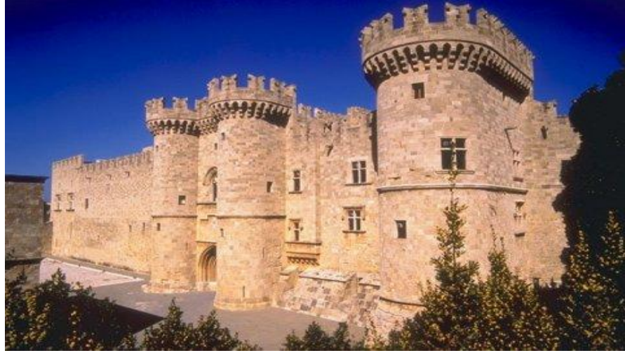
Resim 2.2: Şövalyeler Sarayı