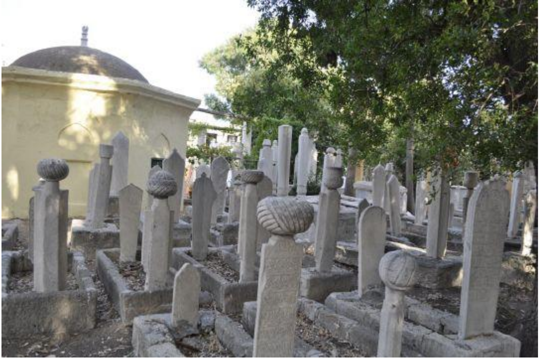
Resim 4.1: Murat Reis Mezarlığı