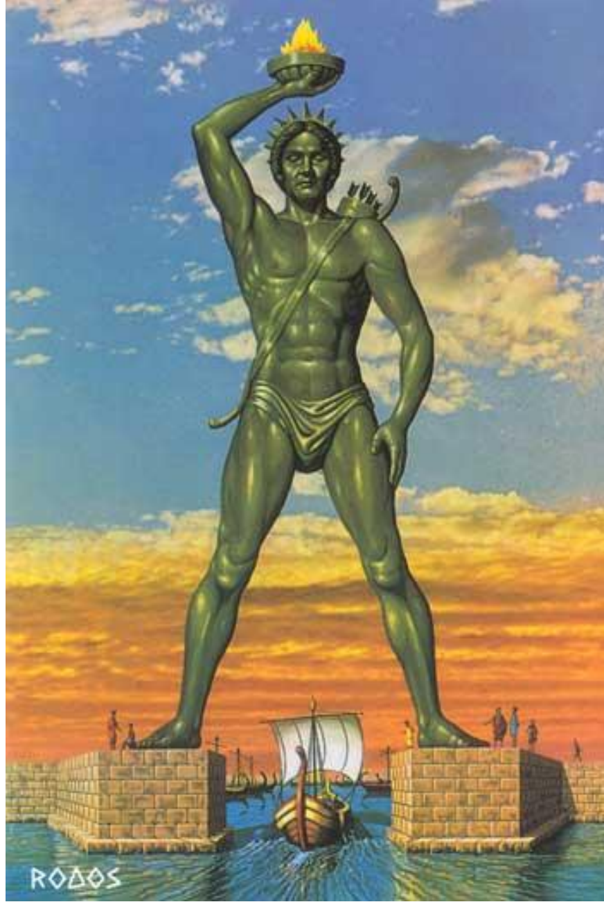
Resim 1.1: Rodos Heykeli

çıkarmada görülmüş, Marmaris sahiline nakledilmiştir; 900 deve yükü tunç elde edilerek Humuslu bir Mûsevî tacirine satılmıştır. Heykel'in parçalarının nerede olduğu artık bilinmemektedir. Bazı parçaların Büyük Üstad'ın Sarayı'nda olduğu söylenir. 9