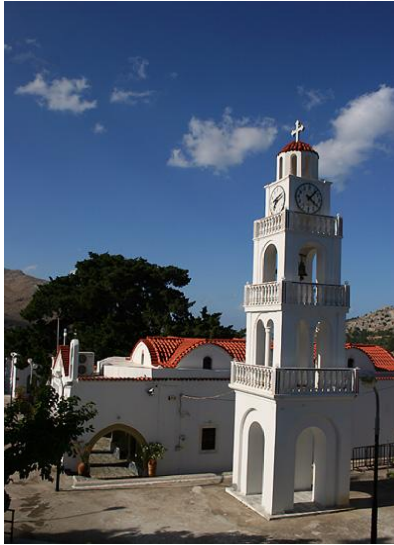
Resim 4.6: Tsambika Manastırı

Lindos'ta XVIII. yüzyıl freskleriyle dekore edilmiş olan Panagia Kilisesi, Dimliye yakınında Fountoukli bölgesindeki eski bir yapı olan Agios Nicholaos Kilisesi, Alayarma yakınında yine eski bir yapı olan Moni Thari Manastırı vardır. Rodos'ta başka birçok kilise ve manastır bulunmaktadır. Arhangelos'a yakın bir yerde XVIII. yüzyılda bir keşiş tarafından yeniden inşa edilmiş olan Tsambika Manastırı da bunlardan biridir. 254