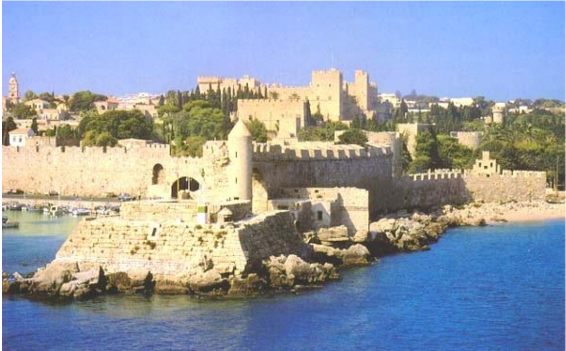
Resim 4.2: Rodos Kalesi

kalemünde 3 kişiye 45 akçeden 354 günlük ücret ödendiği belirtilmiş olup 45 ile 354 çarpılarak 15.930 akçeye ulaşılmıştır. 3.984 akçe tutan ekmek parası çıkartılınca 11.946 akçe kalmıştır. 1 yılı daha ekleyince 23.892 akçelik bir harcama yapılmıştır. Kefe kalemünde 3 kişiye 49 akçeden 354 günlük toplam 17.346 akçelik bir ödeme çıkmıştır. 4.336 akçe tutan ekmek parası çıkartılınca 13.010 akçe kalmıştır. 1136 yılından da ekleyince 26.020 akçeye ulaşılmıştır. Teslimat 2.350.088'dir. Kâtiplerin aldığı 23.892 ile 26.020 akçenin toplanmasıyla elde edilen 49.912 eklenince 2.400.000'e ulaşılmaktadır. Harcamaların askeri harcamalar olduğu görülmektedir. 246