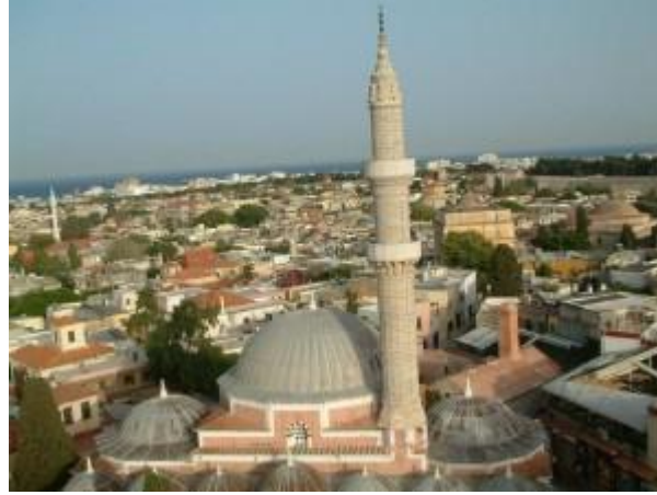
Resim 4.8: Süleymaniye Câmii

edilmiş olan Lindos Çeşmesi, 1756 yılı yapımı Konak Çeşmesi ile yapım tarihi bilinmeyen Osmanlı ve Tersane çeşmeleri verilebilir. 276