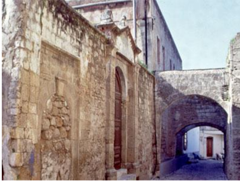
Resim 4.7: Kahal Kadosh Shalom Sinagogu