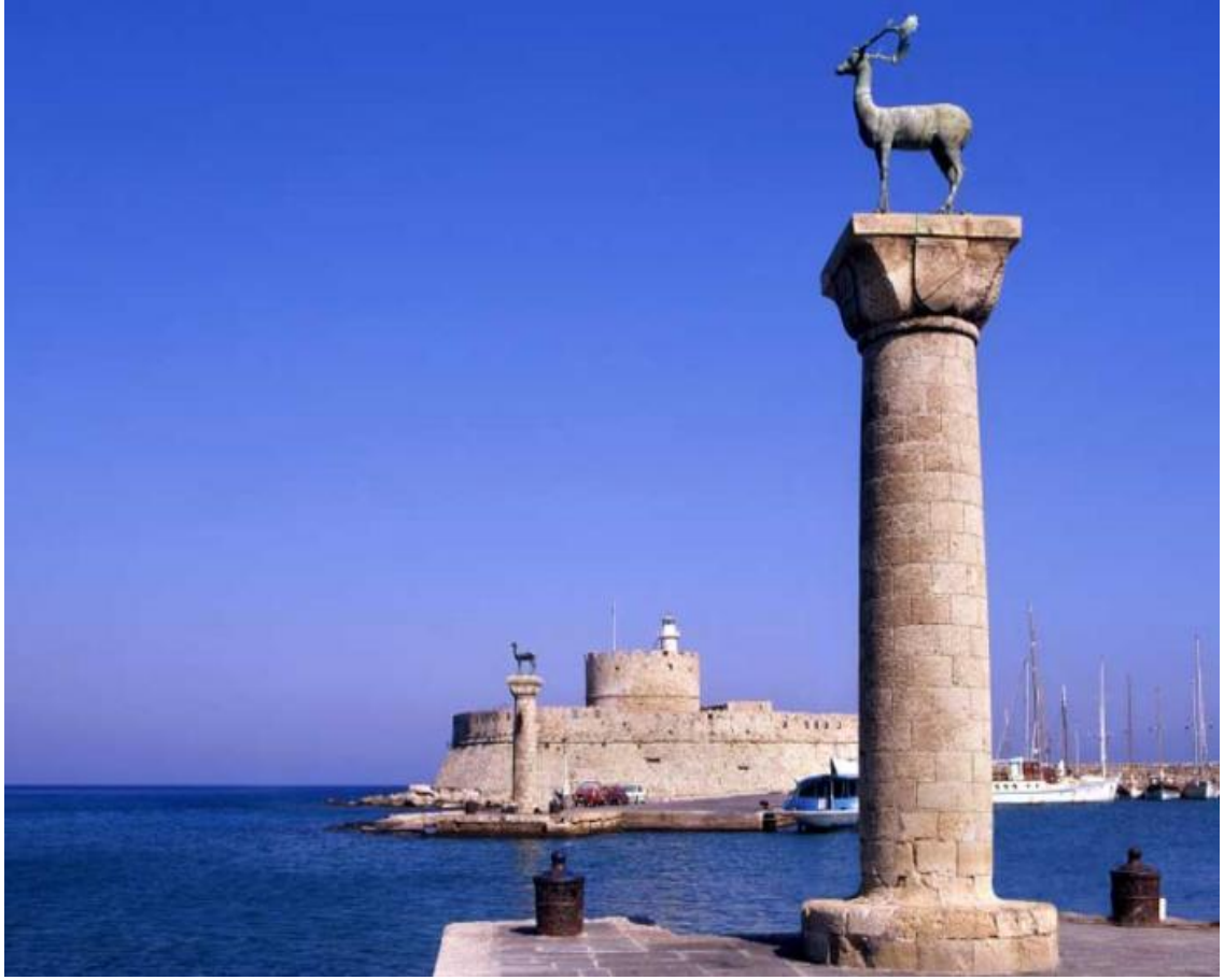
Resim 4.4: Mandraki Limanı