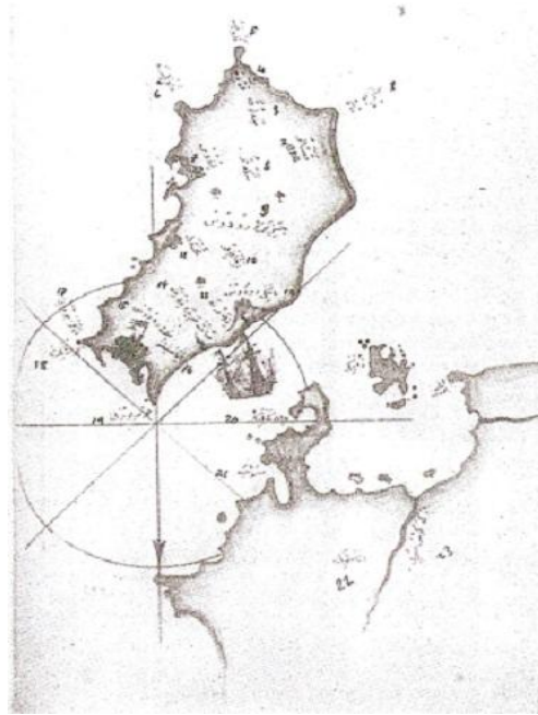
Resim 1.2: Piri Reis'ten Rodos

Anadolu'ya hükmeden, burayla alakası olan her devlet, Rodos ile de ilgilenmek zorundadır. Ada, Anadolu'yu Yunanistan'a, Suriye'ye ve Mısır'a bağlayan yollar üzerinde olarak uğranılması zorunlu bir istasyon gibidir. Doğudan batıya giden büyük ticaret yollarının üzerinde yer alan ada, Akdeniz ticaretinin en önemli merkezlerindendi. Roma İmparatorluğu hâkimiyetinde uzun süre kalmış olan adaya, Araplar, Venedikliler ve Cenevizliler, Bizanslılar ile daha sonra Kudüs'ten kovulmuş olan Hospitalier şövalyeleri tarafından hükmedildi. 15