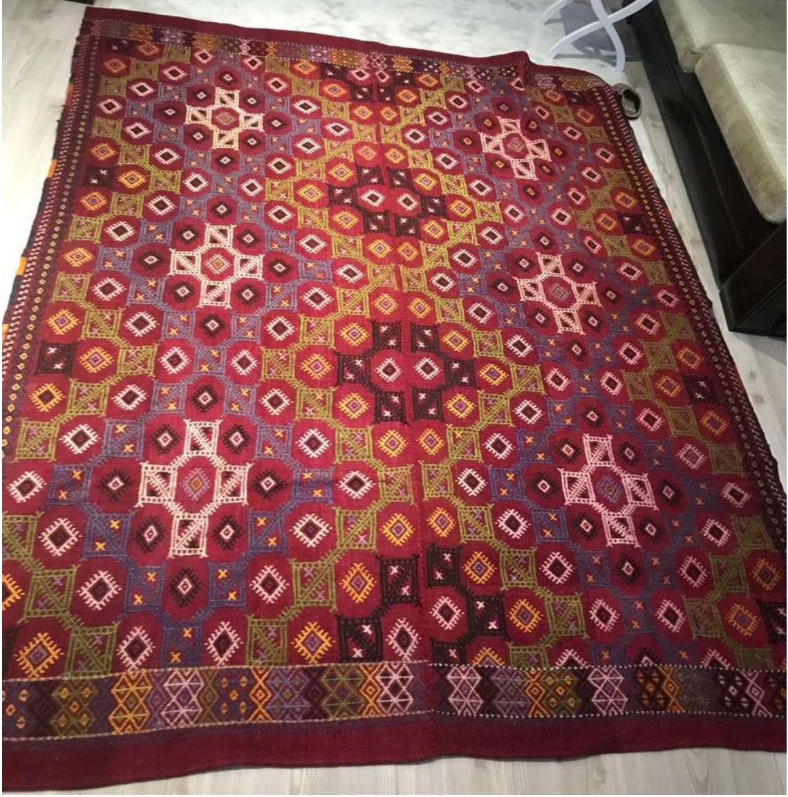
Görsel 5.8 : Dokuma Kilim 2