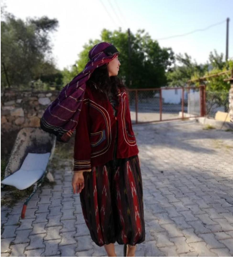
Görsel 5.2. Yörük Gelinliği

Düğünün son günü olan gelin alma ise gelin alayı olarak anılmaktadır. Bu kızın göçü olarak da anılmaktadır. 286 Gelin almada özel gelin havaları bulunmaktadır. Bunlardan günümüze kadar gelen bir kısmı “ al devesi mor köşekli/ emmim kızı gül döşekli ” gibi ezgiler gelin almada söylenmektedir. Gelin almada gelin, gelin elbisesini giyer saç yapıldı. Bu olaydan sonra gelin deveye ya da ata bindirilerek oğlan evine doğru yola çıkarlardı. Bundan sonraki adım ise gelinin attan ya da deveden indirilmesidir. Gelin indirildiğinde başında saç saçılırdı. Bu saç buğday, darı, şeker, çerez, para olarak saçılmaktadır. Bugün Anadolu’da kullanılan “ darısı başına ” deyimini bu adetten ileri gelmiş olduğudur. Bahaeddin Ögel, saç saçmanın İslamiyet öncesi bir gelenek olduğunu bu inancın Şamanizme dayandırıldığını ifade etmiştir. Anadolu’da saç saçmanın yanında dualar edilmesi de görülmektedir. Yine kurban kesme, gelinin eşiğe basmaması önemli saç adetleri olarak görülmektedir. 287