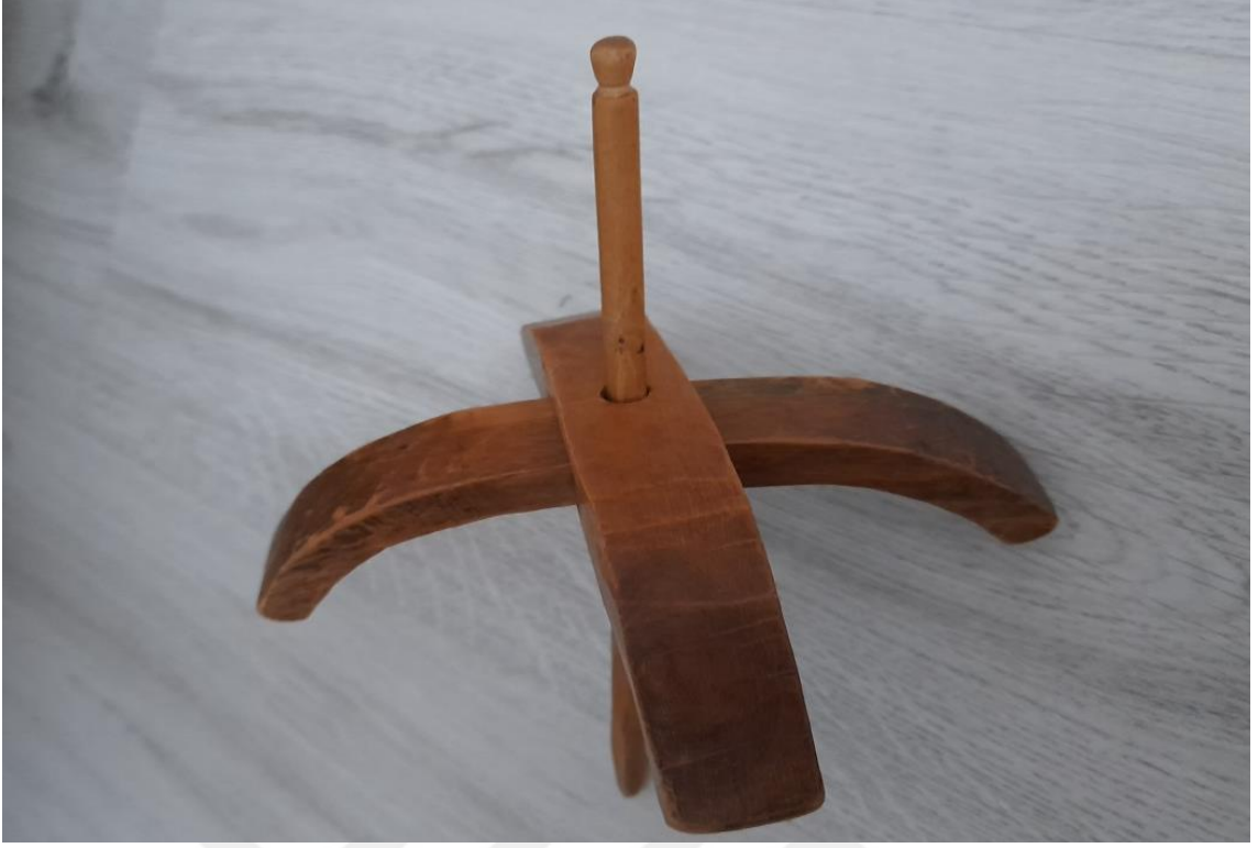
Görsel 5.9. Kirmen