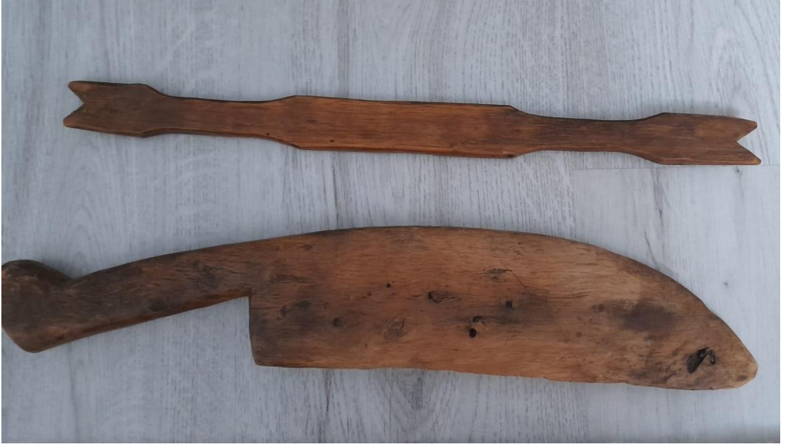
Görsel 5.10. Şimşir