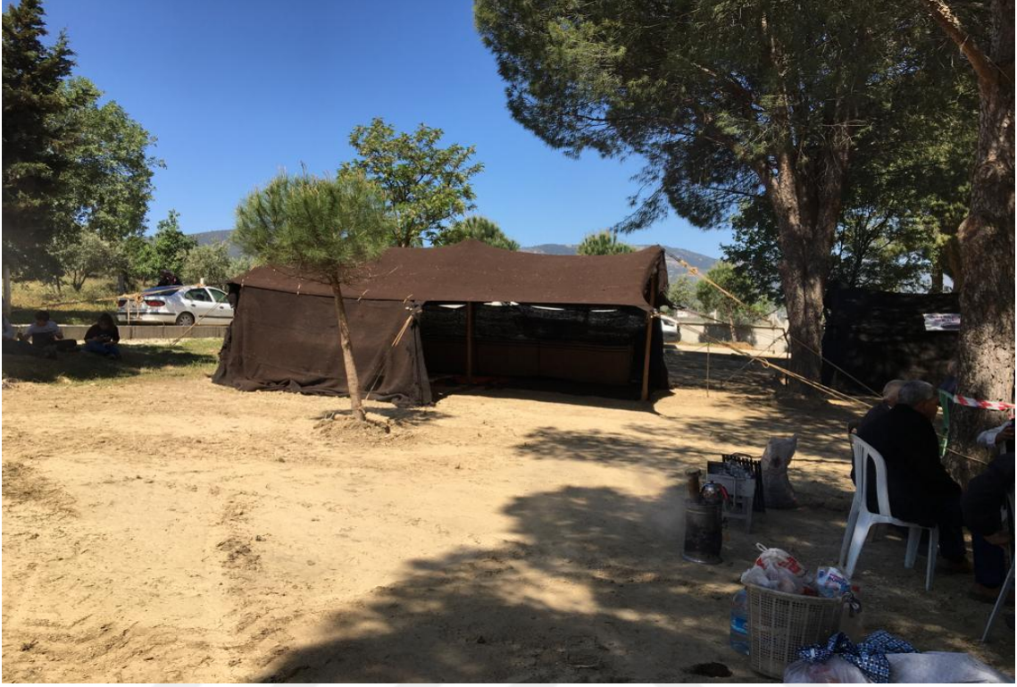
Görsel 5.1. Kara Kıl Çadırı

konakladığını ve sıcak günler geçinceye kadar burada kaldığını yazdığı seyahatnameden haber almaktayız.