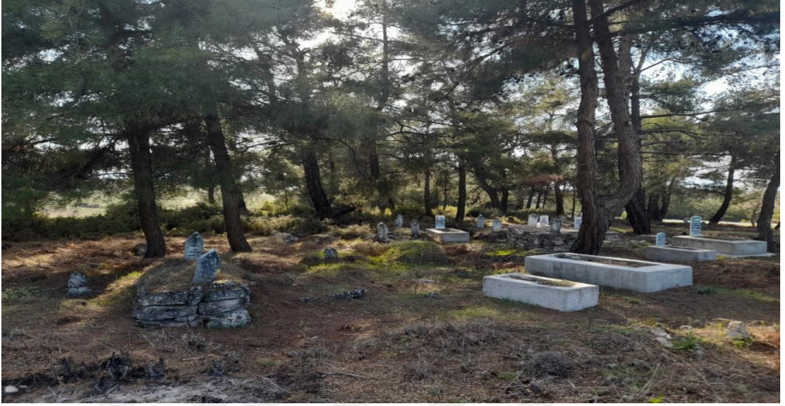
Görsel 5.4. Göç Yolu Üzerinde Mezarlık Denizli/ Güney

makbul sayılmaktadır. Çünkü bir nevi ölen kişinin evini ziyaret ediyor ve şeker de ölen kişinin ikramı olarak yorumlanmaktadır.