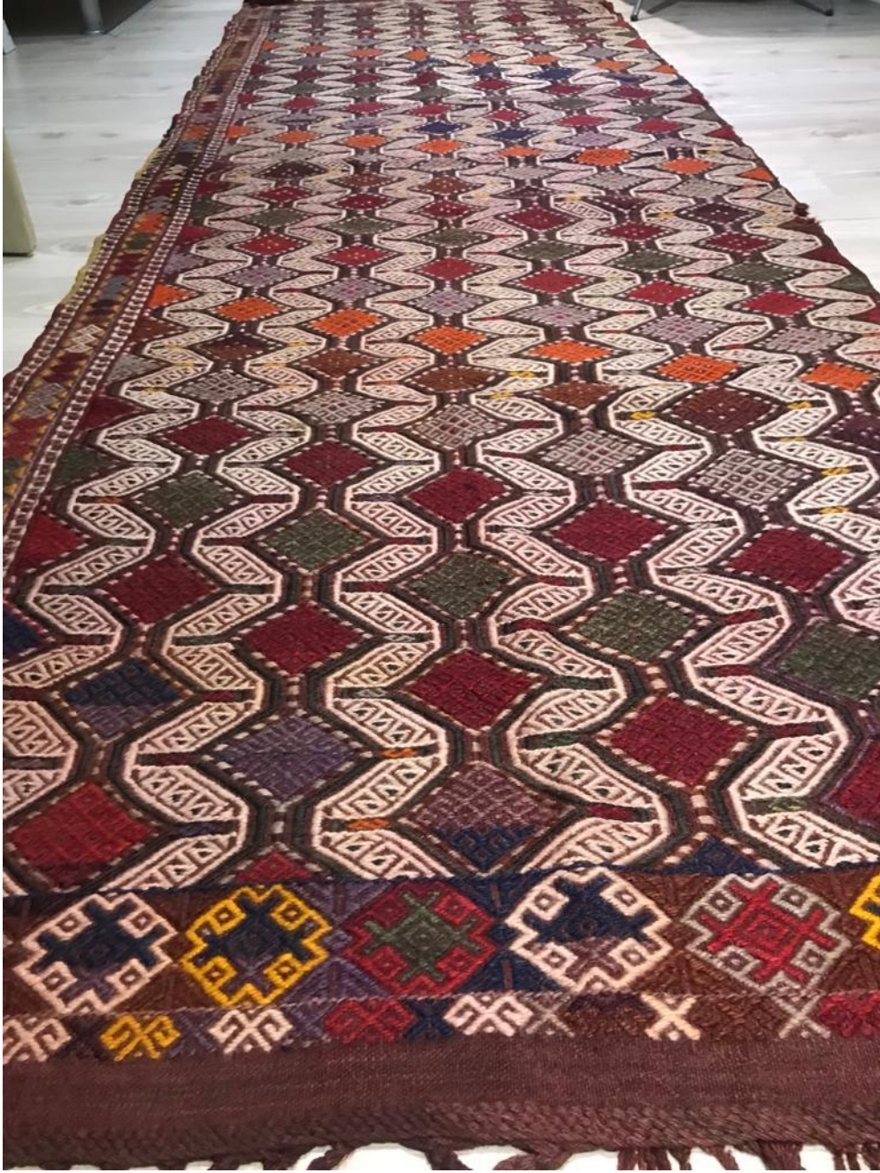
Görsel 5.7. Dokuma Kilim