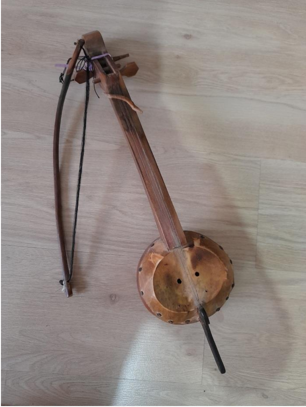
Görsel 5.6. Yörük Çalgısı Kabak Kemane

“Yayladan gelirim yüküm üzümdür Şu yaylanın kızları düzüm düzümdür Bir komşu kızı var benim iki gözümdür Yayladan gelirim yüküm eriktir Şu yaylanın kızları güllük güllüktür Benim yârim içlerinde ceylan geyiktir.”