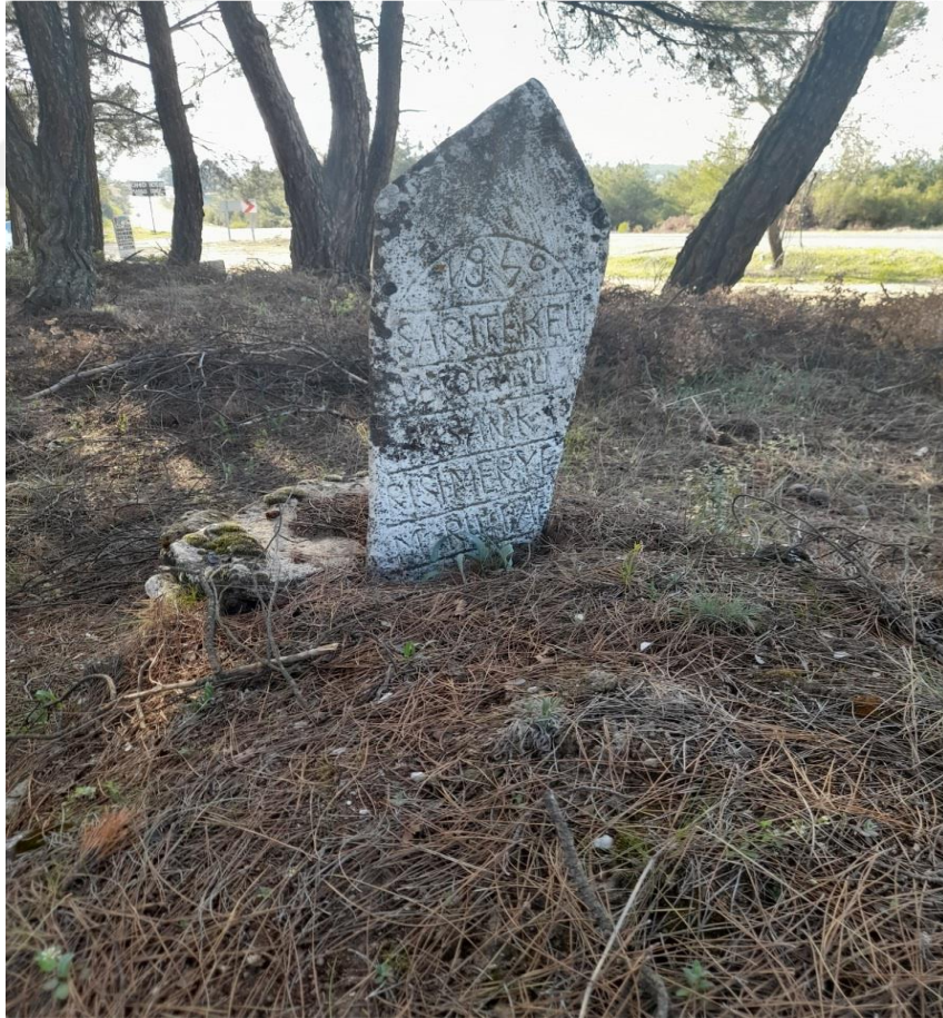
Görsel 5.5. Göç Yolu Üzerinde Sarıkeçili Mezarı Denizli/ Güney