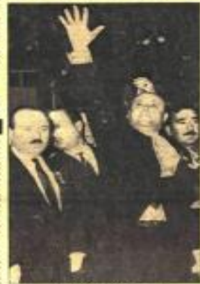
Demirel'in konuşması sırasında.