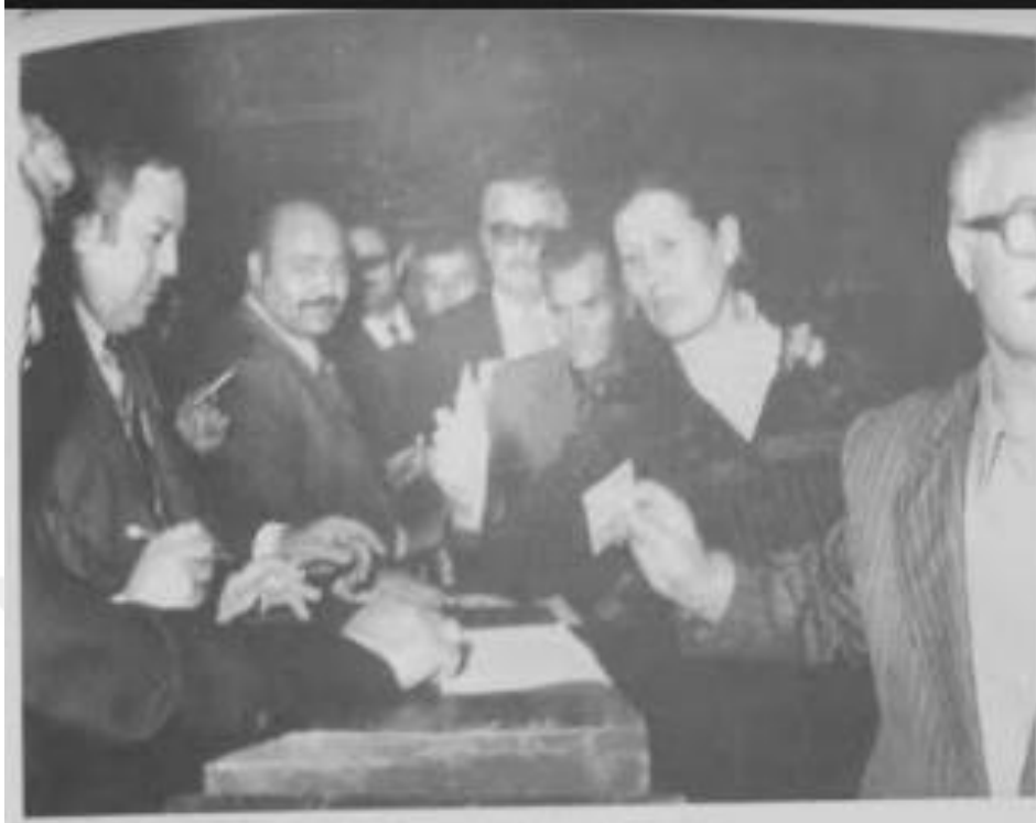
İlçe kongrelerinde oy kullanırken