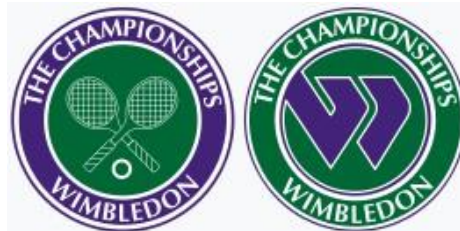
Şekil 1. 3. Wimbledon Tenis Turnuvası sembolü

Halen doğal çimde oynanan tek turnuva olan Wimbledon Tenis Turnuvası, her yıl Haziran ve Temmuz aylarında yapılmaktadır. İlk Wimbledon şampiyonası 1877'de All England Croquet and Lawn tenis kulübü kroket sahalarında yapıldı. Amatör tenisçiler tarafından oynanan Wimbledon tenis şampiyonası 1968'de profesyonel tenis sporcularına açılmıştır (Britannia, 2021).