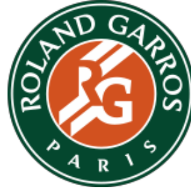
Şekil 1. 2. Fransa Açık (Roland-Garros) sembolü

Mayıs ve Haziran aylarında yapılan Fransa Açık Tenis Turnuvası ilk kez 1891'de Fransız ulusal lig şampiyonu erkeklerin kulüpler arası müsabakaları şeklinde gerçekleştirilmiştir. 1897 yılına gelindiğinde tek kadınlar arasında düzenlenen müsabakalarda turnuvaya eklenmiştir. Fransız olmayan oyuncuların şampiyonaya eklendiği yıl olan 1925 de ayrıca çift kadınlar müsabakaları da oynanmaya başlamıştır. 1968 yılında turnuva hem profesyonel hem de amatör oyunculara açılmıştır (Britannia, 2021). Fransa açık turnuvasını bu zamana kadar en çok kazanan İspanyol oyuncu Rafael Nadal, Fransa açığı toplamda 13 kez kazanarak ve Grand Slam tarihine geçmiştir.