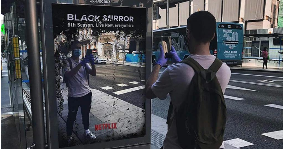
Görsel 2.1. Black Mirror dizisi reklam afişi

Black Mirror dizisi insanın günümüz koşullarında içinde bulunduğu bilimsel ve teknolojik gelişmelerden olumlu ya da olumsuz nasıl etkilendiği ve bu gelişmeler karşısında nasıl tavır aldığına ilişkin yaşamdan örnekleri göz önüne sermektedir. Mevcut dünya düzeninin yanı sıra yeni dünya karşısında yaşamın nasıl olabileceği ya da olması gerektiği, insanın olanaklarının kendini nasıl açığa çıkarabildiği ya da insan olmanın nasıl unutulabildiğini sorgulamayı sağlamaktadır. Bu sorgulamalar en çok da “İnsan nedir?” sorusunu yeniden sordurmaktadır. Öngörülen yeni dünya düzeninin içinde “insan olma” ya da “insan olarak kalabilme” adına tercihlerimizin, istemelerimizin ve yapıp ettiklerimizin nasıl farklılaşabildiğini ve yaşamda karşılaştığımız etik ikilemler karşısında nasıl karar verebildiğimizi ortaya koyarken, aynı zamanda nasıl olması gerektiğine ilişkin de bir farkındalık yaratmaktadır. Özellikle biyo-teknolojik ve genetik gelişmelerin her iki türden doğa üzerinde de etkisinin olacağı kaçınılmazdır. Bu türden gelişmelerin insanın ‘yaşam kalitesi’ni arttırmasına mı, yoksa insan elinden çıkma -yani ‘yapma’- bir insan doğasının onun ‘kendi olma’ imkânını elinden almasıyla mı sonuçlanacağı, ‘bir insanın başka bir insanı tasarlayarak üretmesi’nin (Habermas, 2003a: 28) ve gelişen teknolojinin insan hayatını