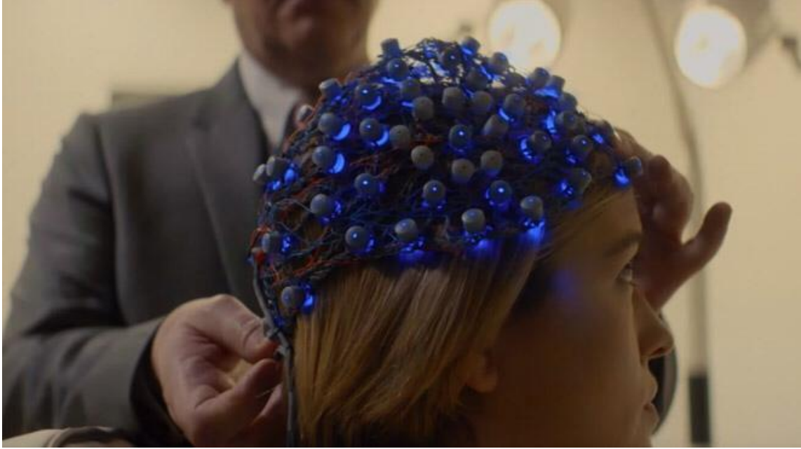
Görsel 2.7. Black Mirror 4. Sezon 6. Bölümden sahne örneği

Tıp alanındaki gelişmeler insanlığı umutlandırdığı kadar kaygı da uyandırmaktadır. “ ‘Bilim kötüdür’ demiyoruz. Ama insanlığa zarar verecek bir ‘kötü bilim’ var olabilir. Bilim sık sık hata yapar. Nasıl ki, bilimin el üstünde tutulan seri zaferleri için bir tarih yazıyor, yaptığı hatalar için de bir tarih yazılabilir. Bilim, doğayı anlama ve doğayla uyum içinde yaşamı sağlamak için gerekli olan bilgiyi elde etme yolunda oluşturulan bir kavramlar sistemidir. Böyle düşünüldüğünde, kişi, doğanın anladığımız ve bildiğimiz kadarıyla uyum içinde yaşanabilecek bir bünye olduğuna inanıyorsa, bilimi bırakabilir. İnsanlığa hizmet eden iyi bilimle, insanlığa hizmet etmeyen kötü bilimi birbirinden ayırabilir. Bu açıdan bakıldığında bilim, başından beri etik değerlerle şekillendirilmiştir ve onlardan ayrılamaz. Bu nedenle, ‘nötr’ ya da etik değerlerden bağımsız olduğu iddiasını güden bilim, bilimsel kanıtları göz ardı eden bilim kadar kötüdür” (HO, 2001:26-27). Biyoteknolojik ve genetik gelişmelerin daha şimdiden, insanı hem bedensel hem de zihinsel olarak gerçekleştirebileceği köklü değişimler, insanın gelecekteki yapısı ve konumu nasıl olacağını artık daha sık düşündürmektedir. Çünkü “insan genomunu anlama ve manipüle etme kapasitemiz, kafamızdaki ‘insan’ mefhumunu da değiştirecektir” (Mukherjee, 2018: 12).