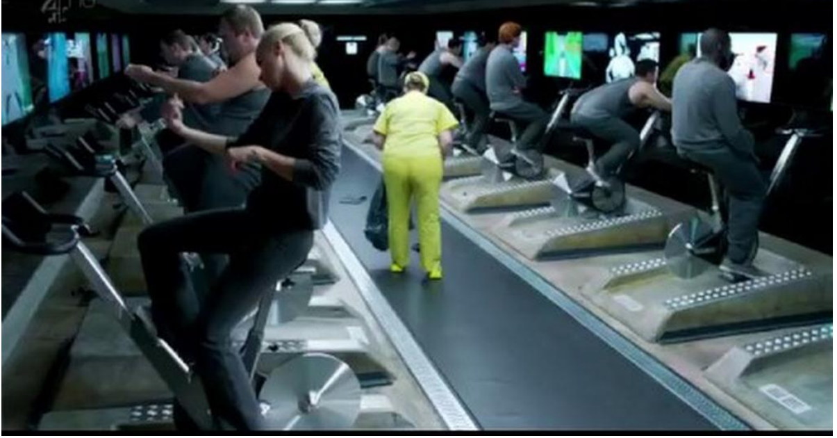
Görsel 2.3. Black Mirror 1. Sezon 2. Bölümden sahne örneği

işaret eder: İnsan yeryüzünde her şeyden önce -hangi dine mensup olduğu, hangi dili konuştuğu, ırkı ya da cinsiyeti, etnik kimliğine bakılmaksızın- onur ve değer sahibi bir varlık olup, haklar bakımından eşittir. Bu değere zarar veren de yine insanın kendisi, kendi yapıp ettikleridir. “İnsan onuruna, kendi onurumuza, uğradıklarımızla değil, yaptıklarımızla zarar veririz, çünkü yaptıklarımızdan sorumluyuz, başkalarının bize yaptıklarından değil” (Kuçuradi, 2011a: 69). Bu nedenle insanın doğuştan sahip olduğu onurunu ve değerini koruması için eylemde bulunurken sorması gereken ilk soru “Kendimin ve başkalarının değerini, onurunu korumak için ne yapmalıyım?” olmalıdır.