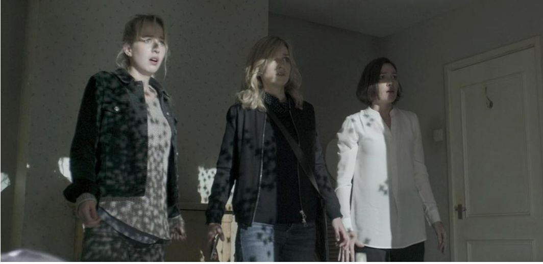
Görsel 2.4. Black Mirror 3. Sezon 6. Bölümden sahne örneği

Teknolojinin sunmuş olduğu imkanların amacının dışında kullanılmasıyla kişilerin temel hak ve özgürlük alanlarına müdahalenin ve etik ihlallerin kaçınılmaz olduğunu dizinin farklı bölümlerinde izlemekteyiz. İnsanların kitle iletişim araçlarını ve özellikle sosyal medyayı kullanarak ve yalnızca bir “( # ) hashtag ile etiketleyerek” başkalarının yaşamlarını bilerek ve isteyerek biyolojik ve psikolojik olarak kolayca geri dönülemez zararlara uğrattığını görmekteyiz. Bu yolla aslında adalet sağlanmaya çalışılırken, hukukun varlığı yok sayılmaya ve işlevsiz hale getirilmeye ya da “linç kültürü”nün yaşamımızda adil yargılamanın önünde yerleştirilmesine sebep olunmaktadır. Black Mirror dizisinde özellikle 3. sezon 6. bölümü olan Sosyal Linç ile 2. sezon Dibe Vuruş bölümü kişilerin sosyal medya üzerinden inşa ettikleri iletişimle artık gerçeklikten uzak ve simülasyonlardan oluşan bir yaşamı yaşarken ben-sevigişinin daha çok esiri olmakla daha çok etik soruna yol açtıklarını içermektedir. Pratik etik sorunlar yalnızca sosyal medya araçlarının kullanımıyla ilgili sorunlar olmayıp insan bedeni üzerinde yapılan biyoteknolojik gelişmelerle de ilgilidir.