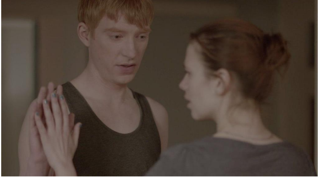
Görsel 2.8. Black Mirror 2. Sezon 1. Bölümden sahne örneđi

olması isteđi insan doğasındaki sonluluk düşüncesinin de sonunun gelmesi isteđinin ne kadar güçlü olduğunu ve teknoloji aracılığıyla bunun ne kadar mümkün kılınabileceđini göstermektedir.