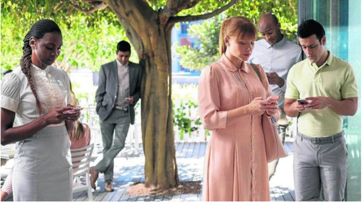
Görsel 2.5. Black Mirror 3. Sezon 1. Bölümden sahne örneği

Black Mirror dizisinin bölümlerinde genel olarak dijital yaşamın ve teknolojinin gelişimiyle internetin sunduğu imkanların ve sanal gerçekliğin ortaya çıkardığı ya da çıkarabileceği etik sorunlar -özellikle etik kişi değerleri ve etik ilişki değerlerinin yitilmesiyle ortaya çıkan sorunlar- üzerinde durulmaktadır. Bu sorunların en dikkat çekici biçimde vurgulandığı bölümlerden biri 3. sezonun Dibe Vuruş bölümüdür. Yine 3. sezonda Sus ve Dans Et ile 4. sezonda Arkangel ve Hang the DJ bölümlerinde de güven, saygı, dürüstlük, sevgi gibi etik ilişki değerlerini ihlal ettiğine ilişkin örneklerle karşılaşmaktayız. 3. sezonun Dibe Vuruş bölümü, insanın değerinin ortaya koyduğu başarılarından değil de sosyal medya paylaşımlarından, sanal gerçeklikte elde ettiği “başarılar”dan -hobileri, fobileri, fiziksel görünümü, giydikleri, yedikleri vb. sahip olduklarından- ibaret gören yeni bir “değerlilik” algısı üzerinden ortaya konulmaya çalışıldığı yeni dünya düzeninin etkileri ele alınmaktadır. Gerçek olan ile sanal olanın birbiriyle iç içe geçtiği, yaratılmış olan sanal kimliklerimize bakılarak “değerli” ya da “değersiz” kabul edildiğimiz dijital dünyanın sınırlarının iyice genişlediğine ve yaşamlarımızın yönetimini ele geçirdiğine tanıklık etmekte ve bu değişime hemen hiçbirimiz direnememekteyiz. Bunun bir örneği olarak Lacie'nin tercihleri, kararları, değerli ya da değersiz gördüklerinin belirlediği sanal yaşam da bunun bir örneğidir.