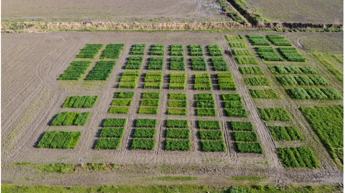
Şekil 3.1. Deneme alanına ait çeşitli zamanlardan görüntüler