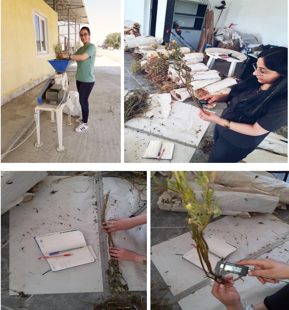
Şekil 3.2. Hasat sonrası alınan gözlemlere ait görüntüler

Hasat işlemi, 27 Nisan 2020 tarihinde karışımdaki türlerin hasat olgunluğuna geldiği dönemde; tek yıllık çimin çiçeklenme başlangıcında ve İskenderiye üçgülünün %50 çiçeklenme dönemine geldiği zaman Çayır biçim makinesi yardımı ile hasat işlemi yapılmıştır. Kenar tesiri olarak parsel başı ve sonundan 50 cm ve kenarlarda yer alan sıralar atıldıktan sonra tüm parselin biçilmesi ile gerçekleşmiştir.