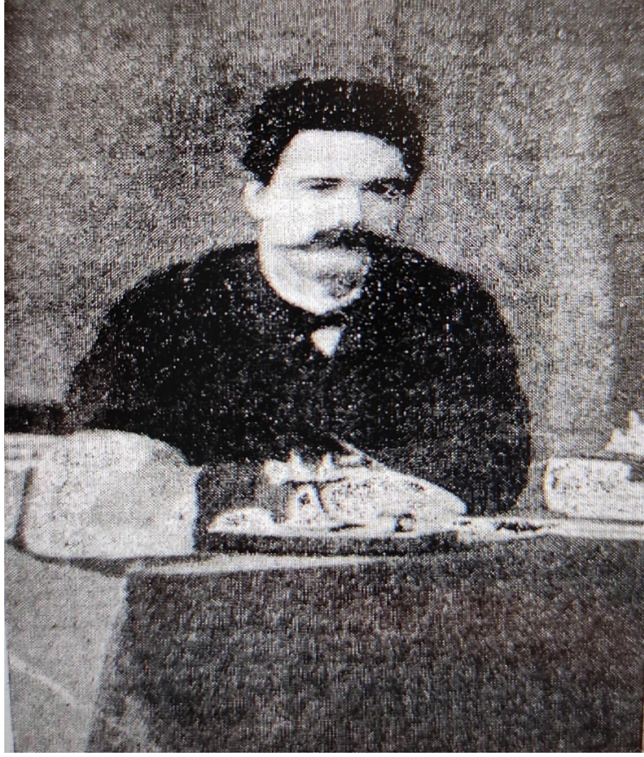
Resim 2: Beşir Fuad'ın Çalışma Masasında Fotoğrafi

Beşir Fuad'ın bu fotoğrafı önce Malûmat Mecmuasında 13 H. 1899'da 316 çıkmış sonraları ise Beşir Fuad ile alakalı ansiklopedi maddelerine konmuştur. Malûmat mecmuasının VIII. Cildinin, 176 Numaralı ve 1190. Sayfasında yer alan bu fotoğrafın altında “ Meşahir-i müharririnizden müteveffa Beşir Fuad Bey. ” Şeklinde not düşülmüştür.