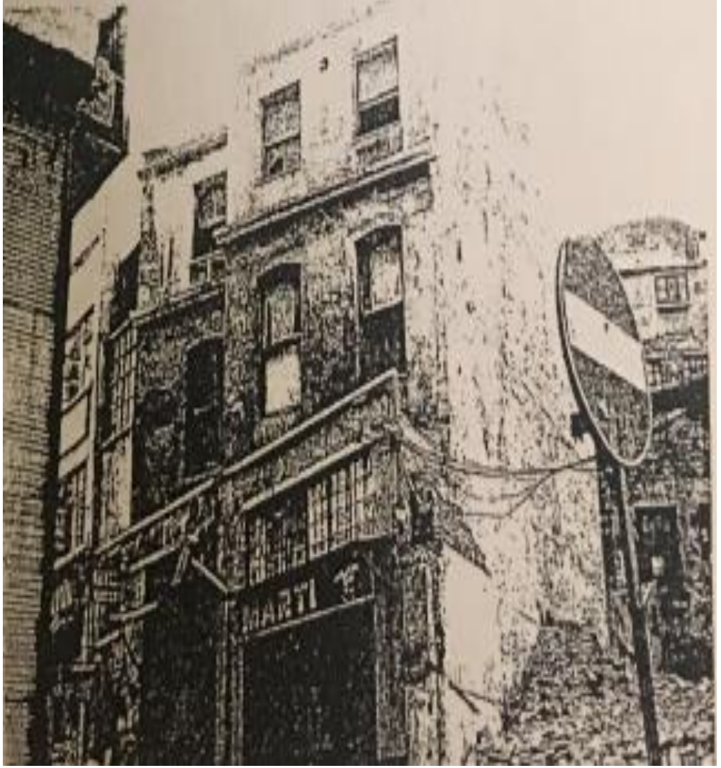
Resim 6: Beşir Fuad'ın İntihar Ettiği Ev

Bu ev Beşir Fuad'ın intiharını icra ettiği evdir. Adresi: Babıali, Nallımescit Mahallesi, Çağaloğlu Yokuşu, No: 12, İstanbul. Bu fotoğraf 1982 senesinde çekilmiştir. 320