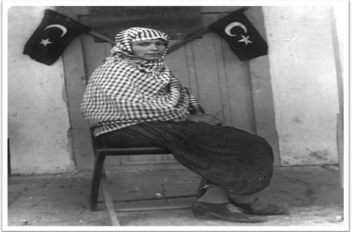
Görsel 2.3.: Seçme ve Seçilme Hakkı, 1934