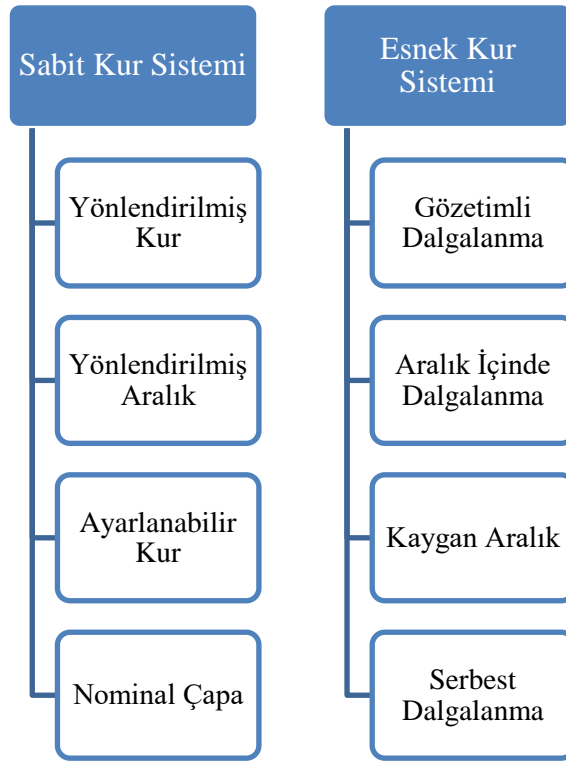
Şekil 1: Döviz Kuru Sistemleri

Bir ülke ekonomisinde uygulanan döviz kuru sistemleri ödemeler dengesi, enflasyon, istikrar gibi makroekonomik parametrelerin belirlenmesinde büyük bir rol oynayabilmektedir. Döviz kuru sistemleri döviz kurlarının belirlenme ve değişiminin hangi esaslar göz önüne alınarak uygulanacağı ile ilgili kurallar olarak tanımlanabilir. Döviz kuru sistemleri temelde sabit ve esnek döviz kuru sistemleri olarak iki grupta incelenmektedir. Ancak farklı sistemler de mevcuttur (Okur, 2002: 43). Bu alternatif sistemler, esnek döviz kurunun kısıtlanması ile ortaya çıkan gözetimli dalgalanma, aralık içinde dalgalanma, kayan aralık sistemleri ve sabit döviz kurunun değiştirilmesi ile ortaya çıkan, yönlendirilmiş sabit aralık, yönlendirilmiş sabit kur, ayarlanabilir sabit kur sistemi olarak alt gruplar halinde incelenebilmektedir. Alternatif sistemlere göre temel döviz kuru sistemleri en uç noktalarda olan döviz kuru sistemleri olarak öne çıkmaktadır (Gök, 2006: 131-139). Döviz kuru sistemleri ve alternatif sistemler Şekil 1’de gösterilmektedir.