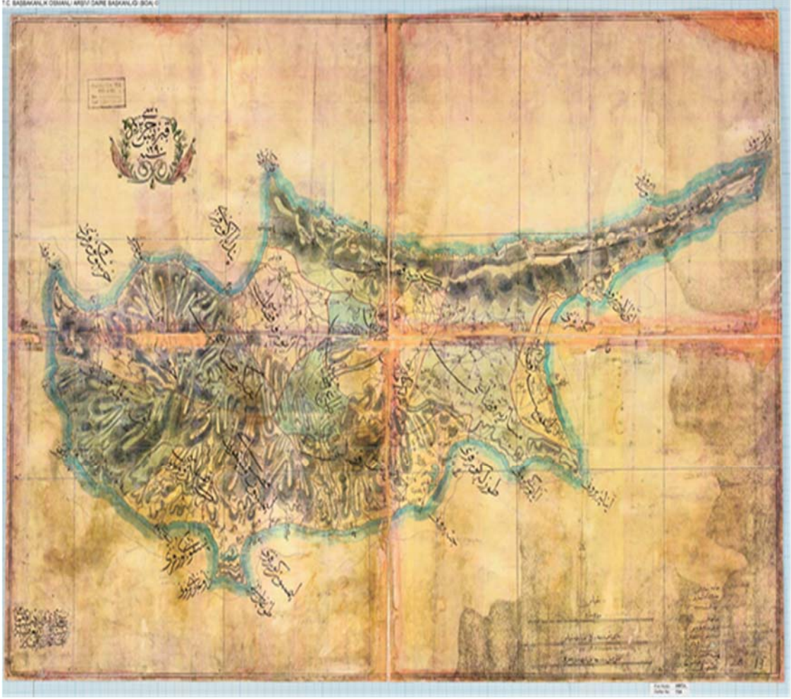
EK 4. Kıbrıs Haritası