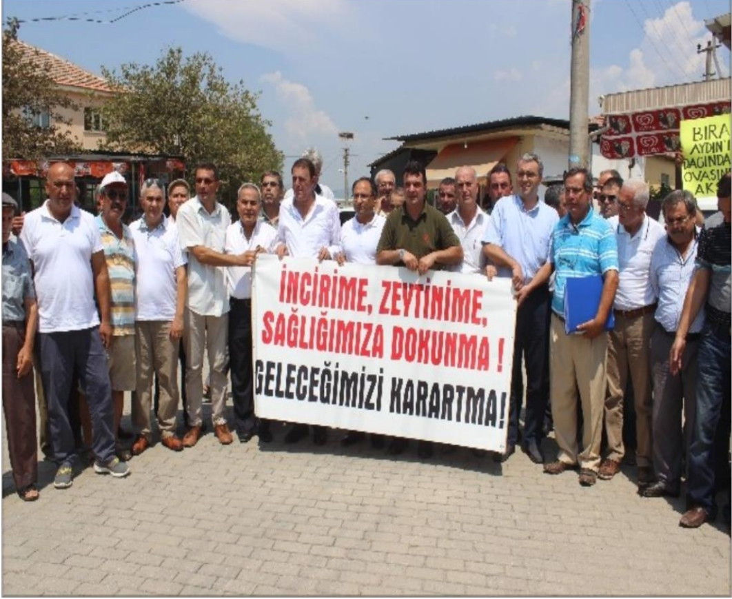
Resim 2.5. Germencik İlçesi Turanlar Mahallesiinde ÇED Toplantısı Öncesi Bilgilendirme (29 Şubat 2016) (www.hurriyet.com.)

Jeotermal ile ilgili yaşanan sıkıntıları dile getiren konuşmacılar, sermaye sahiplerinin korunup çiftçilerin ve çevrenin yok sayıldığını belirterek çevreye zarar vermesine rağmen ÇED raporu veren yetkililere tepki göstermişlerdir (www.hurriyet.com, 2015).