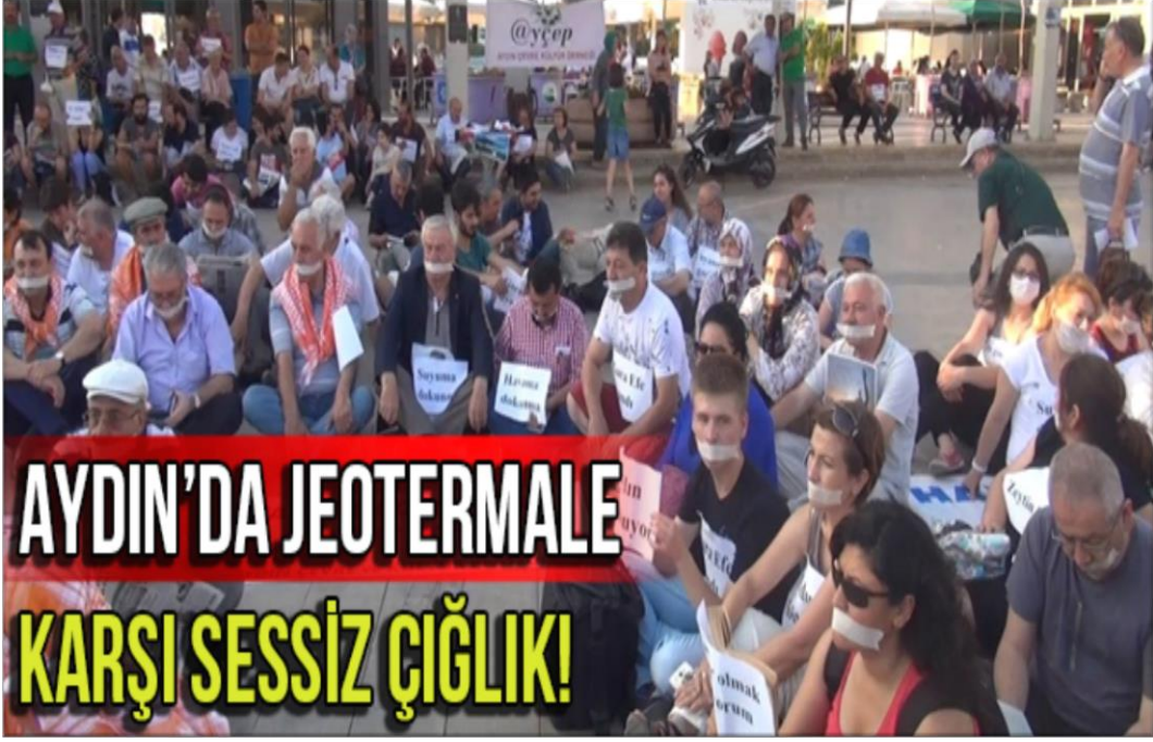
Resim 2.10. AYÇEP Oturma Eylemi (19 Mayıs2018 ) ( www.aydinpost.com )

Kasım 2016 da Aydın'ın Germencik ilçesi Tekin köyü yakınlarında Jeotermal Santral (JES) için verilen “ÇED gerekli değildir” kararına karşı köy halkının GERÇED (Germencik Çevre ve Doğa Derneği) desteği ile açtığı dava başarı ile sonuçlanmıştı. Böylece doğa ve çevrenin tahribatına karşı devletin duyarsız kalmasını engelleyen ilk dava kazanılmıştır ( www.evrensel.net , 2016). Ardından Kasım 2017 de ikinci davayı kazanma başarısını da göstermişlerdir ( www.akinyakan.av.tr , 2017)