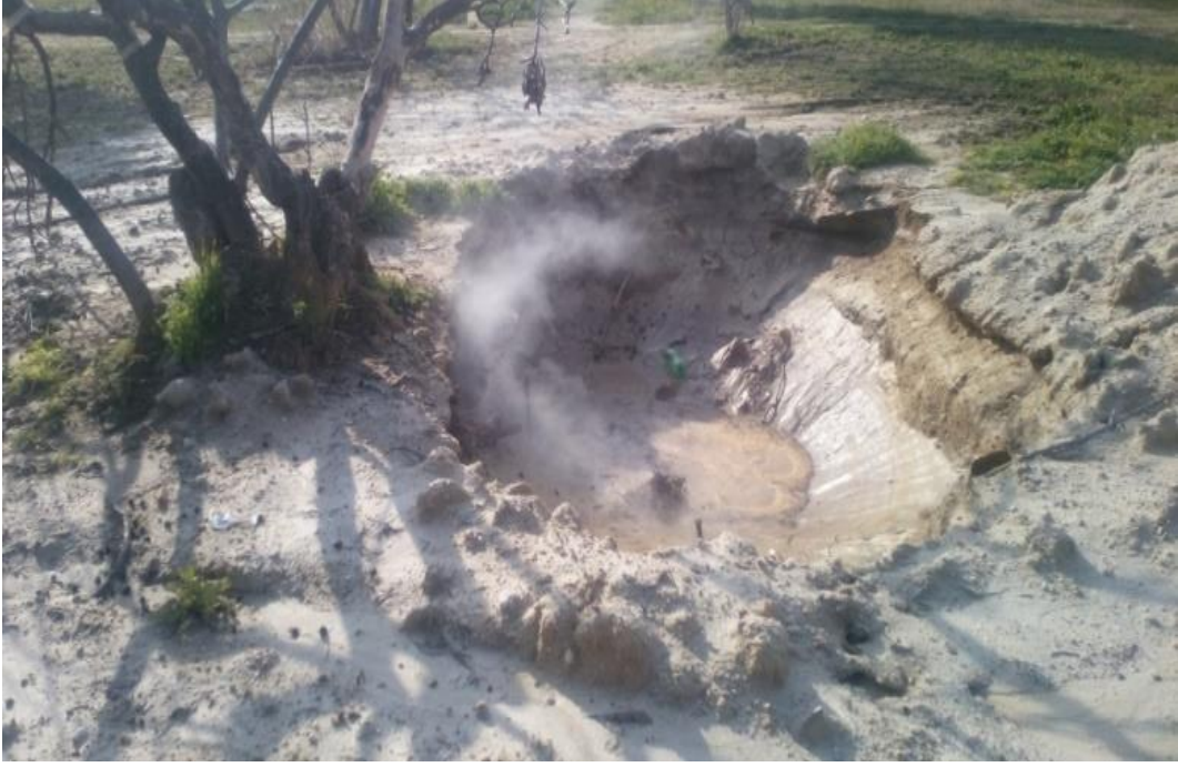
Resim 2.2. Sondaj İçin Kullanılan Kimyasalların Toprak ve Ağaçlara Etkisi

Yılmazköy’de başlatılan mücadele Mart 2015 de Germencik ilçesinde bir yürüyüş ile devam etmiştir. Aydın Ziraat Odası, Tabipler Odası, ADD Aydın şubeleri ve Germencikli Çiftçiler Plâtformun çağrısıyla başlayan yürüyüşe, Aydın Büyükşehir Belediye Başkanı, Aydın Milletvekili aday adayları ve Ziraat Mühendisleri Odası, Aydın Tabipler Odası, Aydın Atatürkçü Düşünce Derneği, Birleşik Haziran Hareketi, EGEÇEP üyeleri de katılmıştır.