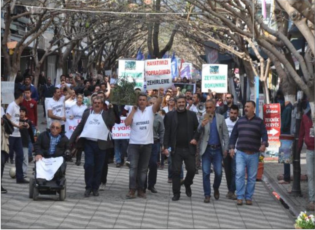
Resim 2.7. İncirliova’da Düzenlenen Miting (19 Mayıs2018)

İncirliova Çevre ve Kültür Plâtformu tarafından son zamanlarda giderek artan jeotermal kuyulardan bırakılan suların doğaya zarar verdiği belirtilmiş, miting düzenlenmiştir. Siyasal partiler ve muhtarlar tarafından düzenlenen mitinge Aydın milletvekilleri, Aydın Tabip Odası, Siyasî parti temsilcileri, sivil toplum örgütleri, çevreciler ve vatandaşlar katılmıştır. Mitingde sembolik gösterilerle .-Bir tabuta zeytin ve incir fidanı konmuş, tabutun başında yerel sanatçılar incir ve zeytin türküleri söylemiş, kısa oyunlar sergilenmiş-. Zeytin ve incirin tehlikede olduğu vurgulanmıştır. Mitinge katılanlar, “Bırakın dağımdan yağ, ovamdan bal aksın”, “Zeytinime dokunma”, “Hayatımızı, toprağımızı zehirleme”, “Havama, suyuma, toprağıma, ormanıma dokunma”, “Tarım alanlarıma dokunma” yazılı pankartlar taşımıştır.