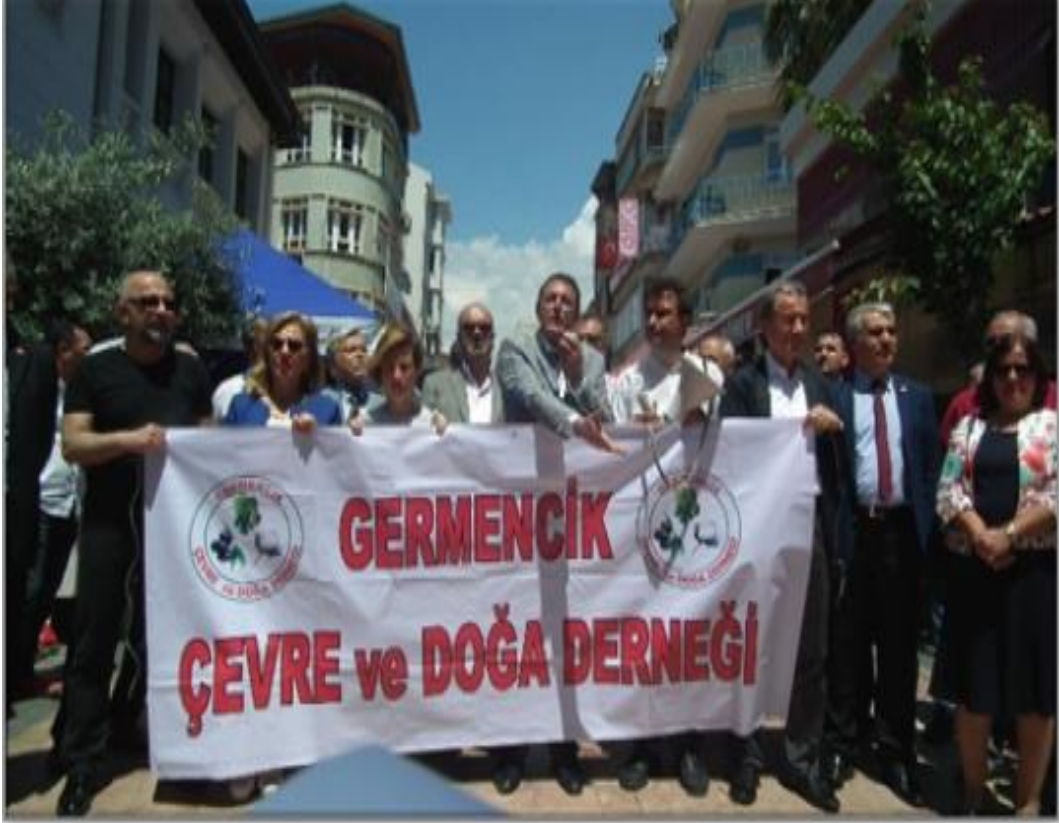
Resim 2.9. GERÇED Kermesi (19 Mayıs 2018 )

sularımızı kirleterek toprağımızı ve bitkileri zehirlediği, bitkileri tüketen insanların da birinci dereceden bu zararlar karşısında kaldığı üzerinde durmuştur. Dünyanın hiçbir yerinde yetişmeyen sarı lop incirin sadece Aydın bölgesinde yetiştiğini belirterek, incirimizden, zeytinimizden, bitki örtümüzden, insanların sıhhatinden vazgeçmeye değer mi? Bu nedenden dolayıdır ki jeotermale hayır değişimizin sebebi budur” demiştir (www.haberturk.com, 2016).