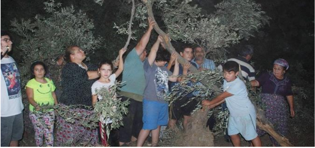
Resim 2.1. Aydın Yılmazköy’de Kökünden Sökülen Zeytin Ağaçları (10 Haziran 2019)

Aydın Yılmazköy bölgesinde 2014 yılı Kasım ayında ilk sondaj kuyusunun açılması ile çevre tahribatı da başlamıştır. Eylül 2015 ‘de Kuyudan çıkan zehirli gaz, çalışan işçilerin ve yöre halkının zehirlenmesine neden olmuştur. Sondaj ile çıkan akışkan sulama kanalına verilince civardaki bitki örtüsü zarar görmüştür. Sondaj çalışmaları için asırlık zeytin ağaçları usulsüz biçimde kesilmiştir. Çocuklarını, torunlarını besleyen zeytin ağaçları da ellerinden gitmeye başlayınca yöre halkının ilk tepkileri de ortaya çıkmıştır (www.yesilgazete.org, 2015). Köy muhtarı ve köylüler zeytin ağaçlarının kesimini engellemişler. Bundan sonra dava süreci başlamış ve kamulaştırma kararının yürütmesi durdurulmuştur. Ayrıca jeotermal enerji şirketinin birinci sınıf tarım arazisinde, asırlık zeytin ağaçlarını yok ederek sondaj kuyusu açması, zeytin bahçelerinin içinden arazi sahiplerinin rızası olmadan akışkan borularını geçirmesine izin veren Aydın Valiliği’nin, “Çevre Etki Değerlendirme (ÇED) raporu gerekli değildir” kararının iptali için de dava açılmıştır.