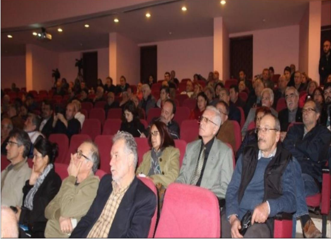
Resim 2.6. Çevre Kurultayı (29 Şubat 2016)

Jeotermale karşı mücadele Ocak 2016 da Aydın Tabip Odası öncülüğünde düzenlenen Çevre Kurultayında devam etmiştir. Aydın Tabip Odası öncülüğünde düzenlenen Çevre, Ziraat ve Türk Tabipler Birliği'nden davetlilerin de katıldığı kurultayda yerelde Aydın genelinde ülkede yaşanan kirlilik ele alınırken, usulüne uygun kullanılmadığı için jeotermal kaynakların neden olduğu ileri sürülen çevre sorunları da konuşulmuştur. Aydın Tabip Odası başkanı “ Bizler çok iyi biliyoruz ki sürdürülebilir yaşam ve gelecek adına temiz ve sağlıklı suya, havaya, toprağa ve gıdaya, demokrasiye ihtiyaç vardır. İnsanların en temel hakkı olan “yaşam hakkı” ve “sağlıklı çevrede yaşama hakkı” tüm bu can damarlarımızın kirlenmesinden ve kurutulmasından, özelleştirilmesinden dolayı yokedilme sürecine girmiştir.” demiştir (www.haber24.com).