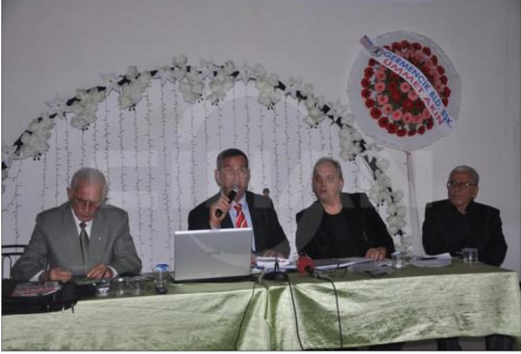
Resim 2.4. Jeotermal Enerji Santrallerinin Tarıma ve İnsan Sağlığına Etkileri Paneli (22 Mayıs 2016)

Konuşmacılar; Aydın'da 1500 yeni jeotermal kuyusunun verimli tarım arazileri üzerinde açılacağı vurgulamış. Yasalara uygun olmayan gaz salınımları, derelere ve Büyük Menderes nehrine akışkanların boşaltılması, toprağa gömülen çalışma atıklarına dikkat çekmiş, bu uygulamaların insanlar, hayvanlar ve bitkiler üzerindeki ölümcül olabilecek etkileri, tarım arazilerinin yok oluşu, Büyük Menderes Nehri'nin ölü bir nehir haline gelişi vurgulanmıştır (www.hurriyet.com, 2016).