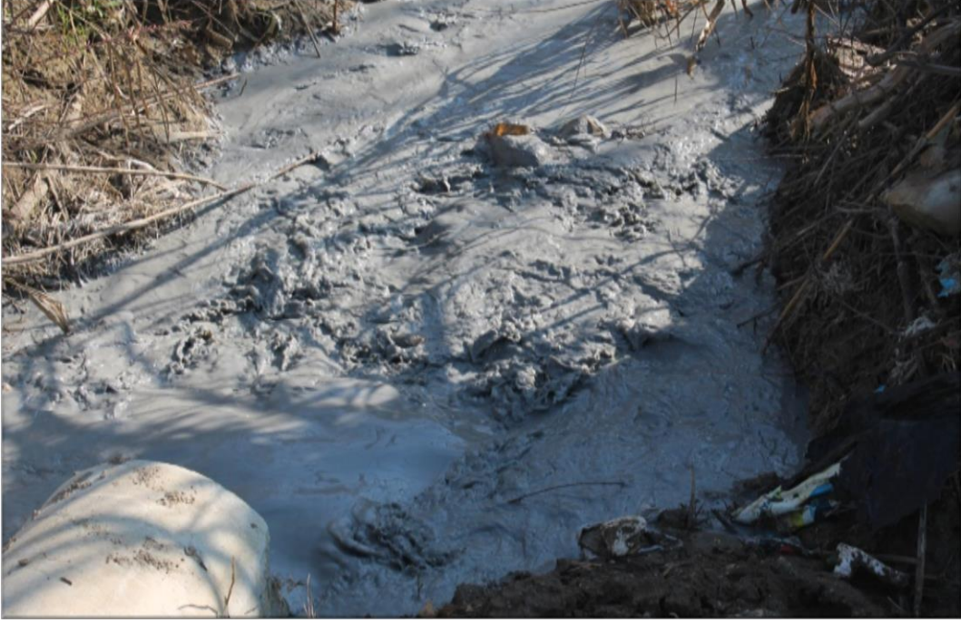
Resim 2.8. Derelere Bırakılan Akışkanlar.

hayvan yoksa yaşam yoksa üreteceğin elektriği nereye kullanacaksın? İşte bunun adı vahşî kapitalizmdir. Artvin’de doğayı tahrip eden Soma’da zeytinlikleri yok eden, Aydın’da toprağı kurutan ve insanı yok sayan enerjiyi istemiyoruz. Doğayı katleden enerjiyi istemiyoruz” demiştir (www.aydin hedef.com, 2016)