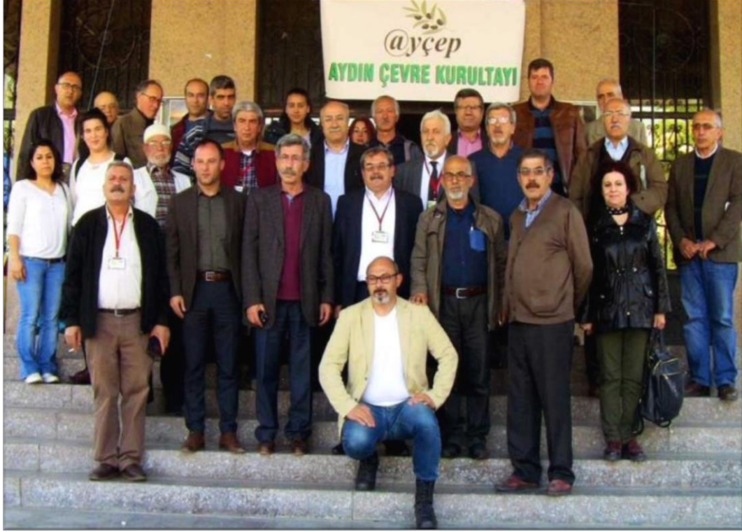
Resim 2.10. Aydın'da Çevre Kurultayı (19 Mayıs2018 )

CHP milletvekillerinin jeotermal santrallerin batıdaki gibi işletilmesi durumunda zararsız olacağı ve kapatılmasına gerek olmadığı sözleri salonda tepki çekti (www.evrensel.net, 2017).