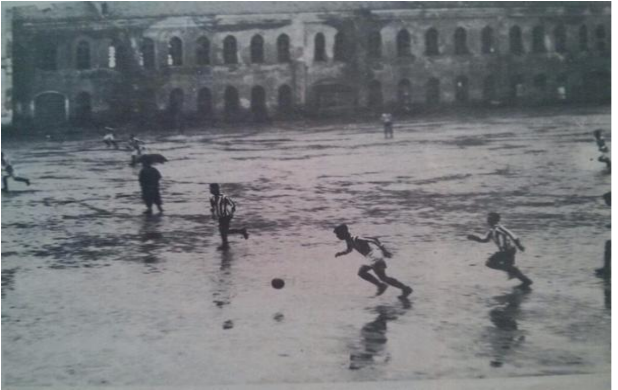
Resim 1. Harbiyeli Niyazi Bey (Taşdelen) elinde şemsiyesiyle maç yönetirken (WEB_2).

Resim 1'de yağmurlu bir havada paltosu ve şemsiyesiyle maç yöneten hakem görülmektedir.