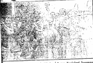
Tekel'in Aydın'da Yaprak Tütün İşleme Tesisleri kurması konusunda Bakanlar Kurulu kararı Aydın'da sevinçle karşılandı.

Tekel'in Aydın merkez bünyesi müdürlüğü bünyesinde işleme atölyesi kurulmasına karar verildi. 4 adet açım makinelili olarak kurulmasına karar verilen işleme tesislerinin kuruluş çalışmalarına esas olacak uygun bina ve personelle ilgili bilgilerin Tekel Genel Müdürlüğüne bildirilmesi istendi.