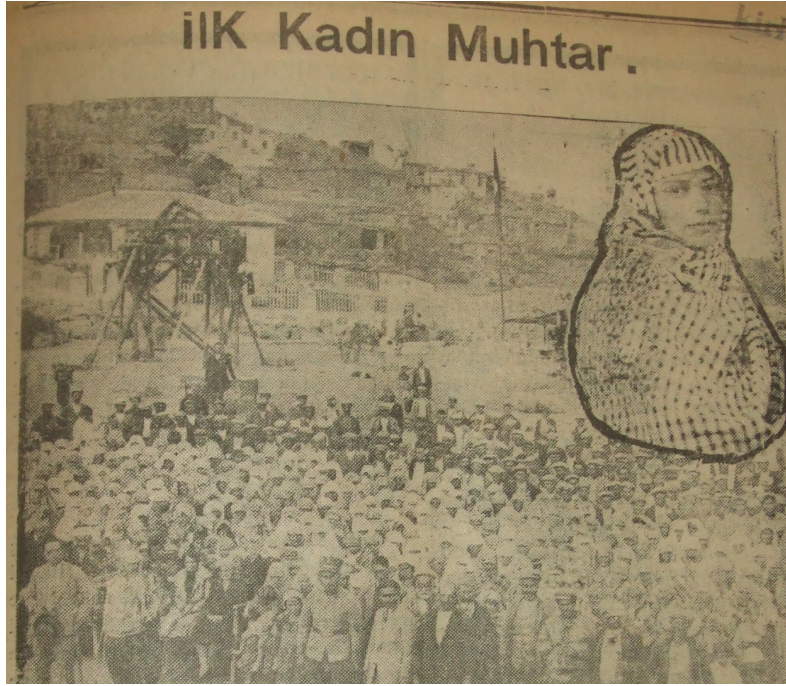
Resim 5: Hakimiyet-i Milliye 16 İkinci Teşrin 1933