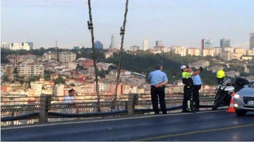
Resim 5.1: Yukarıda bahsi geçen habere ilişkin fotoğraf