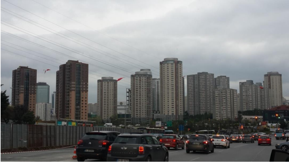
Resim 1.3. Genel kent görüntüsü açısından güvenli sitelere dair bir başka örnek