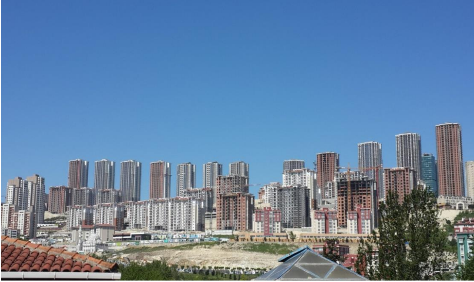
Resim 1.1. İstanbul’daki hakim inşaat sektörü için bir görüntü

giderek önemli bir yaşam tarzına dönüştüklerini söylemek mümkün hale gelmiştir. Artık büyük nüfus miktarlarını içinde barındıran bu yeni yaşam konseptini, neoliberal kent düzleminde ‘risk, korku ve belirsizlikler’ bağlamında tartışabilmek de mümkün hale gelmiştir. Çünkü ‘neoliberal iş’, ‘neoliberal kent’ ve bunların ürünü olan ‘belirsizlikler’ şeklindeki bir tartışmayı yansıtabilecek en önemli alan da burası olabilmektedir. Kentin geneli açısından hem görünürlüğü hem de tercih düzeyi önemli seviyelere erişen bu konut sektörünün, çalışmanın/işin dönüşümün bir sonucu olarak tahlil edilmesi önemli bir sosyolojik gerekliliğe dönüşmektedir. Sahip olduğu bu tarz özellikleri düşünüldüğünde İstanbul, ‘risk, korku ve belirsizlikler’ bağlamında tartışılacak olan bir güvenli site analizi için, oldukça değerli göstergelere sahip bir alan haline gelmektedir. Bu nedenle de çalışmanın evreni İstanbul metropolitan alanındaki güvenli siteler olarak belirlenmiştir.