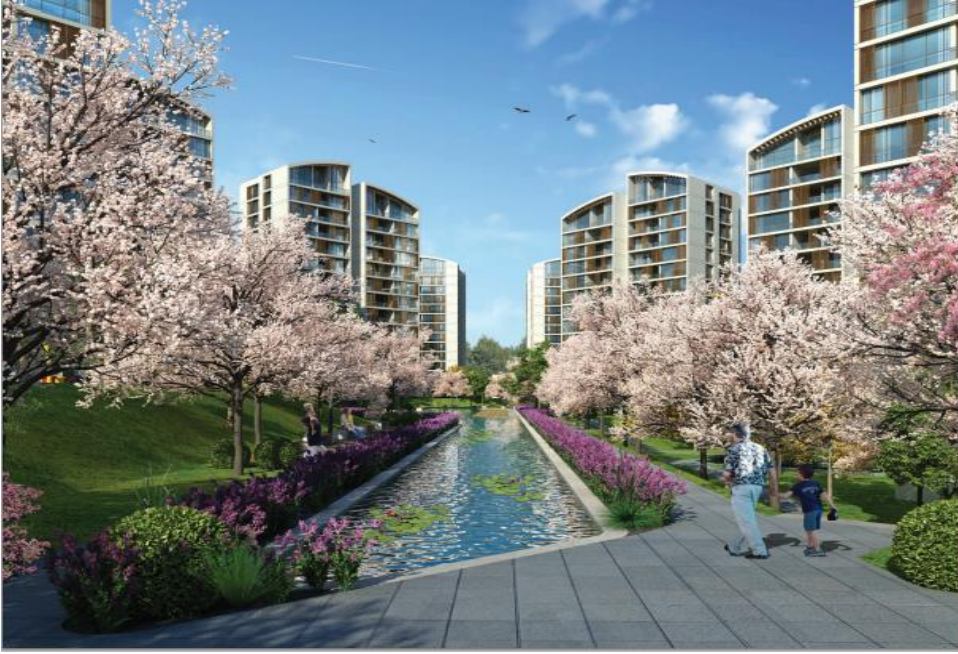
Resim 5.10. Resim İstanbul’un ‘von Gogh’ tablosuna gönderme yaptıęı yerde kullandıęı resim

“Resim İstanbul, Vincent von Gogh’un kardeşine duyduęu sevgiden beslenerek resmettięi kiraz aęaçlarını, aynı özen ve sevgiyle mimarisine taşımıştır... Resim İstanbul, Paul Cézanne’nin tablolarında olduęu gibi her kişide ayrı bir duygusal deneyim yaşatmayı hedefleyerek, doğanın unsurlarını modern çizgilerle harmanlamıştır... Resim İstanbul, Gusto Klint’in resimlerindeki ince ve dekoratif süslemelerden esinlenerek zarif detaylarla bezenmiştir” (Tanıtım kataloęu, s. 5-8).