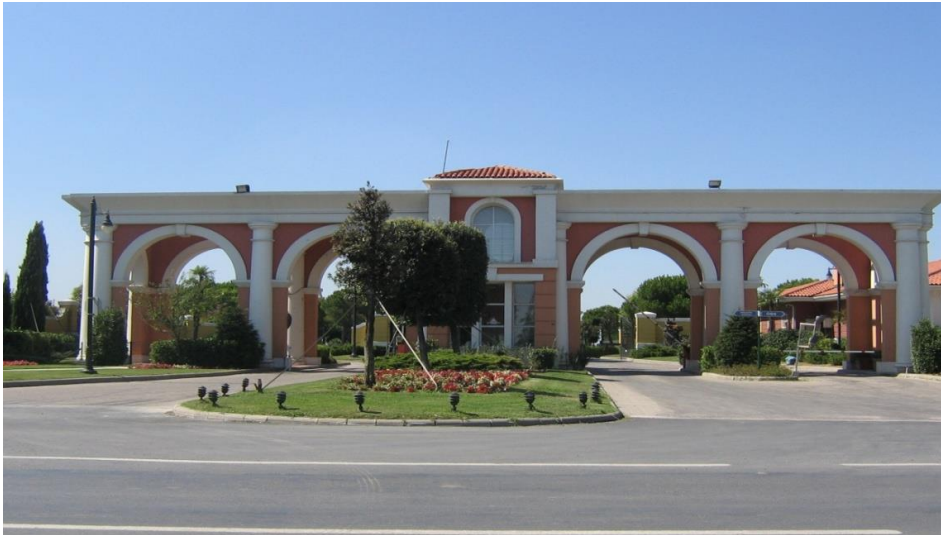
Resim 5.7. Güvenlikli sitelerin korunaklılık göstergesi olan ‘kale kapıları’