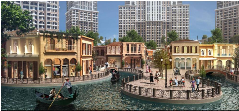
Resim 5.22. Viaport Venezia’nın Venedik kanallarını vaat eden sunumu