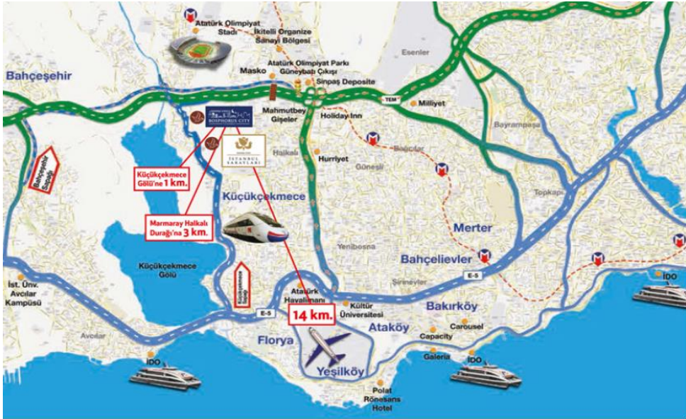
Resim 5.2. Bosphorus City'nin lokasyon krokisi (tanıtım kataloğundan)