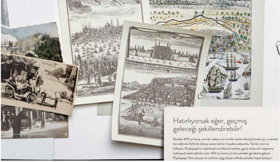
Resim 5.16. Piyalepaşa İstanbul projesinde sıklıkla geçen ifade tarzından bir örnek

Projelerin 'kadim tarih' yüklemesi yapan söylemleri ilerleyen aşamalarda giderek mekânın içerisini de isimlendirirken karşımıza çıkmaya başladılar. Bu tarz bir ifadenin nedeni de 'güvenlikli sitelere' doğal kamusal alanlar imgesi verebilecek yüklemeler yapabilmektir. Artık mekânların içerisinde 'Kollezyum' (Acarkent), 'Köy Meydanı' (Sinpaş Köyçeğiz), Kasaba (Kemer Country), Cumba (Ege Yakası) gibi isimlere rastladık. Fakat bu durum da ilerleyen zamanlarda projeler ortaya konulurken mekânın dizayn edilmesine dair isimleri de kadim kamusal alanlara atıf yaparak belirlenmesine bıraktı. Frigya, Likya, Karya (Sinpaş Aquacity), San Marco Meydanı (Viaport Venezia), Ortaköy, Salıcak, Dolmabahçe, Emirgan vb. (Bosphorus City) gibi isimlere bu türden projelerde çokça rastladık. Proje isimlerinde kadim kamusal alanların isimlerini kullanmanın amacı, bu kamusal alanlar için tarihsellikler yükleyen tarzlar ortaya koyabilmeleriydi. Bu durumun örneği olabilecek koşulları proje isimlerinde de artık çokça görmekteyiz. Bazı proje isimleri de aşağıdaki gibidir.