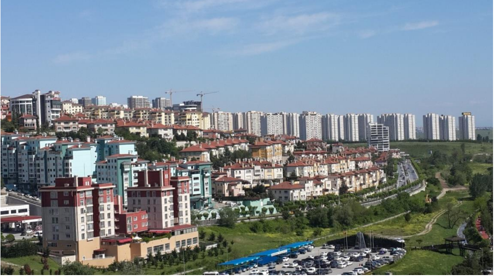
Resim 1.2. Genel kent görüntüsü açısından güvenli sitelere dair bir örnek