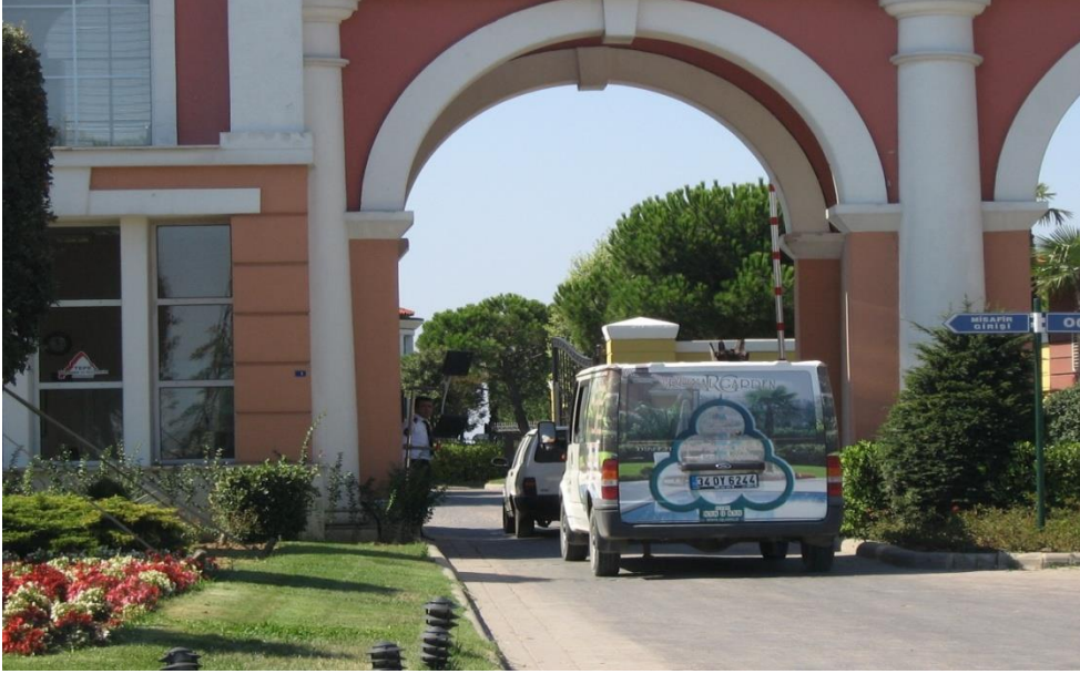
Resim 5.8. Güvenlikli sitelerin ‘göz kırpmayan’ kontrol biçimlerine bir örnek