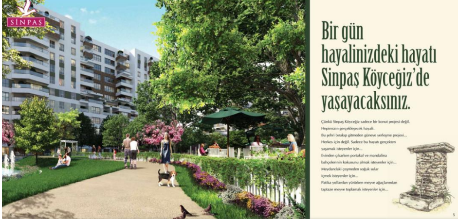
Resim 5.19. Bir yeni orta sınıf hayaline dönüştürülen kamusal vaatlere dönük dile bir örnek (ekatalog, s. 5).