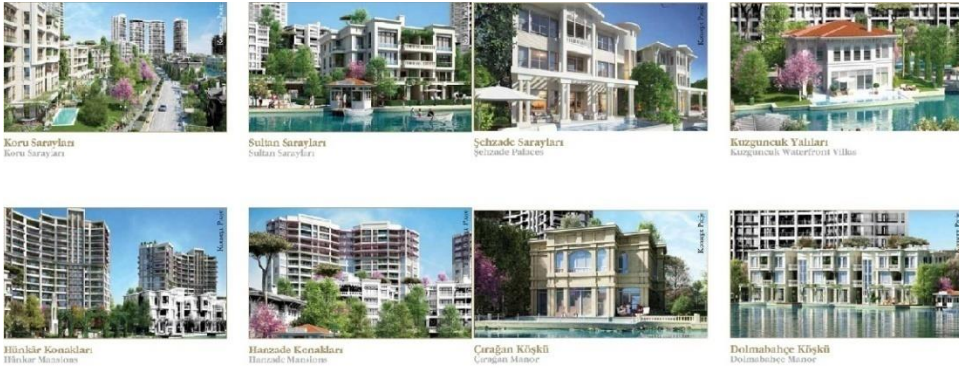
Resim 5.18. “Saraylardan saray beğenin: İstanbul Sarayları’nda seçiminiz hangisi olursa olsun, sultanlara layık bir hayat yaşayacaksınız” (Katalog, s. 38)

Söz konusu projelerde ‘kadim kamusal alanların’ bir örneği olarak, ‘yeni orta sınıf’ algısına hitap eden turistik mekân imgelerinin kullanımına da sıklıkla rastlanmaktadır. Turistik değeri olan ‘kadim kamusal alanların’ bir ‘yeni orta sınıf hayali olarak kentten kaçış’ imgesine dönüşmüşlüğüne dayalı olarak bu yöndeki sunumlar ve sunuma dair dillere son zamanlarda proje pazarlama sürecinde sıklıkla rastlanır oldu. Bu tarz yerler kendilerine gitmeye gerek kalmaksızın, ‘özelleşen kamusal alanlarda’ yaşanabilecek bir kopya olarak kitlesine sunulmaktadırlar. Böylesi yerler ‘karışmaya gerek duymayanlara’ ait özel