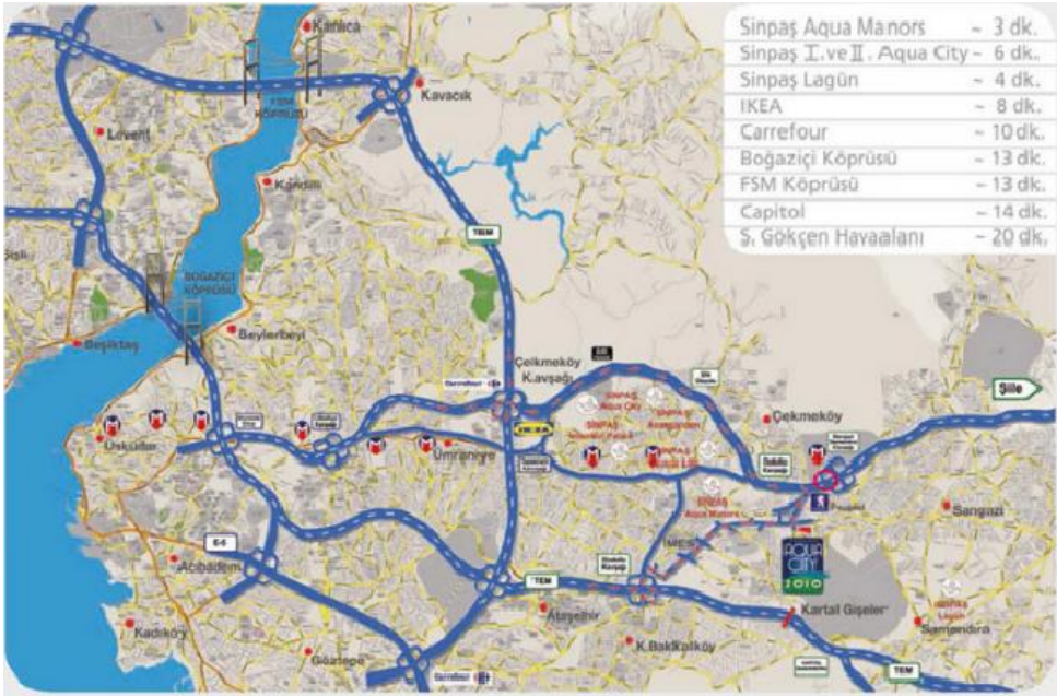
Resim 5.4. Sinpaş AquaCity'nin lokasyon krokisi (tanıtım katalogundan)