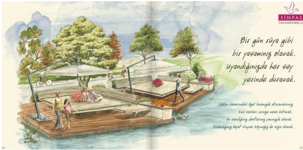
Resim 5.20. Kadim kamusal vaadi olarak ortaya konulan özelleşen kamusal alanlara dair bir başka örnek (Sinpaş Köyceğiz ekatalog, s. 13)

Benzer yönlü vurgularla ‘kadim kamusal alanları’ kente karşı bir kapalı yaşam olanağı olarak sunan bir başka proje de ‘Viaport Venezia’ projesidir. Projenin Venedik konseptli sunumu vaat ettiği tarzla birlikte, gizil de bir kamusal vaat ortaya koymaktadır. İçerisindeki sunumu yapılan ‘Venedik’in anlamı, aslında dışarıdaki kentin gereksizliğini mümkün kılacak bir kadim mekân algısı oluşturmanın sembolik değerini de ifade ediş şekli olmaktadır.