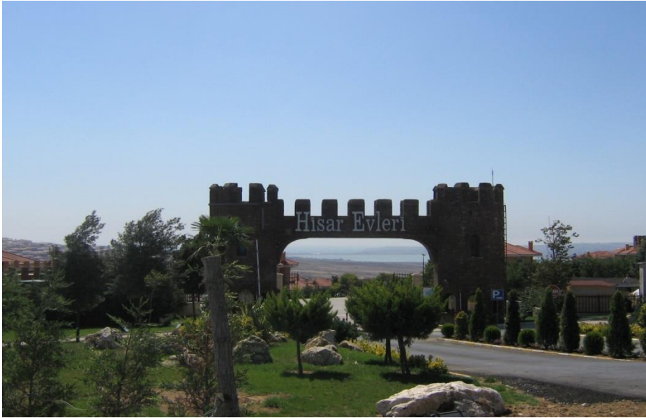
Resim 5.9. Giderek ‘kale kent’ görüntüsü veren kapalı yaşamlar