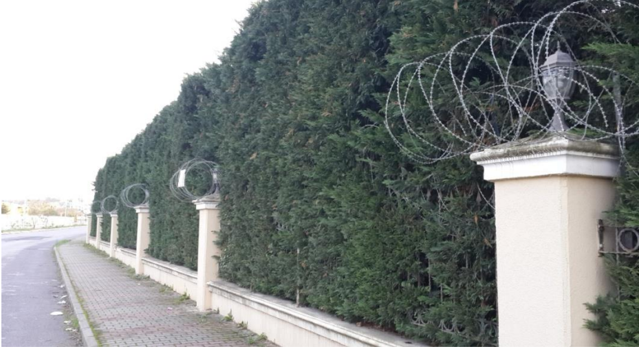
Resim 5.6. Güvenlikli sitelerinin korunma biçimine dair bir örnek

gözetleyen tanrılar öldüğü için, gözünü hiç kırpmadan gözetleyen tanrıların rolünü oynayan yeni araçlardır. Kapılar ve kontrol sistemleri, iç dünyasını ancak tanrıların bilebileceği ‘günahkârların’ mabete sızmasının ve kutsal mekâna ‘kirin bulaşmasının’ önüne geçen denetim araçları olmaktadır. Eğer mabete biri girecekse günahkâr ya da kirli olmadığını ispatını yapmak durumundadır. Duvarlar ise ‘sığınmacılar’ adına vatan savunmasının geçişsizliği için içerinin kutsallığının sınırlarını çizmektedir.