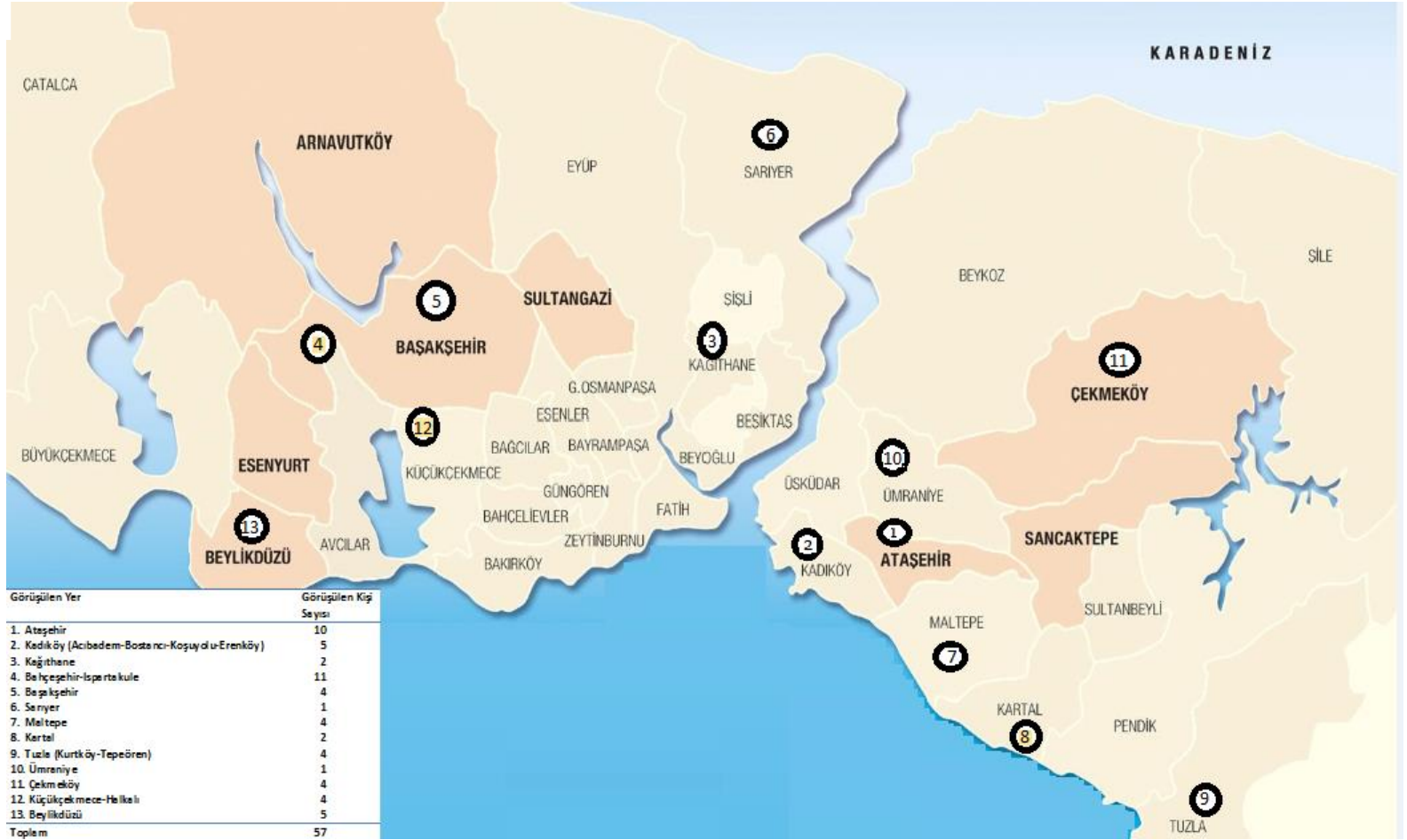
Harita 1.1. Araştırma boyunca alanda görüşme yapılan yerler ve örneklem sayılarının dağılımına dair tablo