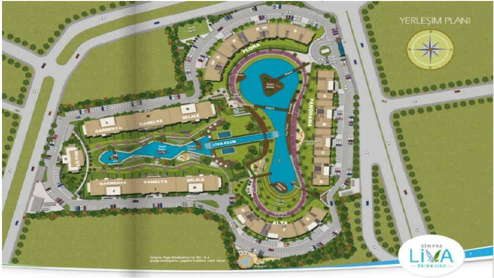
Resim 5.11. Bir kapalı yaşam ve de kamusal alan vaadi örneği olarak Liva Turkuaz'ın vaziyet planı

isimlendirme çabaları, içerisinde tamamiyle sakinlerine dönük bir kapalı kamusal alan ya da özelleşen bir kamusal alan vaadi taşımaktadır.