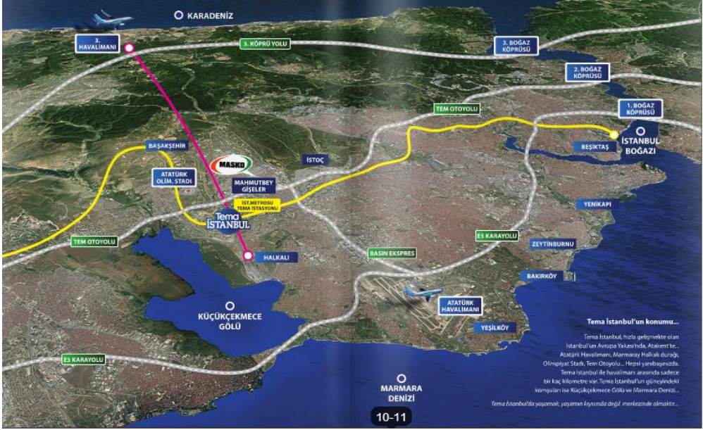
Resim 5.3. Tema İstanbul'un lokasyon krokisi (tanıtım katalogundan)