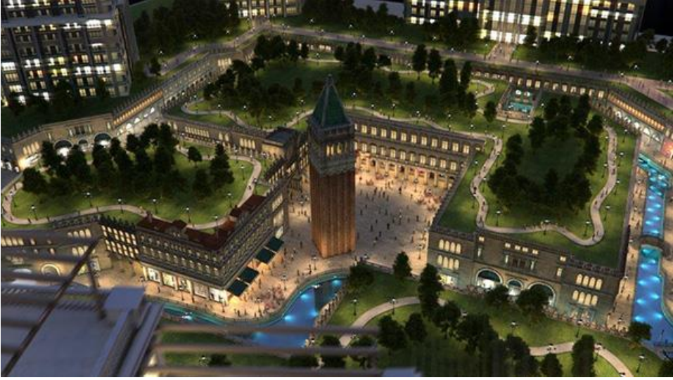
Resim 5.21. Viaport Venezia’nın San Marco Meydanı sunumu

“Proje Venedik yaşamının kapılarını aralıyor. İstanbul’un en şık italyanı olarak boy gösteren Viaport Venezia projesi, Venedik rüyasını gerçeğe dönüştürüyor. Projede Venedik saraylarından esinlenerek tasarlanan saray dairelerinde oturacak olan daire sakinleri, Venedik’in meşhur kanallarında gondollarla gezebilecek, Venedik meydanlarında alışveriş yapabilecek, dostlarını Venedik restoranlarında ağırlayabilecek. San Marco Meydanı’nın yanı başında kahvesini yudumlayabilecek” (www.viaportvenezia.com).