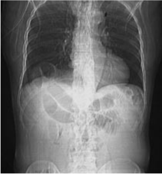
Resim 2. Toraks CT. Diyafragma devamlılığının bozulması ve sağ hemitoraks'a fitiklaşan barsak ansları.