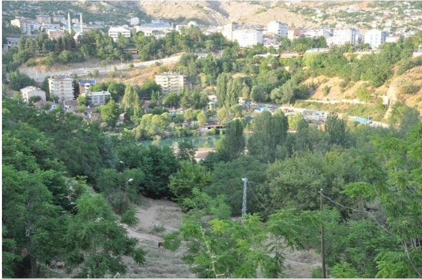
Tunceli kenti kuzeyden görünüm