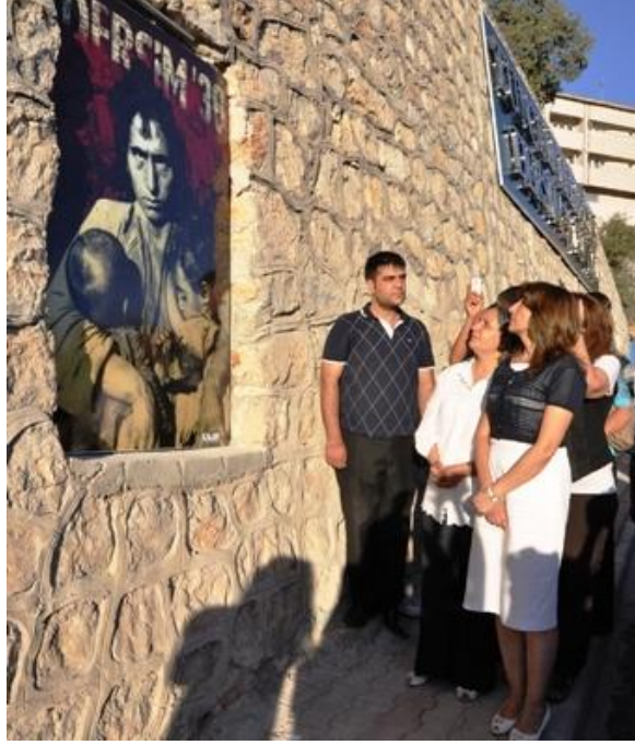
Dersim 38 duvarı