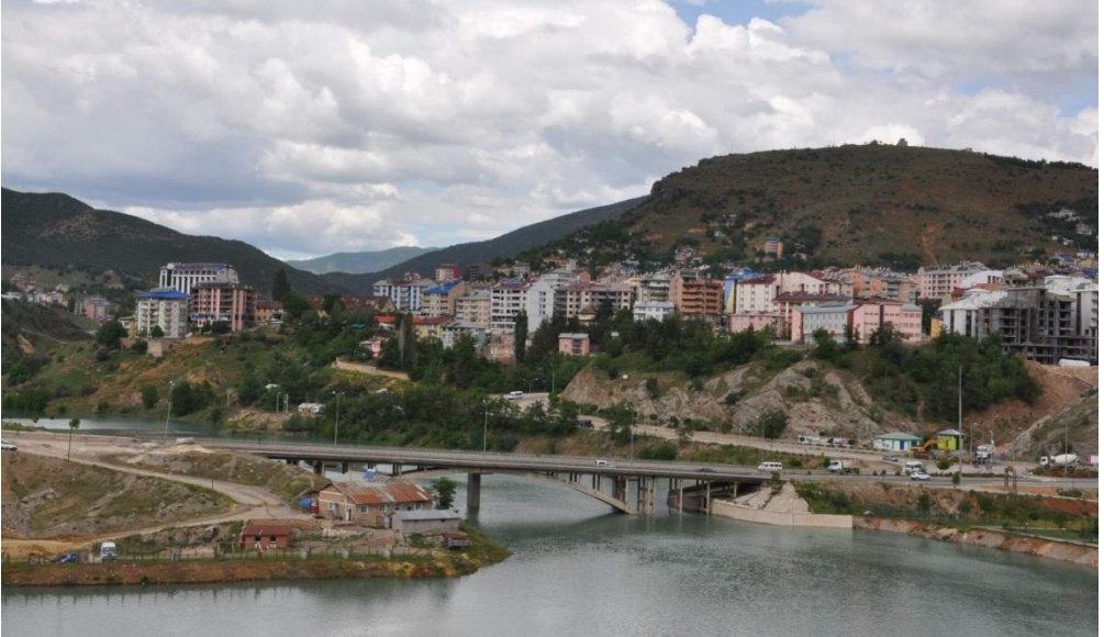
Munzur suyu ve Tunceli kent merkezine giriř