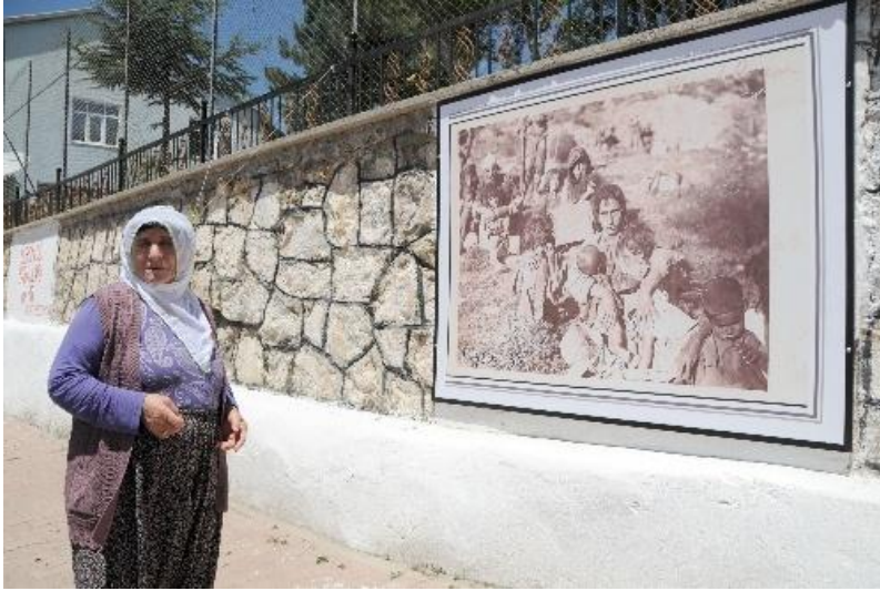
Hatırlatmanın mekânsallarına örnek; Dersim 38 Duvarı, Tunceli kent merkezi