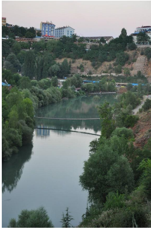
Munzur suyundan başka bir görünü