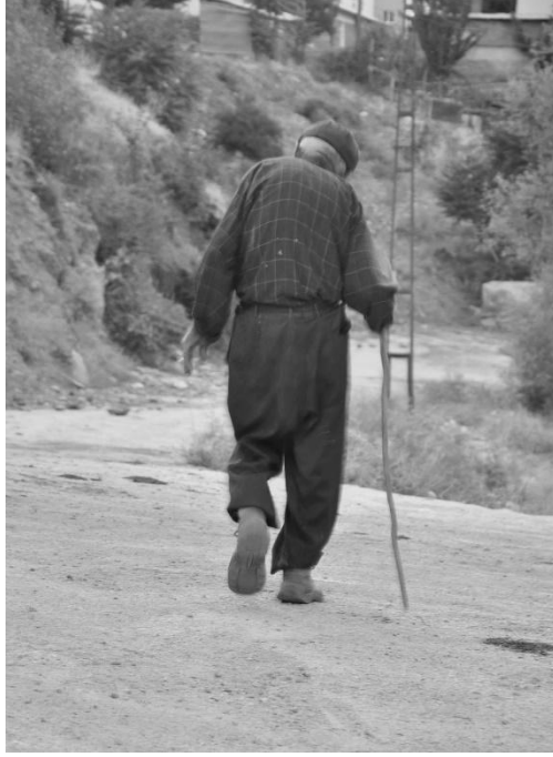
Kentin merkezinde dolařan bir Alevi Dedesi