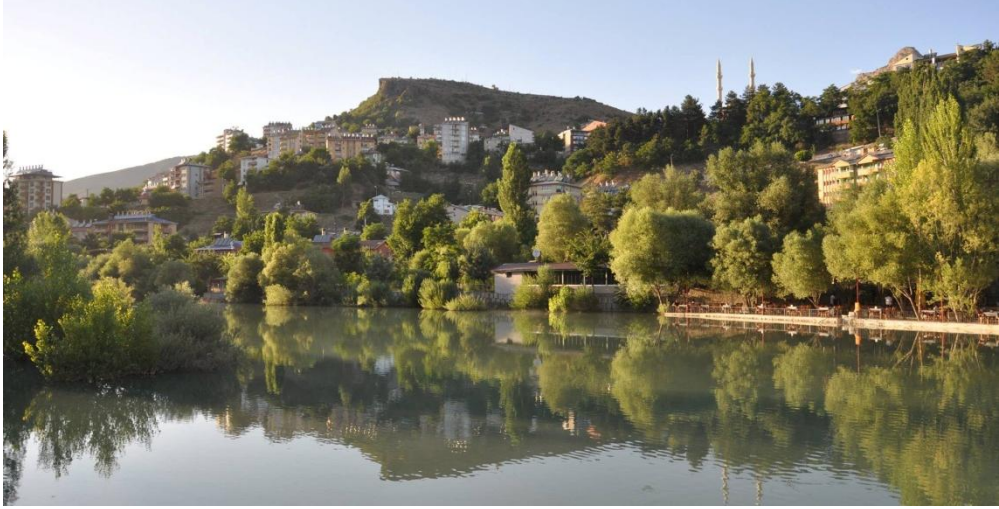
Barajların yapılmasından sonra durulan Munzur suyu