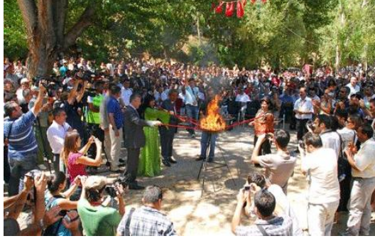
Munzur Doğa ve Kültür Festivali-I