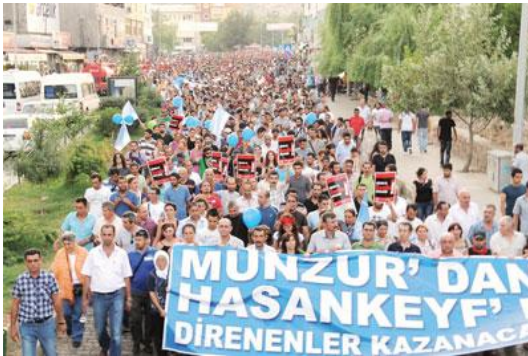
Munzur Doğa ve Kültür Festivali-III: Bölgede yapılacak olan HES'lere karşı eylem