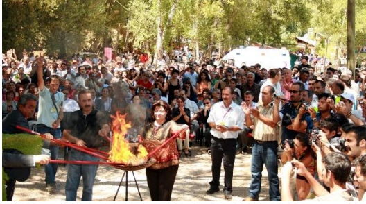
Munzur Doğa ve Kültür Festivali-II